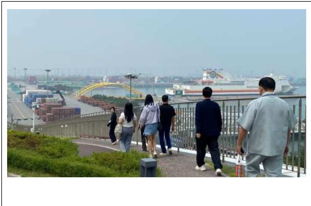
2024 年亞洲郵輪聯盟(ACC)區域工作會議-參訪仁川郵輪港旅客中心