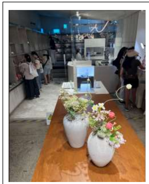
2024 年亞洲郵輪聯盟(ACC)區域工作會議-參訪聖水 AMORES 品牌體驗店