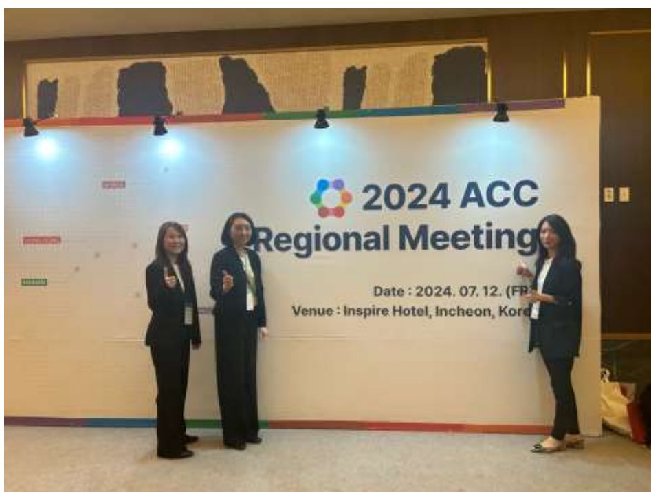
2024 年亞洲郵輪聯盟(ACC)區域工作會議-台灣代表團合影