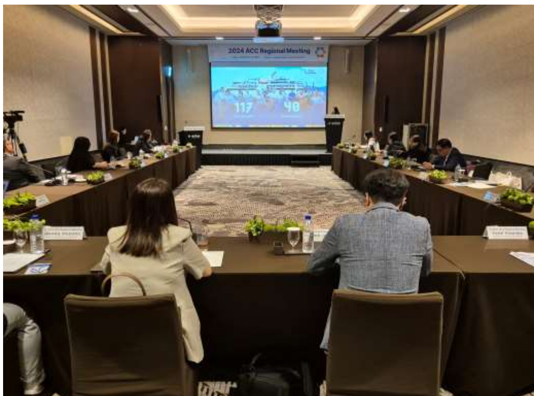
2024 年亞洲郵輪聯盟(ACC)區域工作會議