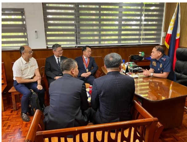
▲圖 15：與 PNPA 校長意見交流