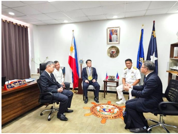
▲圖 7：與 PMMA 校長意見交流