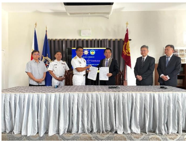
▲圖 9：本校與 PMMA 雙方人員共同見證簽署儀式