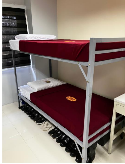
▲圖 20：PNPA 宿舍區內務擺設-寢具及鞋類