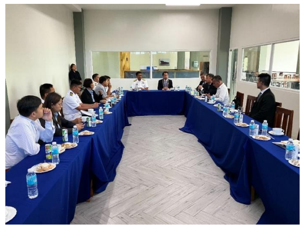
▲圖 10：PMMA 校況簡報及意見交流