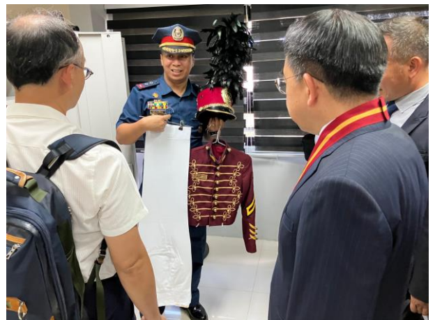
▲圖 18：介紹 PNPA 學員制服