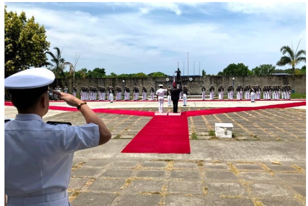
▲圖 6：PMMA 迎賓儀式—校閱儀隊