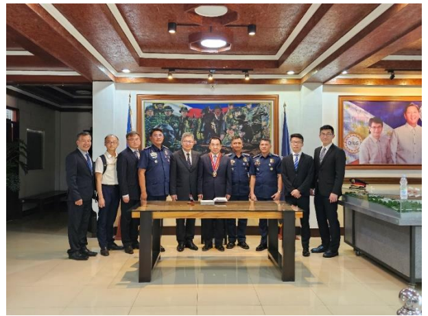
▲圖 14：PNPA 迎賓簽名留言暨合影留念