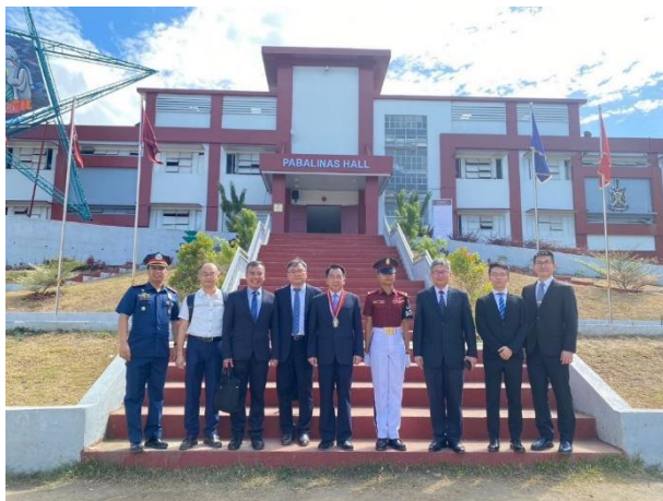
▲圖 17：PNPA 校園參訪與學員合影