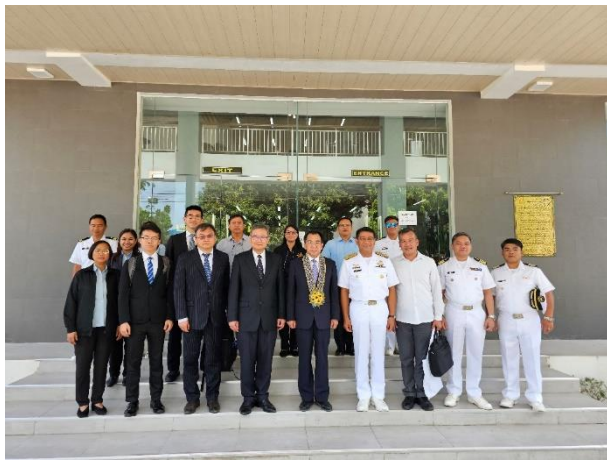
▲圖 13：本校與 PMMA 雙方人員合影留念