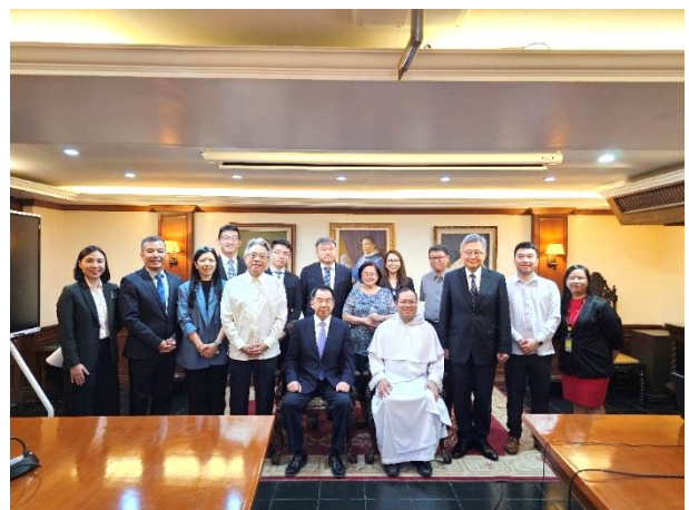
▲圖 4：本校與 UST 雙方人員合影留念