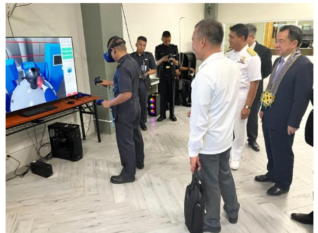
▲圖 12：參訪 PMMA 訓練設備