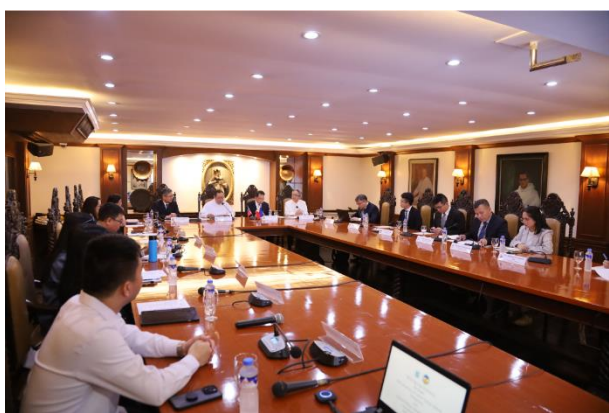
▲圖 5：UST 校況簡報及意見交流座談