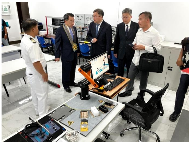
▲圖 11：參訪 PMMA 訓練設備