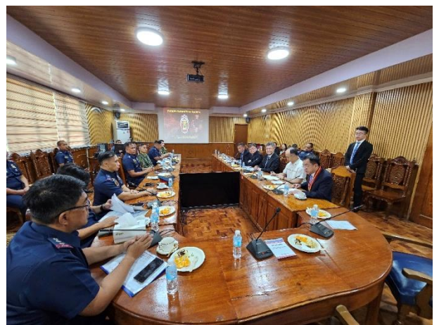
▲圖 16：PNPA 校況簡報及意見交流