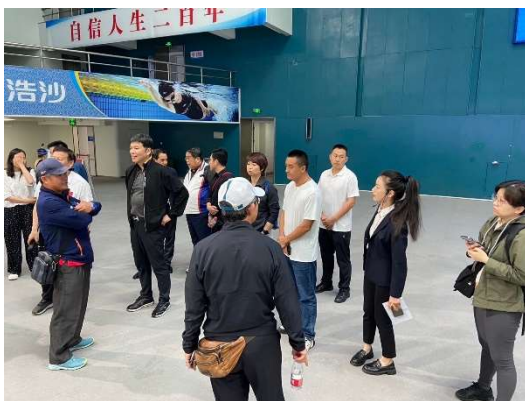
奧體中心游泳跳水館比賽池解說