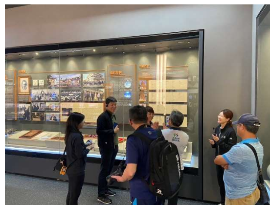
參觀東安湖體育館世大運博物館