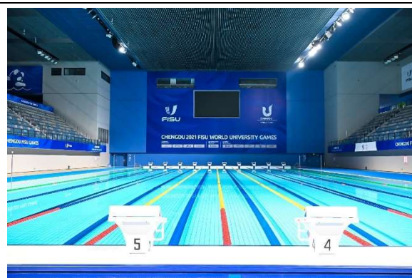
東安湖體育館游泳跳水館