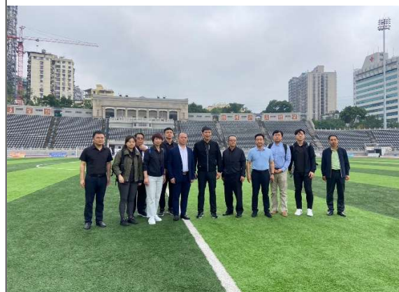
大田灣體育場足球場合影