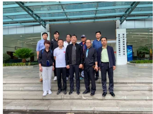
重慶市奧林匹克體育中心前合影