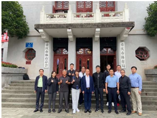
重慶市體育局前合影