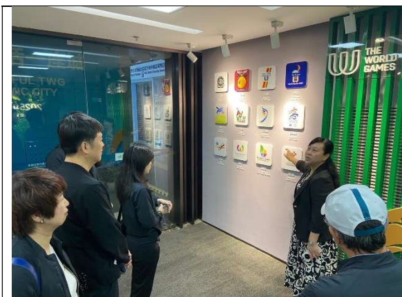
參觀成都世運會執委會辦公室