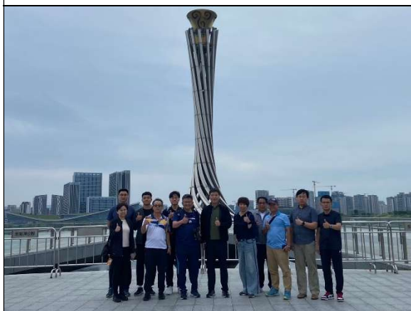
與成都世大運火炬塔合影