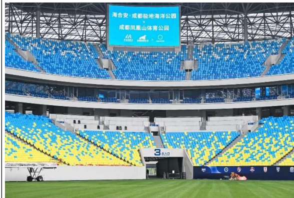
鳳凰山體育公園足球場