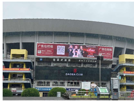
奧體中心體育場外牆活動看板