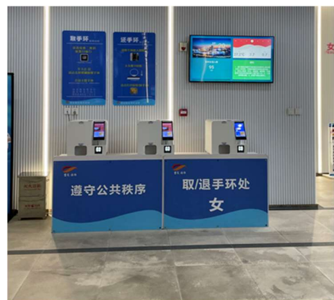
奧體中心跳水館人員進出使用智能設施