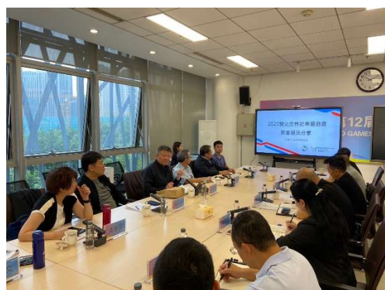
臺北市政府林哲宏副秘書長簡報分享