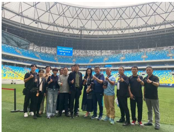
鳳凰山體育公園足球場合影