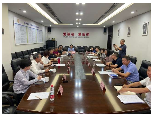
與成都市體育局座談