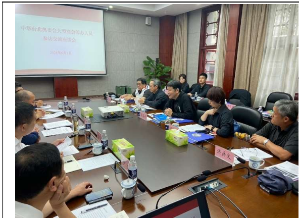
與重慶市體育局交流座談