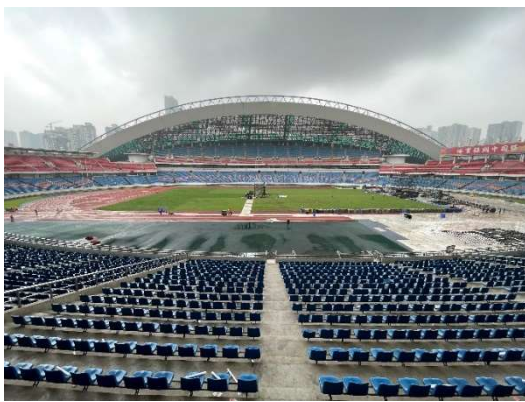
奧體中心體育場內部