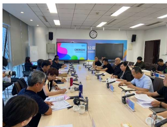
與成都世運動執委會座談