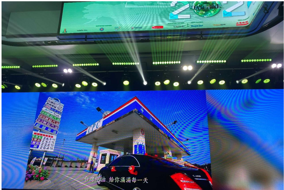
圖 5 主辦單位播放本公司企業形象影片