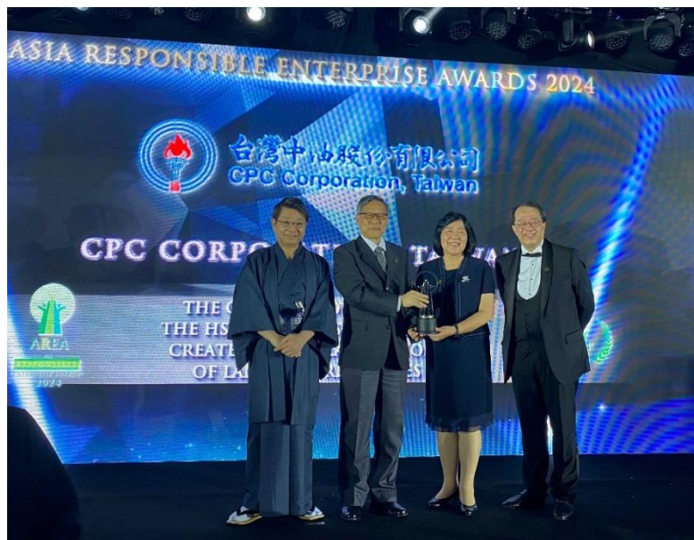
圖 6 本公司領(循環經濟領袖)獎、接受表揚

彙整有關本次亞洲企業社會責任獎(AREA)頒獎典禮辦理情形及本公司接受表揚、領獎情形等如圖 6-圖 9。