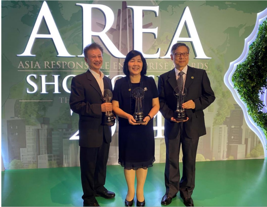
圖 8 本公司獲 AREA 三大獎項