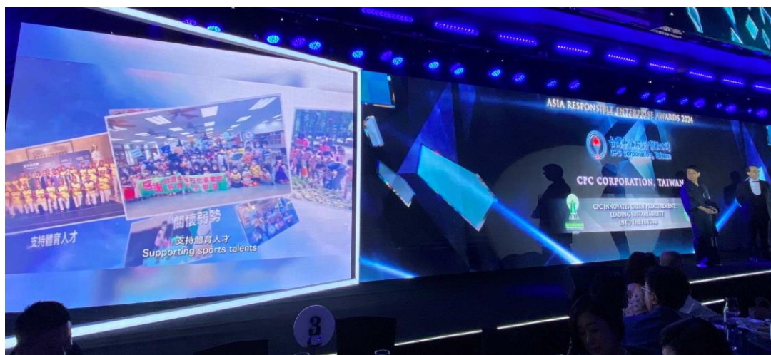
圖 7 主辦單位介紹本公司永續報告書獎專案影片