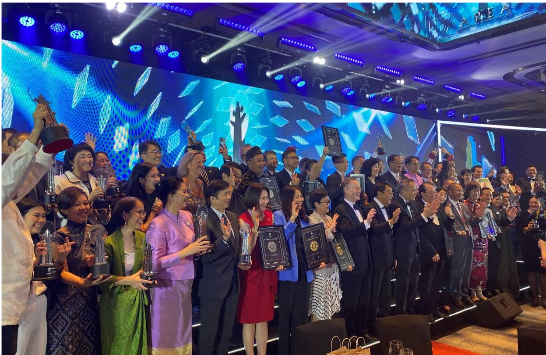
圖 9 2024 AREA 獲獎企業合影