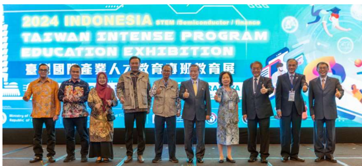
圖 9. 2024 年 3 月 19 日印尼新型專班教育展開幕式