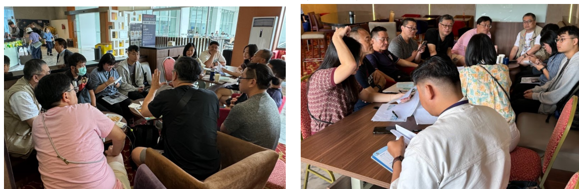
圖 3. 2024 臺灣國際產業人才教育專班教育展籌備小組工作情形