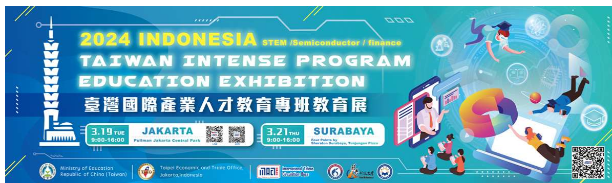
圖 1. 臺灣國際產業人才教育專班教育展海報橫幅