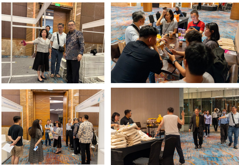
圖 5. 2024 臺灣國際產業人才教育專班教育展團場地佈置情形