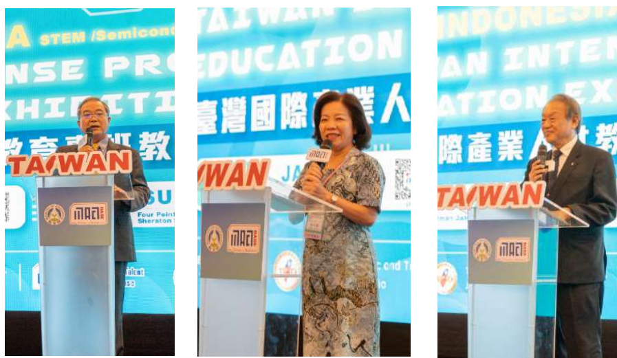
圖 7. 2024 年 3 月 19 日(二)印尼新型專班教育展臺灣方代表致詞情形

「2024 臺灣國際產業人才教育專班教育展」雅加達場次，於 3 月 19 日(二)上午 9 時 30 開始開幕典禮，由陳忠大使致詞為活動揭開序幕，然後是教育部代表楊玉惠司長致詞及印尼海外基地代表正修科技大學龔瑞璋校長致詞。