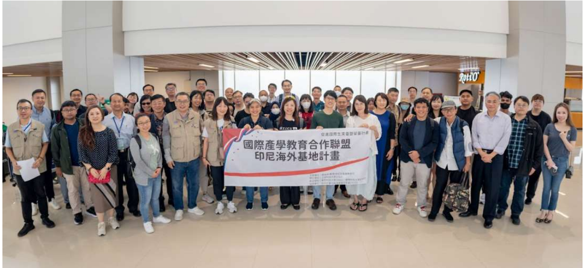
圖 15. 「2024 臺灣國際產業人才教育專班教育展」團隊成員抵達泗水機場