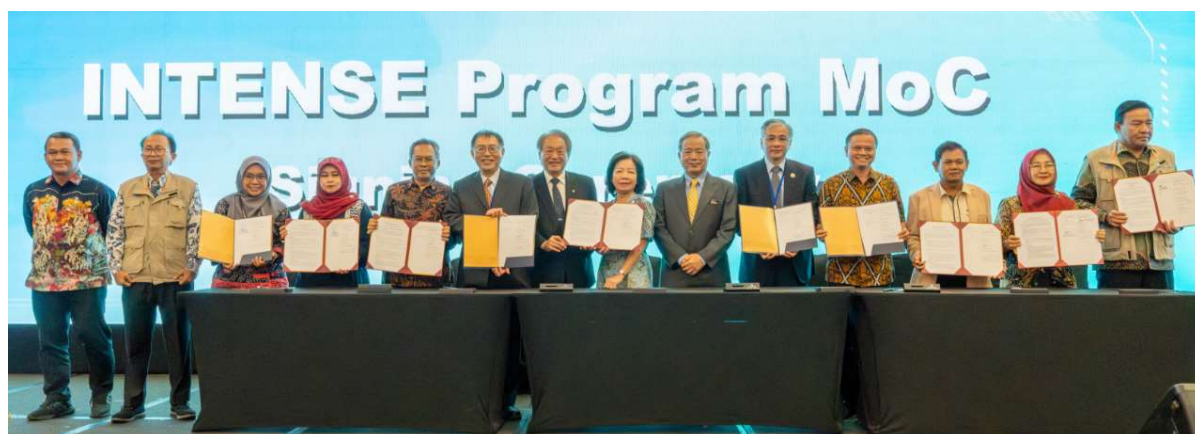
圖 10. 2024 年 3 月 19 日印尼新型專班雅加達教育展 MOC 簽約儀式合照

經會後統計，「2024 臺灣國際產業人才教育專班教育展」雅加達場次共 62 所印尼學校代表與會，包括公立理工大學 22 所、私立理工大學 1 所、公立大學 1 所、私立大學 38 所。印尼海外基地揭牌儀式時，已與印尼公立理工大學 31 校簽定 MOC(印尼公立理工大學共計有 44 校)。本次另增加 2 所公立理工大學、2 所私立理工大學及 14 所私立大學簽約合作，目前已經完成 MOC 共 49 份。