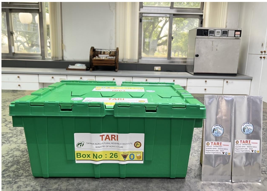
圖 4. 送往斯瓦爾巴全球種子庫的種原用鋁箔袋包裝並置於物流箱中運送。