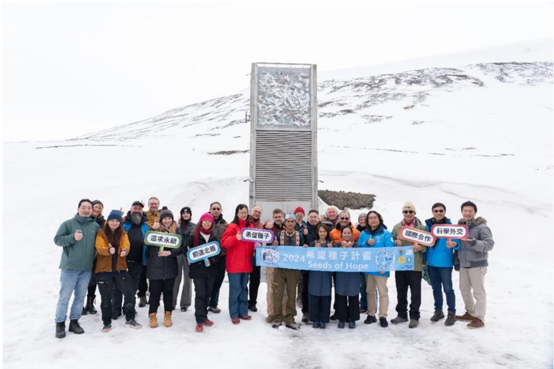
圖 7. 希望種子入庫儀式參加人員於斯瓦爾巴全球種子庫入口前合照。