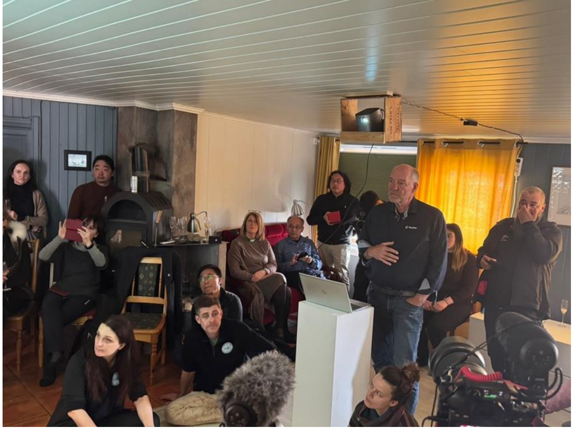
圖 1. 斯瓦爾巴全球種子庫負責人蒞臨「台灣極地研究中心」介紹該種子庫。