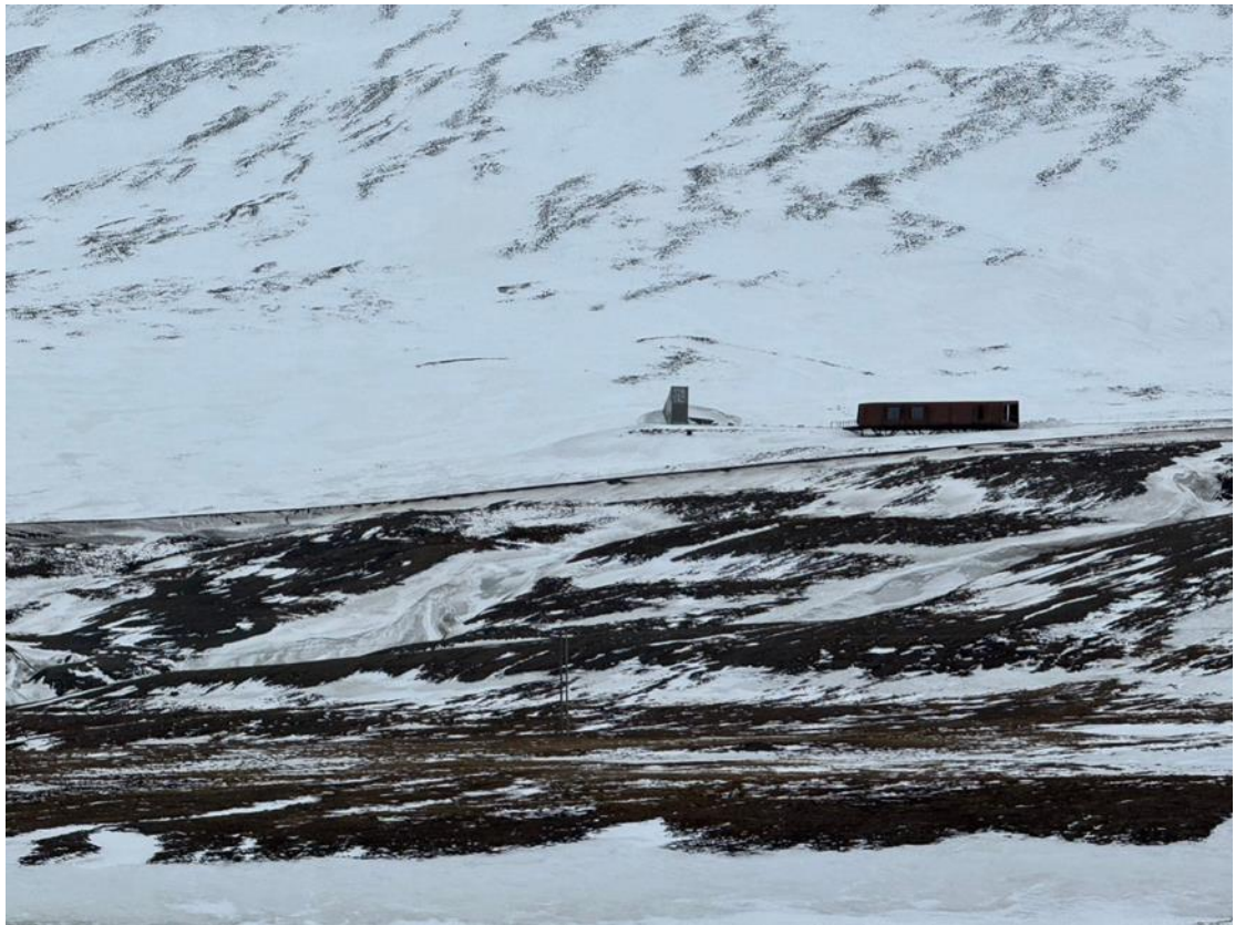
圖 2. 斯瓦爾巴全球種子庫建造在永凍層的洞穴內。