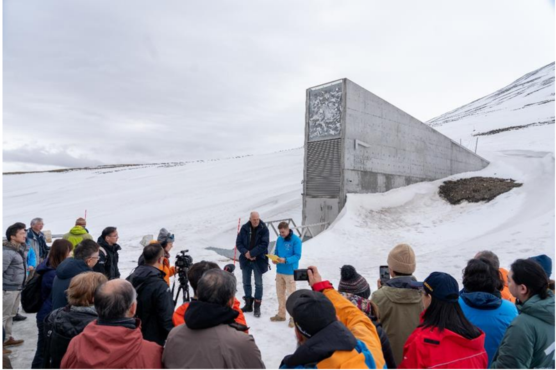
圖 5. 2023 年 5 月 29 日於斯瓦爾巴全球種子庫戶外舉行希望種子入庫儀式。