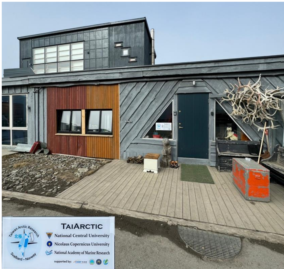
圖 8. 國立中央大學在挪威士瓦爾巴群島成立「台灣極地研究中心」。