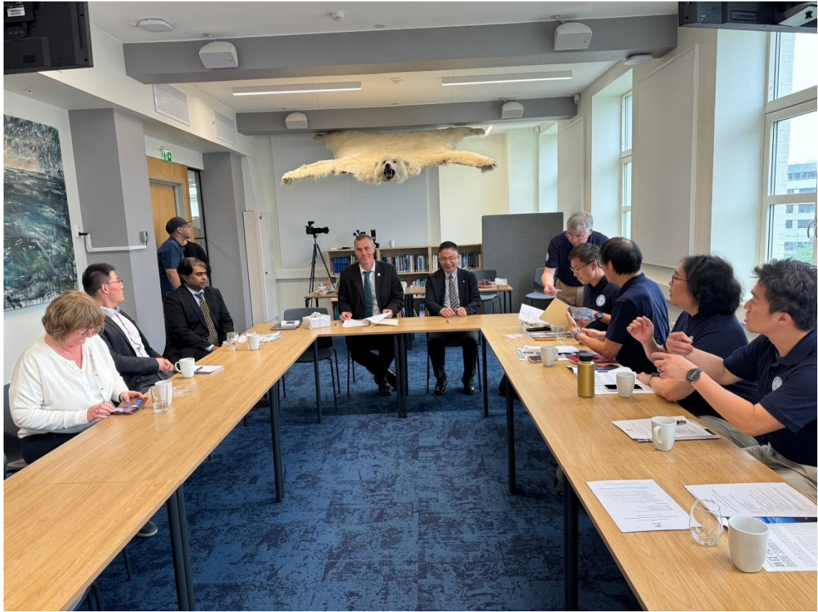
圖 9. 2023 年 5 月 27 日國立中央大學與南森遙測中心簽署雙邊合作備忘錄。