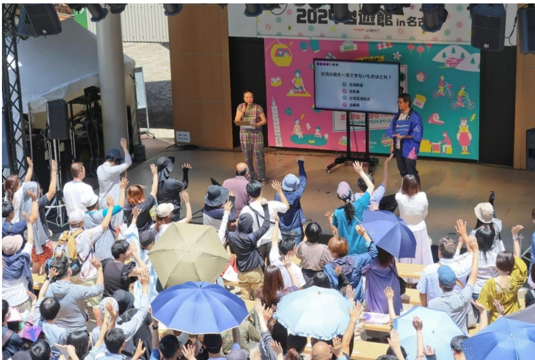
圖十：日本民眾踴躍參加台灣旅遊知識問答遊戲。