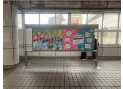
金山綜合駅 集中貼りモニター写真 (北側)