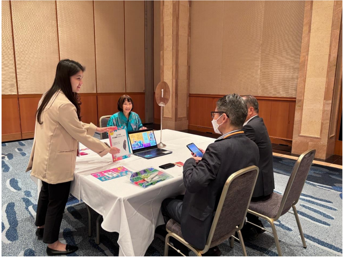
圖四：商談會現場台日業者交流情形 2，促成超過 50 場商務洽談。