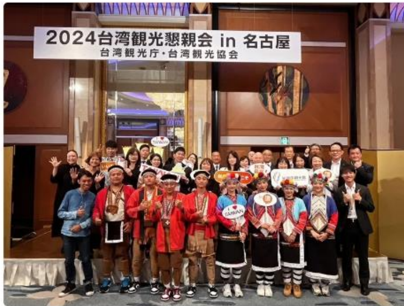
鄒族舞蹈跳進日本名古屋 演繹台灣特色 交通部觀光署與台灣觀光協會率旅行社、飯店及觀光業者組成代表團，赴日本名古屋舉辦台灣B2B推廣會，18、19日並舉行「2024台遊館in名古屋」Roadshow活動，邀請來自阿里山的鄒族專業舞團「跳動的山林」，帶來結合鄒族古謠和現代舞蹈的精彩演出。113年5月19日