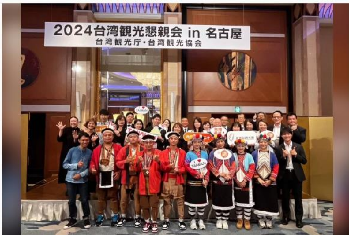
2024年交通部觀光署名古屋地區觀光推廣會台灣代表團及表演團體全體合照。