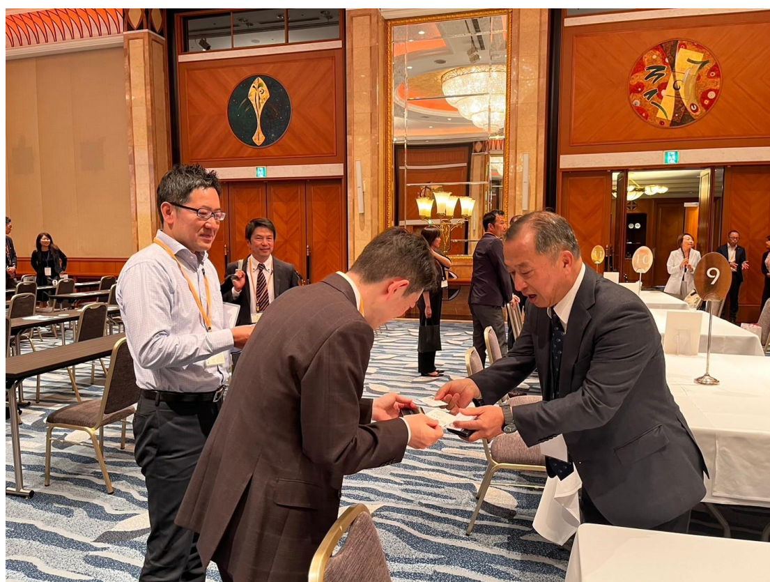
圖三：商談會現場台日業者交流情形 1，促成超過 50 場商務洽談。