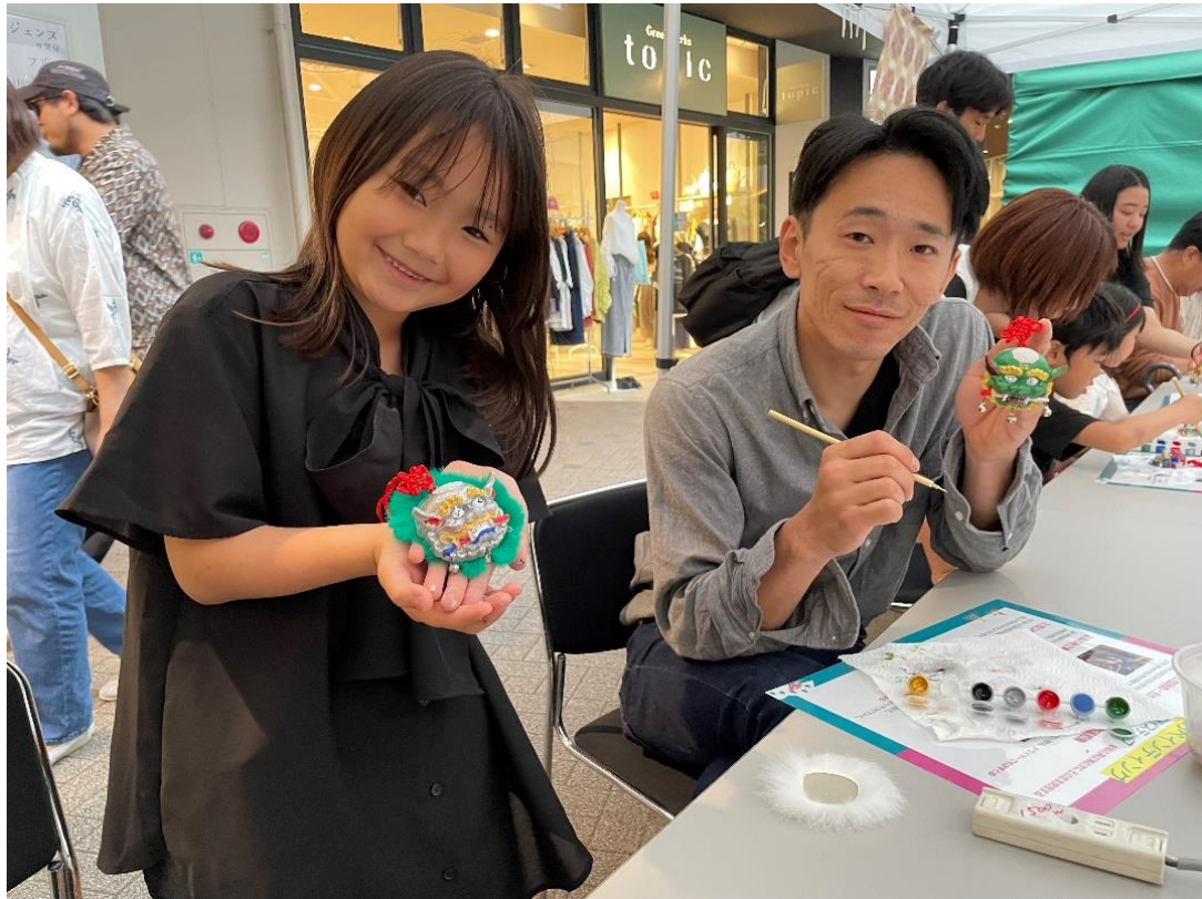
圖十四：日本親子一同體驗台灣彩繪獅頭 DIY 活動，現場反應熱烈。