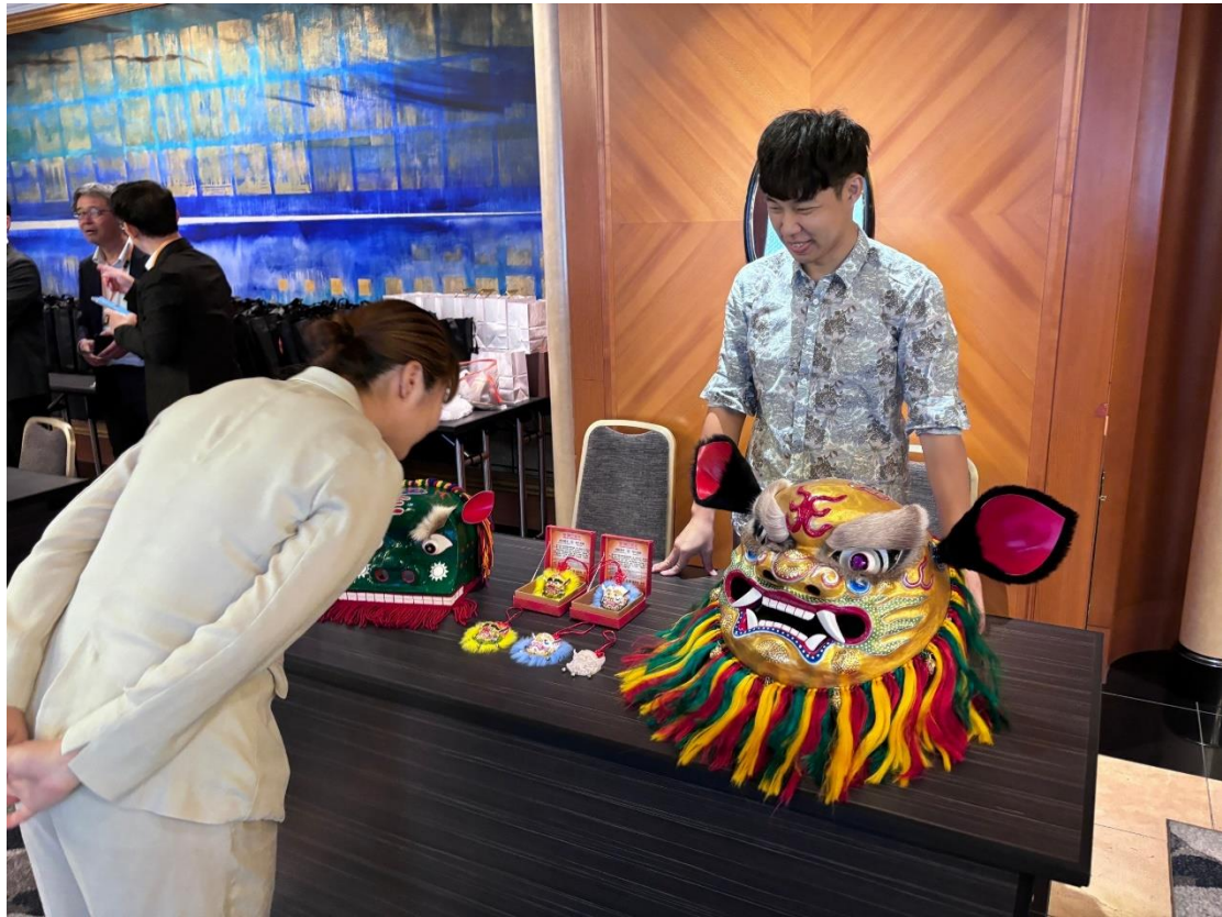
圖八：說明會現場展示台灣傳統技藝「獅頭彩繪」DIY 體驗。