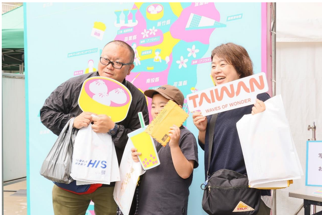
圖十五：活動現場舉辦集章抽獎，日本民眾踴躍參與。