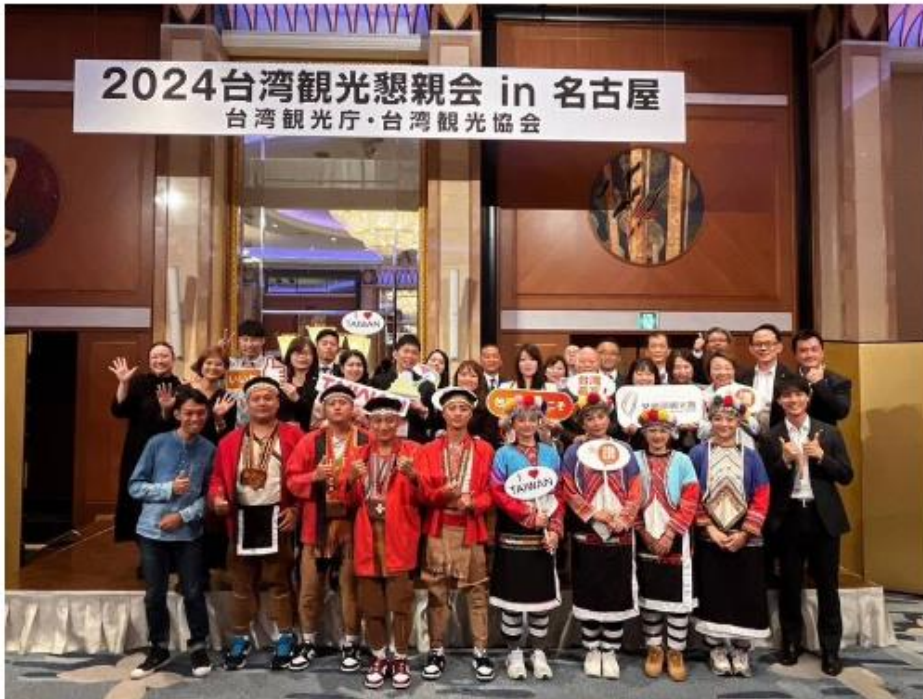
2024年交通部觀光署到日本名古屋宣傳我國觀光。