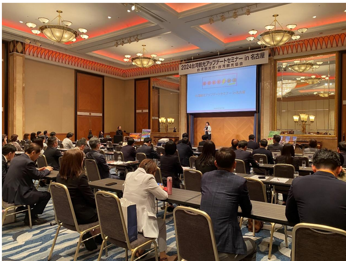
圖二：名古屋業者推廣說明會現場向業者分享各種台灣旅遊資訊。