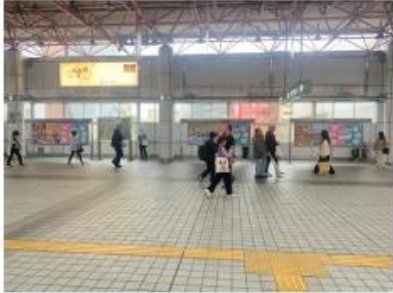
金山綜合駅 集中貼りモニター写真 (北側)