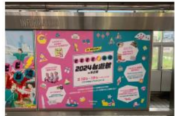
金山総合駅 集中貼りモニター写真 (南側)