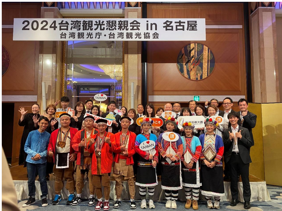
圖九：台灣代表團合影。