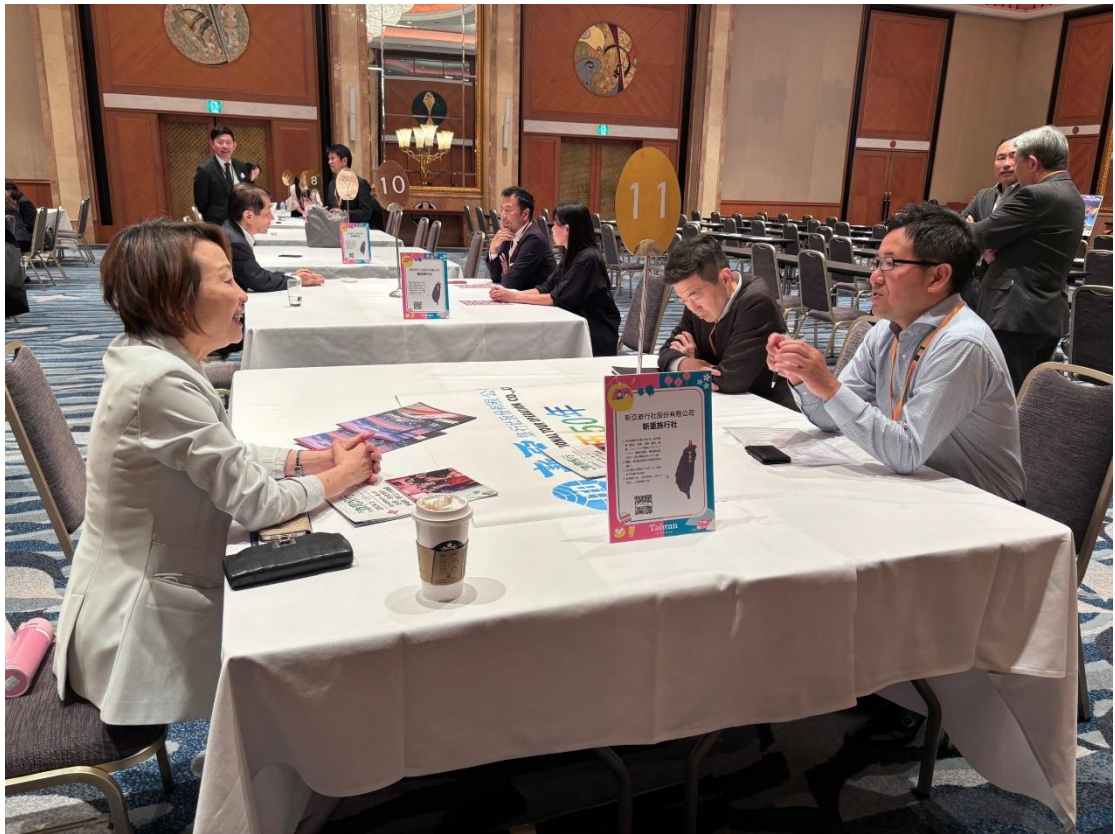
圖五：商談會現場台日業者交流情形 3，促成超過 50 場商務洽談。