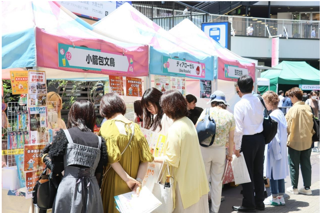
圖十二：現場攤位人潮眾多，讓日本民眾親自體驗台灣豐富的文化魅力。