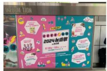
金山総合駅 集中貼りモニター写真 (南側)