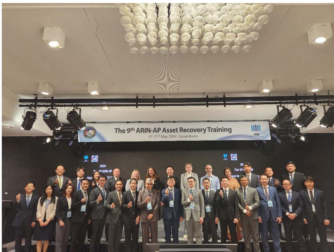
全體與會人員開幕合影

務」(Dark Finances and Underground Banking Services) 及「澳洲刑事犯罪資產追返制度之現況」(Operation Elbrus: Australia's criminal assets recovery regime in action) 做介紹。短暫休息後進入第三個場次的座談討論，主題為「強化 ARIN-AP 合作之策略」(Comprehensive Discussion toward Enhancement of Cooperation through ARIN-AP)。以下以每日議程 1 依序介紹之。