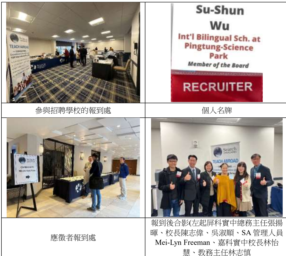
圖 1 報到情形