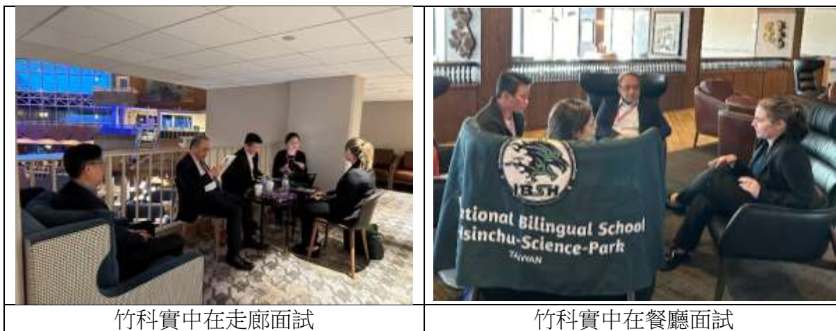
竹科實中在走廊面試