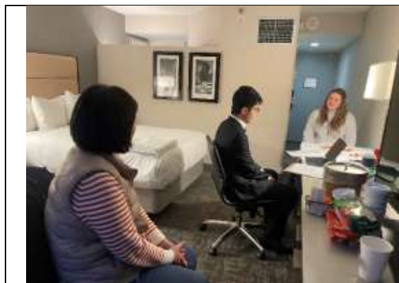
屏科實中在房間面試

出差報告人亦出席南科實中 2 場、屏科實中 3 場、嘉科實中 2 場、竹科實中 3 場次的面試，協助拍照、回應有關科學園區發展及現況、學校未來建設期程或學校經費來源等相關問題。