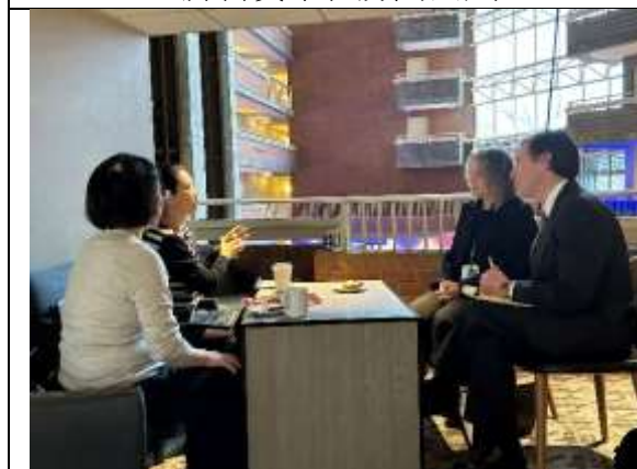
南科實中在走廊面試