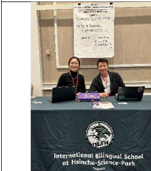
竹科實中預約面試攤位