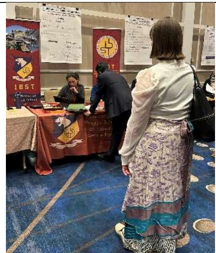
南科實中預約面試