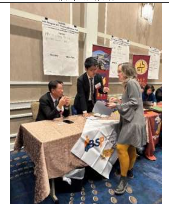
屏科實中預約面試