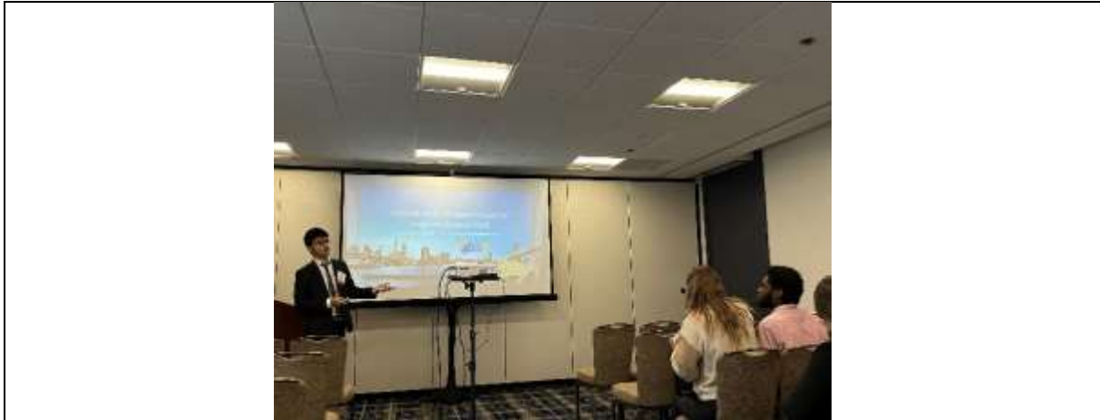
屏科實中進行學校簡介