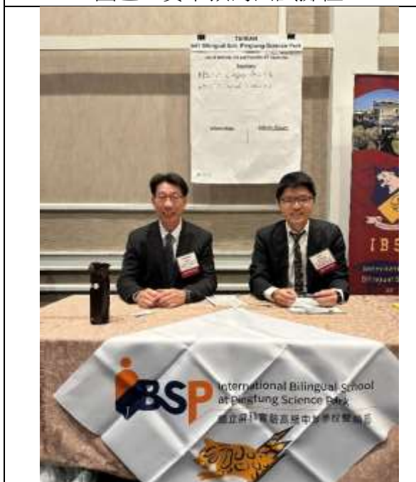
屏科實中預約面試攤位