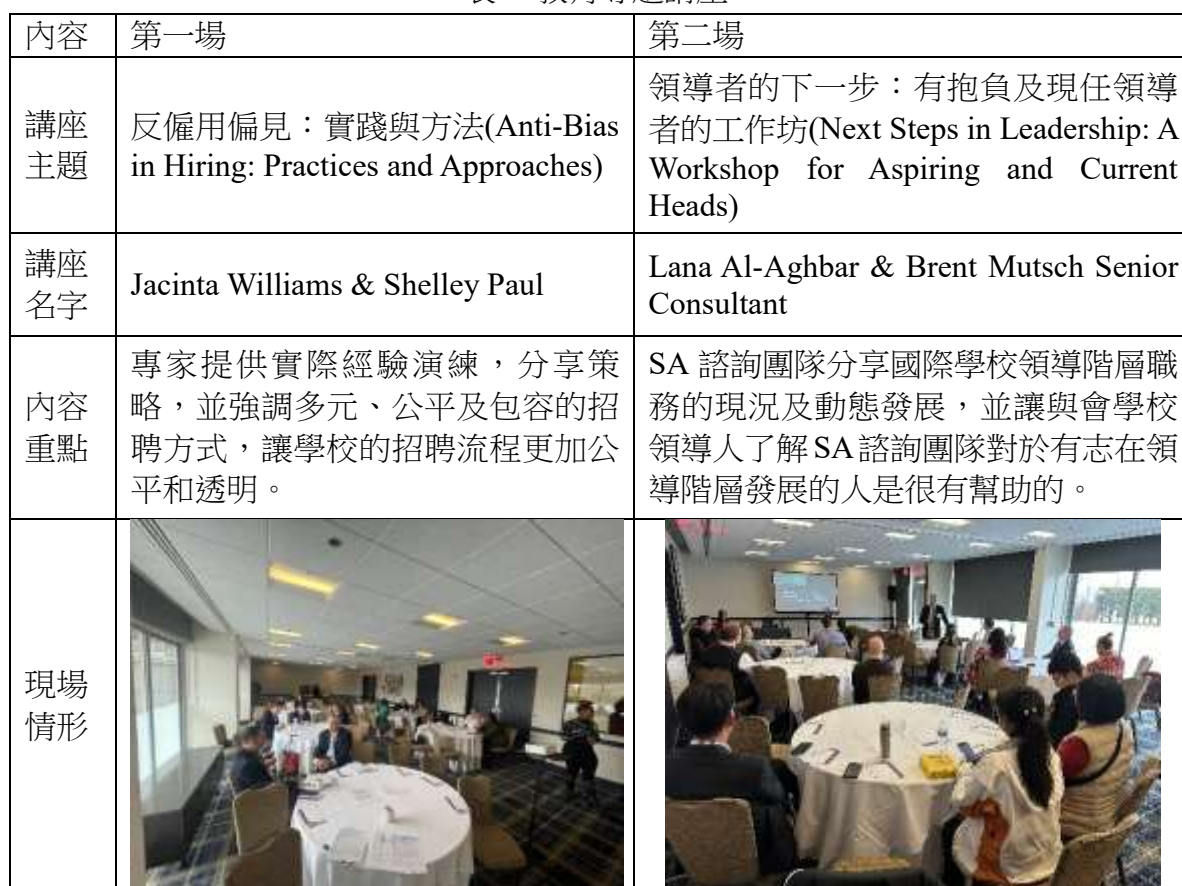
表 4 教育專題講座