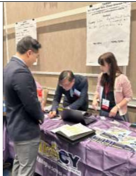
嘉科實中預約面試