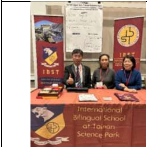
南科實中預約面試攤位