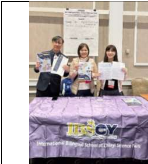
嘉科實中預約面試攤位