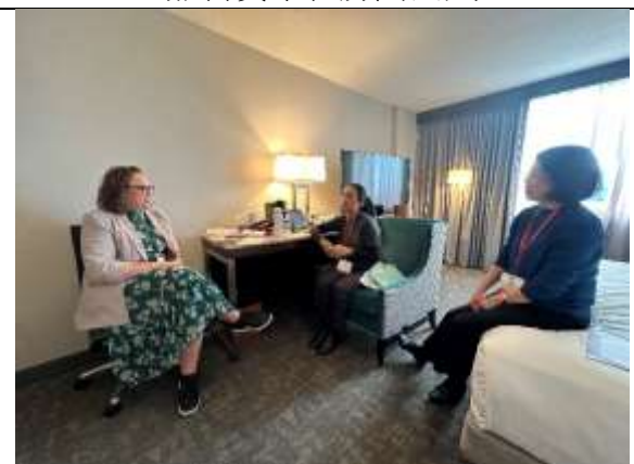
南科實中在房間面試