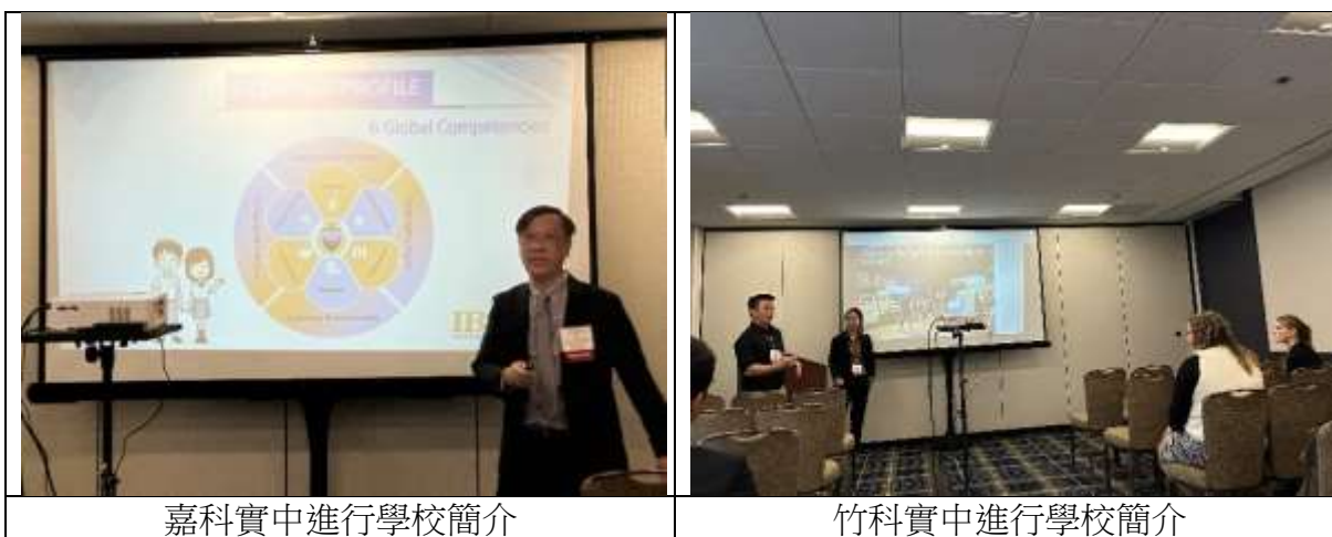
嘉科實中進行學校簡介

主辦單位於美國時間 1 月 28 日(臺灣時間 1 月 28 日-1 月 29 日)安排參與的學校向應徵者介紹學校概況、薪資福利等簡報時間，園區 4 實中分別於美國時間 28 日上午 10-12 點(臺灣時間 1 月 28 日-1 月 29 日)進行介紹，各學校皆準備了投影片簡介、影片，也準備了有臺灣意象的小點心當做禮物，以吸引應徵者的目光，影片加深了應徵者對學校的印象。簡報的過程中，除了介紹課程、家長學生背景、學校環境外，對於臺灣的地理環境、消費水平，也做許多物價、所得稅、存款等金融介紹。此外，有關學校周邊環境、課程、軟硬體設施、學生概況與教師的薪資福利、宿舍的內、外環境、學校教職員的工作氛圍、外籍配偶及子女生活的相關協助等，也多有著墨。南科實中更邀請已離職回美國的外籍老師，目前在美國加州從事教職，特地從加州過來，在現場現身說明當初在南科實中任教的經驗，透過外國人的經驗分享，對於招募外籍教師，是很好的見證，也更能說服在場的應徵者。