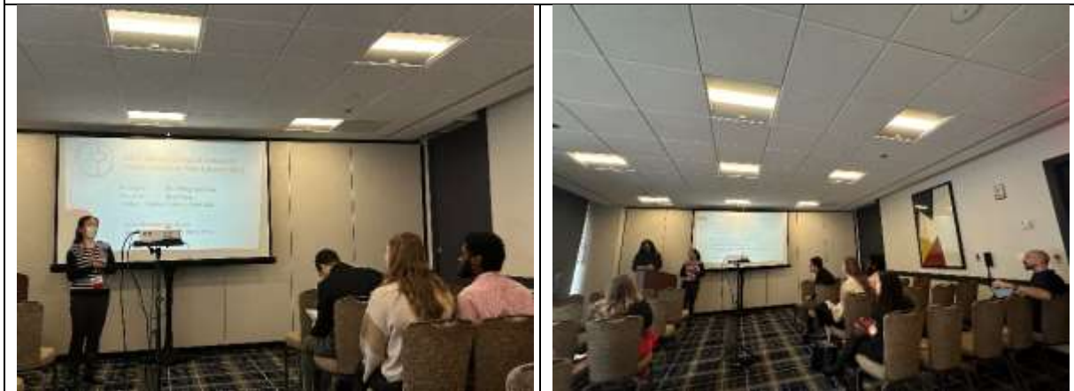
南科實中進行學校簡介及離職外師經驗分享