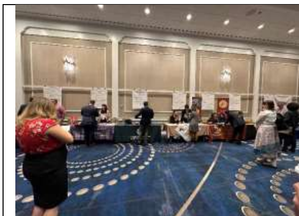
園區 4 實中預約面試攤位

平台上預約：主辦單位為利無法到達現場辦理預約者，使用 Fair Portal App 作為應徵者與招聘學校互動的平台，讓無法當日預約者或面談時間預約後，想隨時取消或更改時間的應徵者，可透過此平台發布或查看訊息，以及時回應及調整時間。除此之外，招聘學校也可透過此平台發送訊息，邀請有來博覽會現場的教師參與學校交流面談。