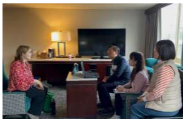
嘉科實中在房間面試