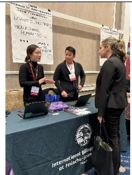
竹科實中預約面試