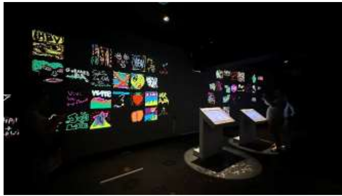
▲《加载中：數位時代的城市藝術》展場一隅