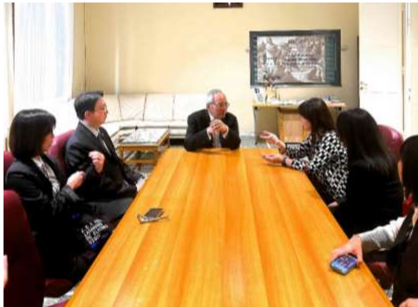
▲文化部訪團與駐教廷大使館就推動臺梵文化外交成果及未來與駐義文化組合作共同推動文化交流等議題廣泛交流