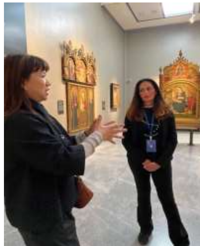
▲李次長與波隆那國家美術館專業導覽人員交流