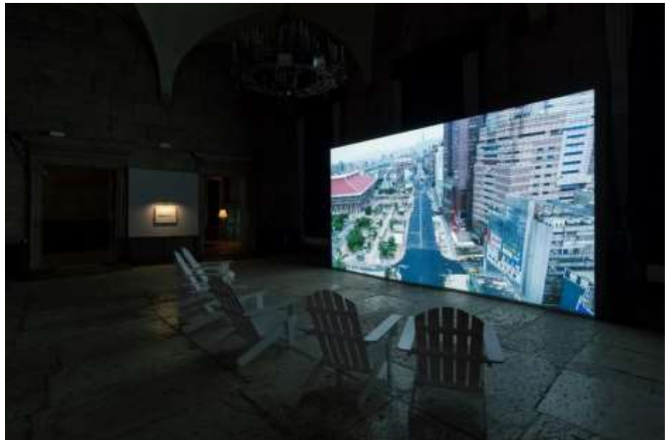
▲「袁廣鳴：日常戰爭」展場照