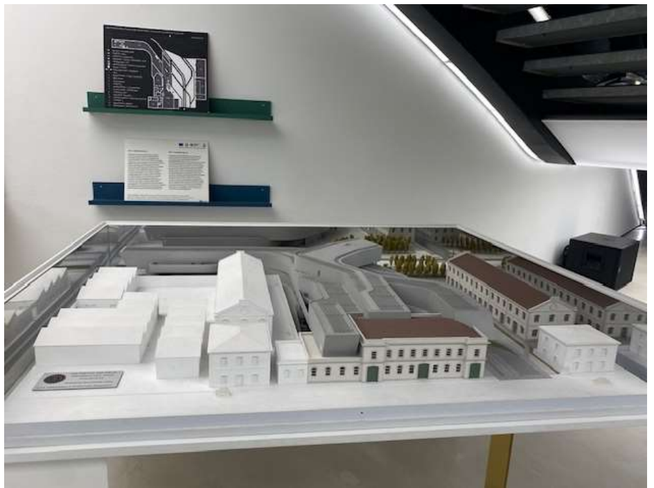
▲ 從模型可以更清楚看到 21 世紀藝術博物館是一個新舊建物融合的博物館