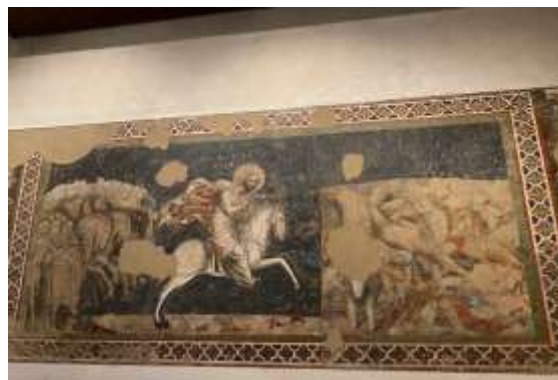
▲波隆那國家美術館展示了大量濕壁畫的作品，其中有些作品更是在刨開一層牆面後，發現還存在另一個舊的作品，讓訪團印象深刻。