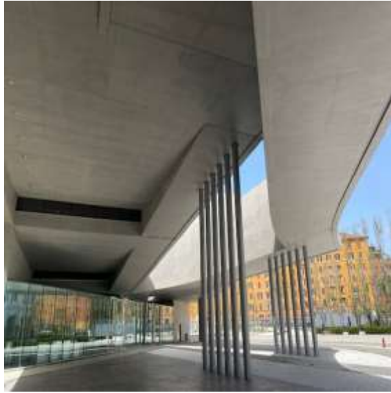
▲ 21 世紀藝術博物館入口