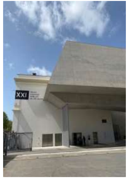
▲ 在新建物的後方就是舊建物