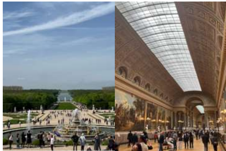
▲凡爾賽宮室內展場及戶外花園