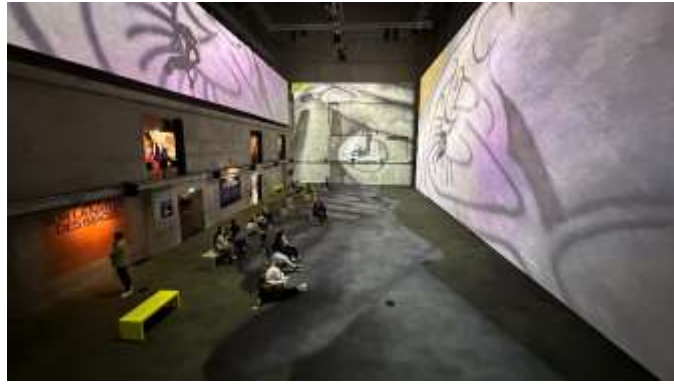
▲《加载中：數位時代的城市藝術》展場一隅