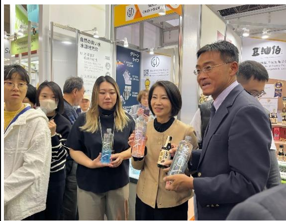
與屏東館業者交流