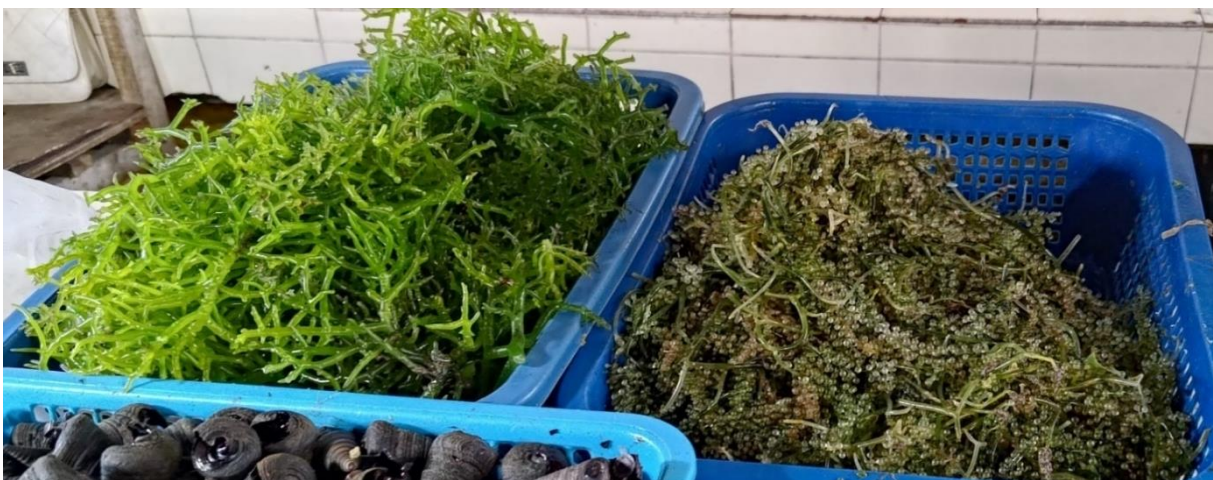
圖22 市場販售有3種新鮮海藻，上為野生種台灣無，下右為葡萄藻，下左為卡帕。