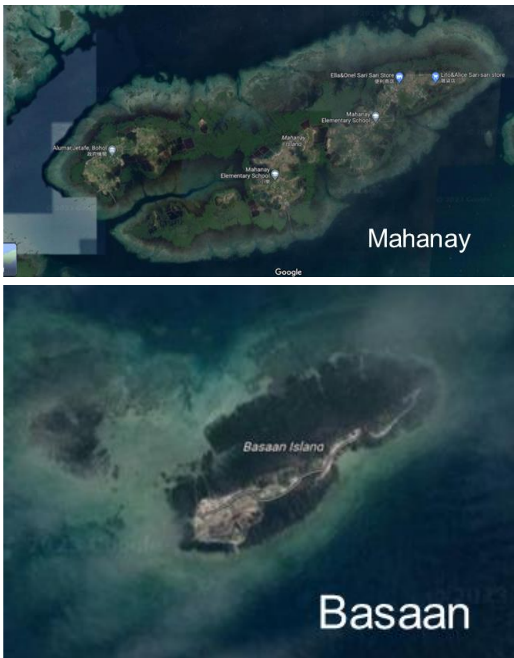
圖17 兩島嶼皆由紅樹林包圍，沙灘由紅樹林向外連綿百公尺。

Mahanay島養殖面積為200公頃，每月約採收100噸，共1000人力，當地法律規定每工人每天只可工作1公頃面積。Basaan島較小，養殖面積也較小，但是混養的馬尾藻較多，因此整體產量較Mahanay島高，但產值不如Mahanay島。