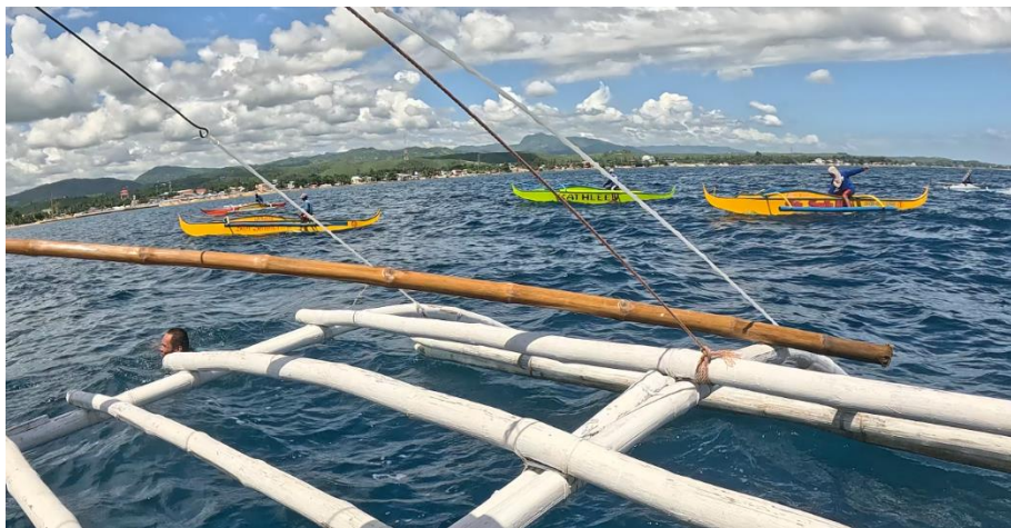
圖15 藻場聚集釣船及其釣獲之漁業資源