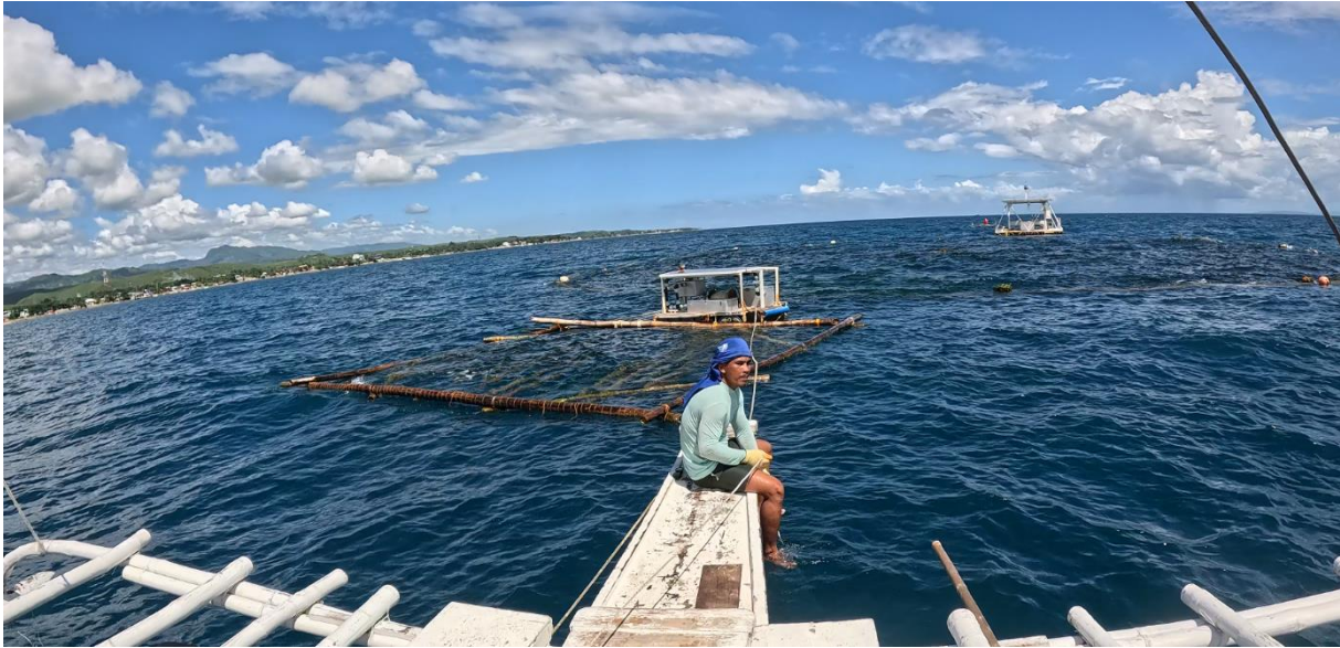
圖9 藻場設施配置，圖中由遠至近為太陽能平台、藻場、升降控制台及對照組。

11月8-9日前往大圈進行海水調查，並觀察其生態。大圈除升降藻場外，在旁邊另設有一方型藻場在海表不隨之升降，以作為對照組觀察海藻生長差異。大圈結構參考圖9，由遠至近依序為太陽能供電平台、藻場、控制台及對照組。藻場下方另有裝設一組網具收集藻類沉降，用於養殖藻類碳匯調查(圖11)。