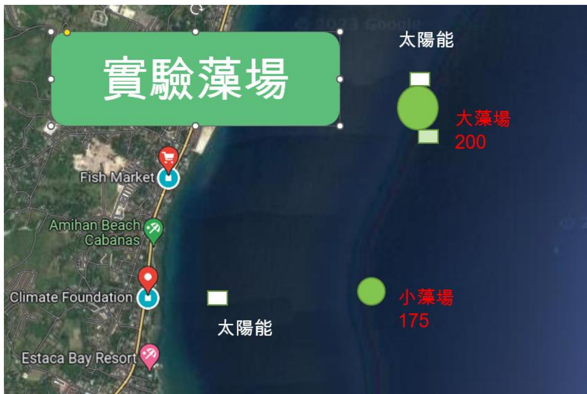
圖5 實驗藻場及工作站位置示意圖