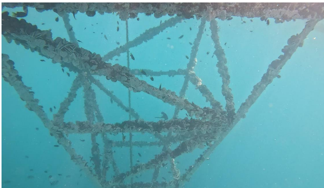
圖14 藻場下方附著生物，聚集多種雀鯛