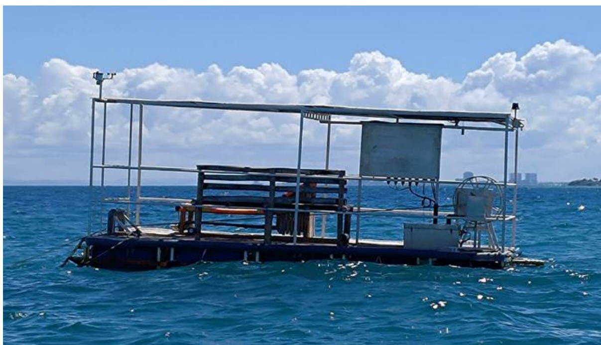
圖6 小圈之太陽能供電平台，升降示意圖(引用自基金會官網)