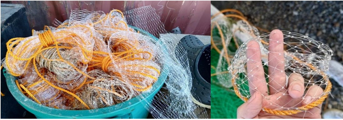
圖7 養殖藻類用的漁網