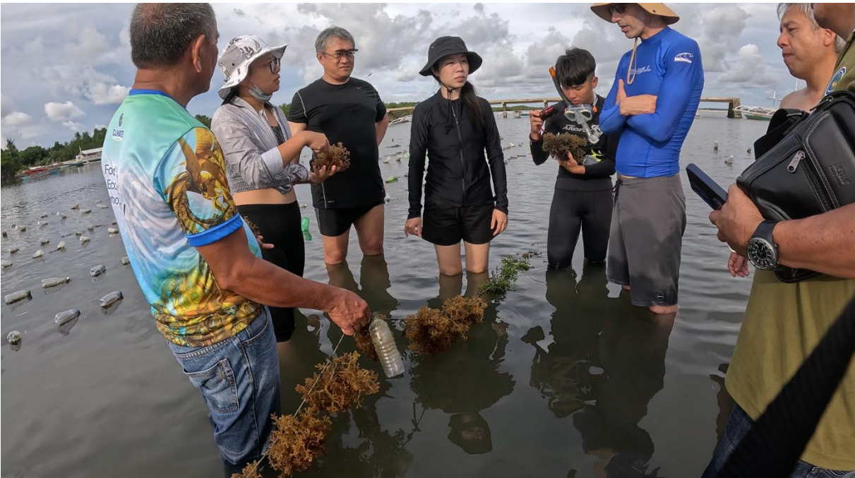
圖18 上:工作人員採收並清除雜藻，蹲著作業，避免彎腰。