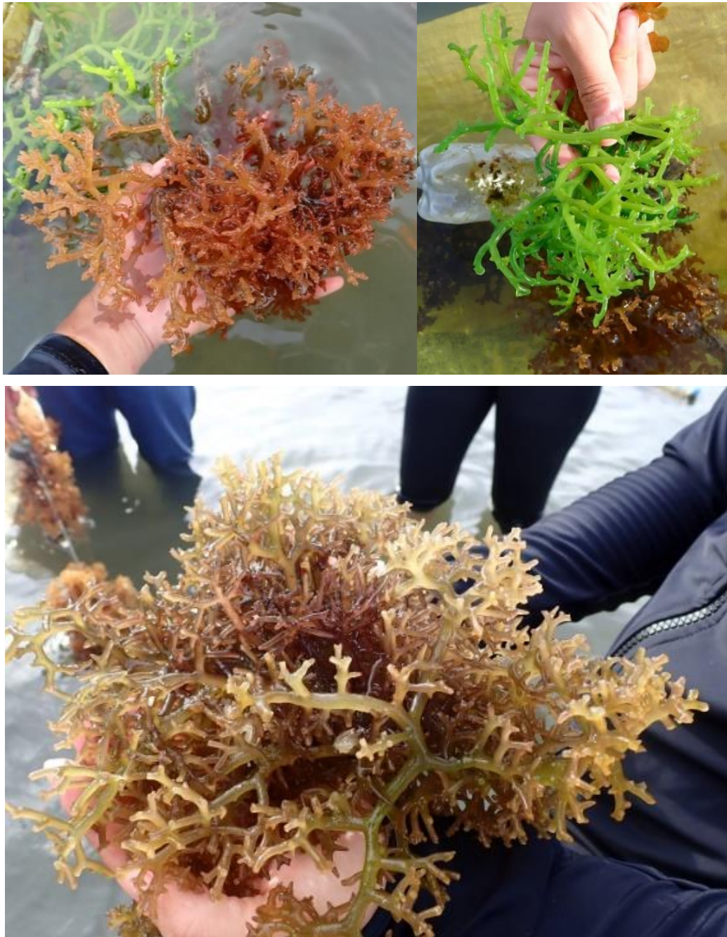
圖19 業者養殖之卡帕藻，鮮綠色者可用於沙拉。