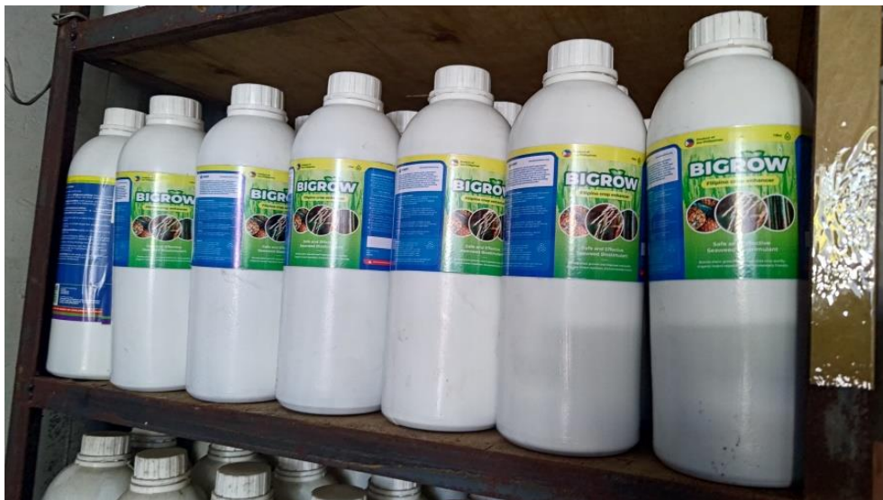
圖21 製作文宣並將瓶裝成品送農田及魚塘推廣使用。