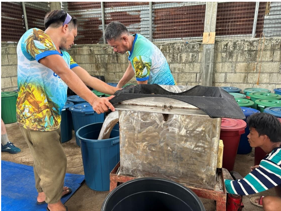
圖20 海藻打碎及榨汁加工作業。