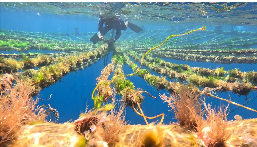
圖8 小圈藻類養殖網及設施，採收需浮潛作業