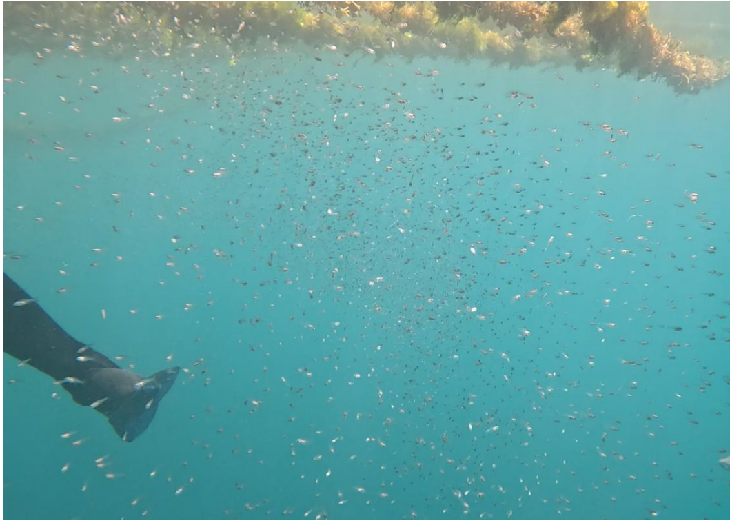
圖13 對照組下聚集之稚魚

初步觀察大圈生物相，藻場下方有多種雀鯛及附著性生物(圖13、14)，附近聚集許多單人釣船，直接在海上向其購買漁獲，數十尾主要為脂眼凹肩鰺及巴鰻(不吃海藻)，另有一隻條紋豆娘魚(吃海藻)(圖15)。以手抄網檢視聚集魚種，共採獲兩尾鰯科，稚魚僅聚集在對照組區域，整群皆為天竺鯛科，另有海跳蝦等生物(圖16)。大、小圈皆有成群之水針於海表。晚間也可發現漁船開燈在大、小圈附近作業。