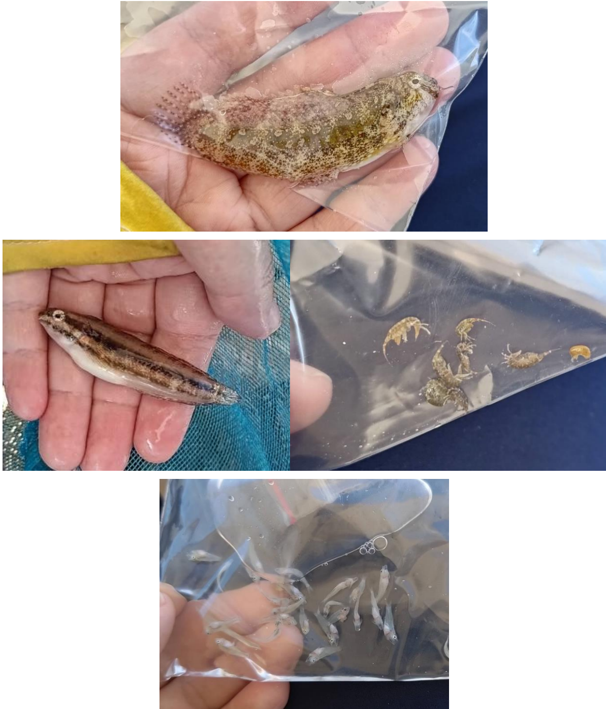
圖16 藻場聚集之生物，含鰯科魚類、天竺鯛科稚魚及海跳蝦。