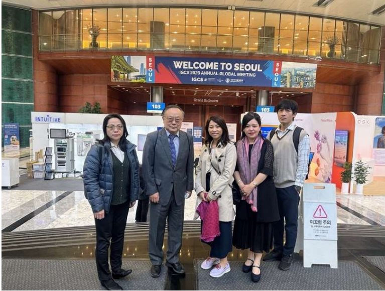
左圖為與會人員與會場