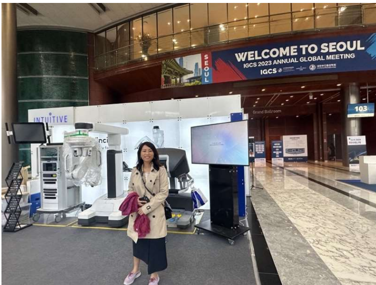
左圖為最新型達文西腹腔鏡儀器