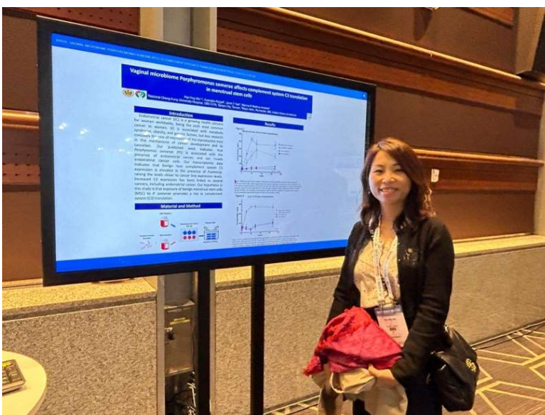
左圖為 ePoster 內容