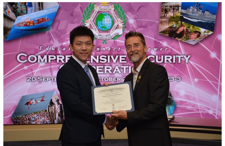
筆者獲頒結業證書