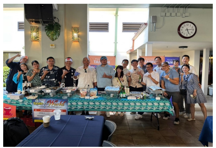
異國美食饗宴東北亞小組合影