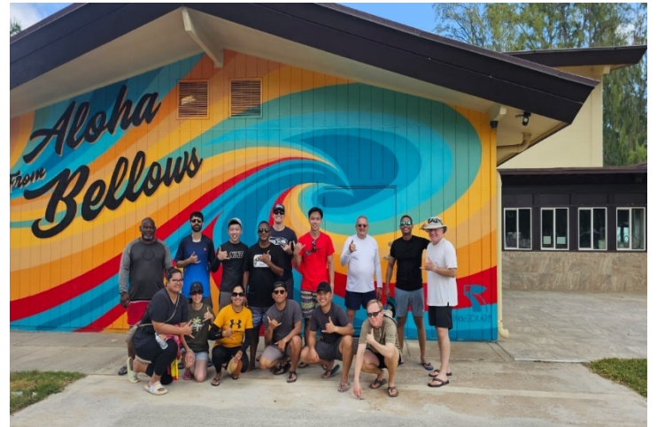
學員於貝洛斯海灘(Bellows Beach)合影