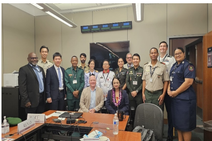
專題討論第 6 小組合影