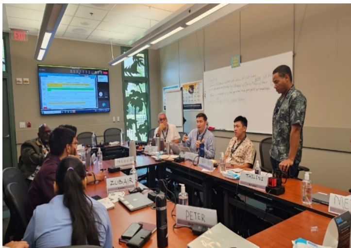
專題討論第 6 小組互動情形