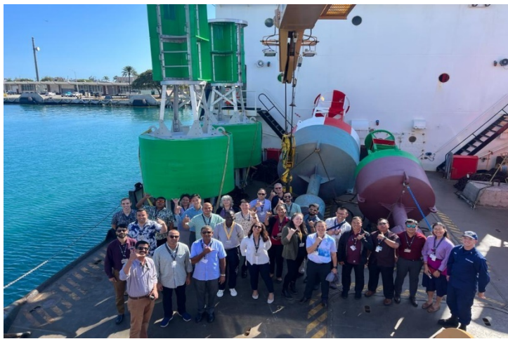
學員於美國海岸防衛隊檀香山分隊合影