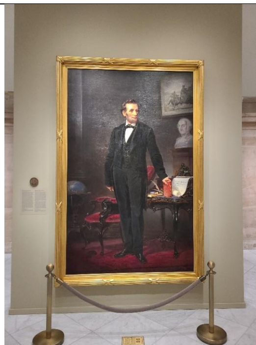
圖 3. 國家肖像畫廊展示林肯總統肖像畫