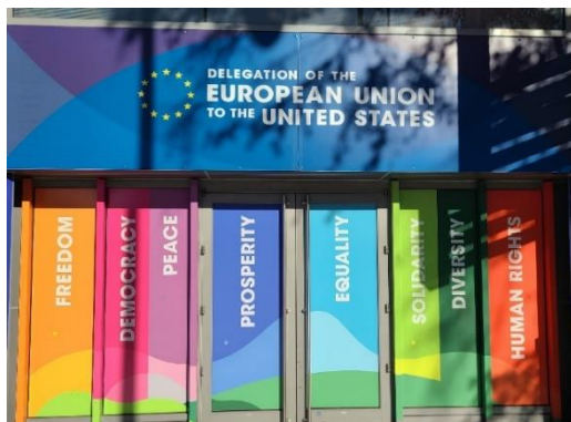
圖 1. 歐盟駐美代表團外牆

另特別感謝 CMI 除教室內課程與博物館參訪之外，亦安排前往許多機構實地上課，我們得以有機會進入歐盟駐美代表團、美國在臺協會華府總部、