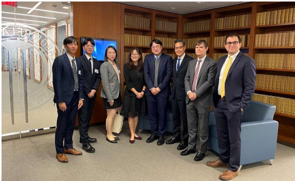
圖 4、與 NLRB 代表合影

在豐富的案例介紹後，我們可以發現 NLRB 在處理申訴或不公平勞動行為案件時，有相當嚴明的程序，總法律顧問的角色類似檢察官，會負責幫助原告整理事證及傳喚證人，可大幅減輕申訴者在於事證準備的壓力。後續透過行政法官的介入以及救濟命令之核發，更能確實保障勞工權益，並使勞雇關係儘速回復穩定。