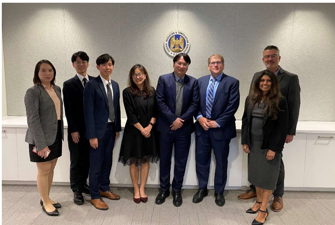
圖 5、與美國仲裁協會代表合影

AAA 作為一個非營利仲裁組織，持續依客戶需求提供多元仲裁服務。除一般仲裁程序外，AAA 針對勞資爭議仲裁另提供多種獨特機制供雙方自行選擇，分別為「加速仲裁程序」(Expedited Procedures of Labor Arbitration)、「快速解決程序」(AAA Labor Rapid Resolve Procedures)及「緊急仲裁程序」(AAA Emergency Scheduling Procedures for Labor Disputes)。三者均透過壓縮部分仲裁程序之期程達到快速解決爭議之目標。程序上，三者均較一般仲裁程序所需期程縮短相當多，惟三者間仍有快慢之分，其中「快速解決程序」(AAA Labor Rapid Resolve Procedures)是最快速的方式，勞資雙方需於提交仲裁申請時同時約定聽證日期，且要在 24 小時內自 AAA 提供之仲裁員名單中選定本案仲裁員，該程序最多可提交 3 案併審，但每案聽證時間不超過 45 分鐘，而仲裁員必須在聽證後 48 小時內作出仲裁判斷。