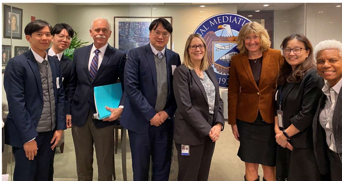
圖 3、與 NMB 主席 Deirdre Hamilton(右 4)等官員合影

有關鐵路及航空業之團體協約協商與其他產業不同之處在於，因鐵路及航空業之大多團體協約不會設定期限，僅會約定一定期間雙方可重新協商，協商期間原約款仍持續有效直至被新約取代，不過據 NMB 分享，平均協商期間約兩年，協商期間也較一般產業久；另外在鐵路及航空業仲裁程序之差異部分，NMB 也分享，通常航空業仲裁案件多為工時、工資或職安類型爭議，且會因雙方較要求較完整之聽證及證人程序，耗時較長；但鐵路業因為雙方對於程序已有較大之共識，通常不須聽證，且常併案處理，因此程序較快速。