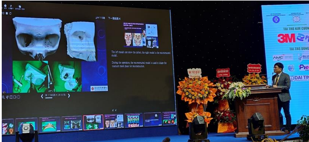
圖十二 重建整形外科王天祥主任受邀演講電腦 3D 列印輔助顏面骨重建的治療經驗。