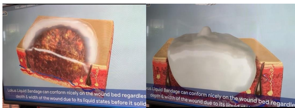
圖十五 會場內所見之新型敷料

會場內設置的攤位推廣展覽區，也讓我了解國外與目前國內在燒傷治療上，過去及現今使用的生物性敷料有何不同？每個攤位都非常有自己的獨特的特色，其中吸引我的目光的是一個發泡式的泡棉型敷料，心理莫名的興奮，鼓起勇氣向前，用「不擅長」的語言能力與廠商交談，學習著新型的敷料之適應症，廠商聽到來自臺灣的護理人員用著熟悉的福建語言交談，備感親切。這類型敷料是一種液態聚氨酯泡棉敷料，用於覆蓋各種形狀、大小的傷口，可顯著增強治療各種慢性傷口及燒傷傷口、慢行潰瘍。有別於過去的敷料，更能維持傷口的溼度、提供最佳的傷口透氣性，亦能防止細菌滲透達到預防感染。此次的交流，除了讓世界看到臺北榮總在八仙塵爆燒燙傷照護經驗，更肯定了我們燒傷照護，是具有世界水準的，感謝單位有讓我機會參與這樣大型會議，並從各位先知身上獲得許多寶貴的智慧。以下分享新型敷料(圖十五)：