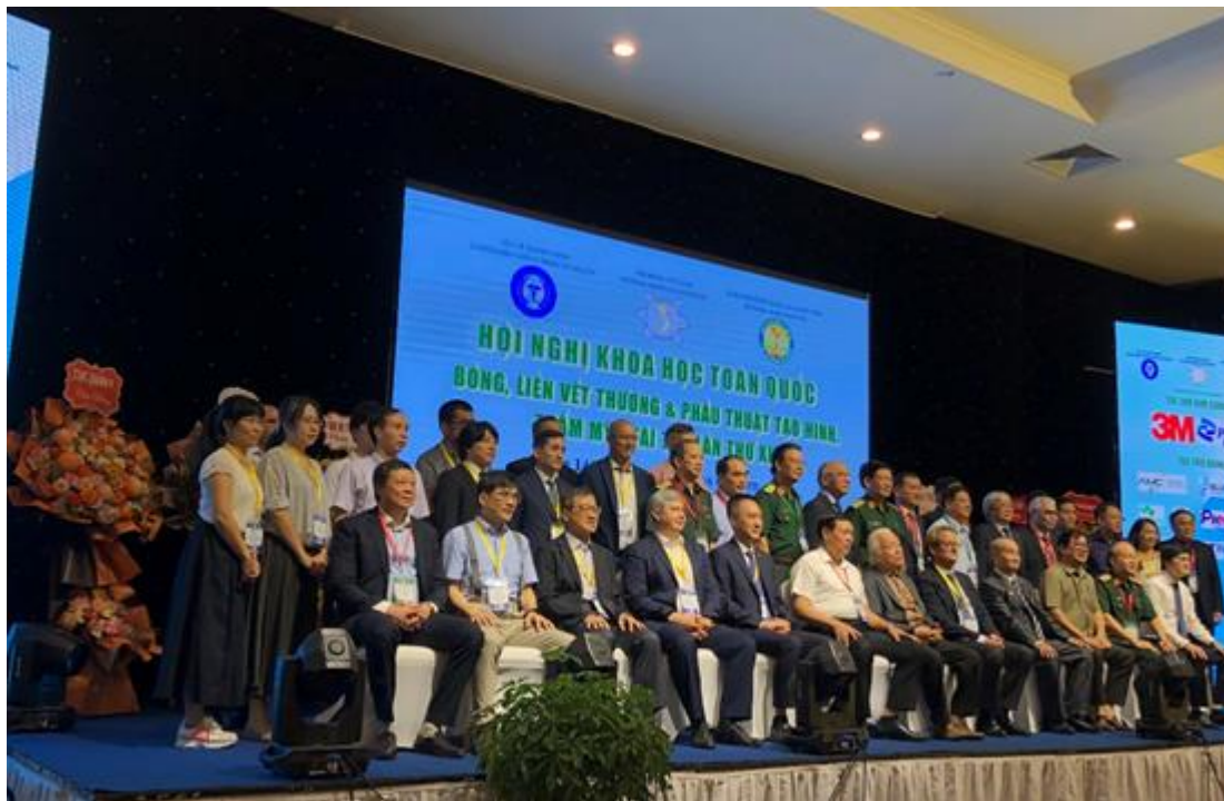
圖二 2023.10.06 越南燒傷學會主辦單位和臺灣參訪團及各國學者合影。