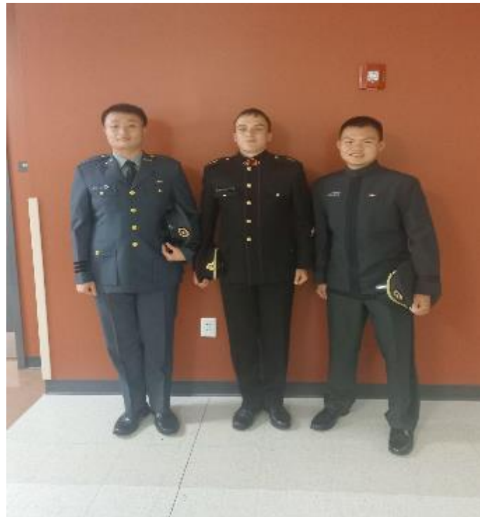
與國際友人合照（左為美國友人，右為立陶宛友人）