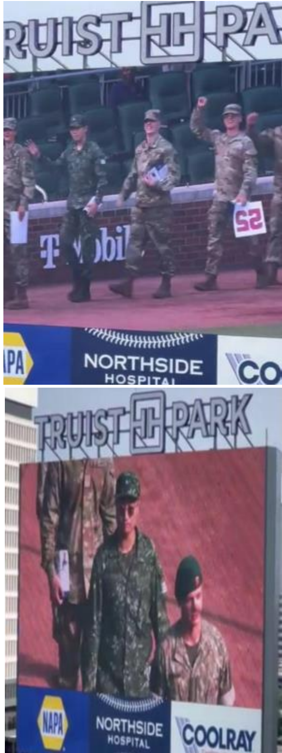
與北喬治亞大學學生一同參與美國職棒比賽