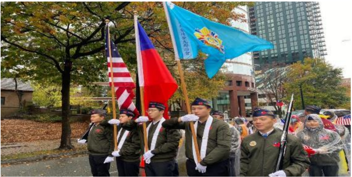
與亞特蘭大榮光會一同參與美國退伍軍人節遊行