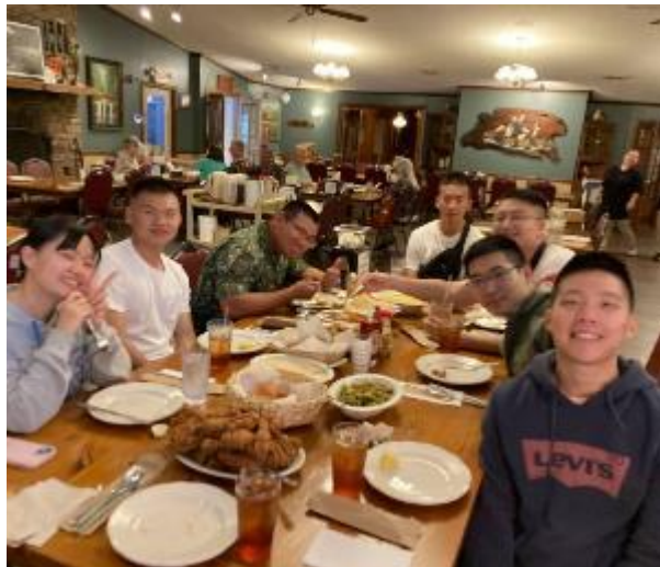
與北喬治亞大學中文系老師及長期生聚餐