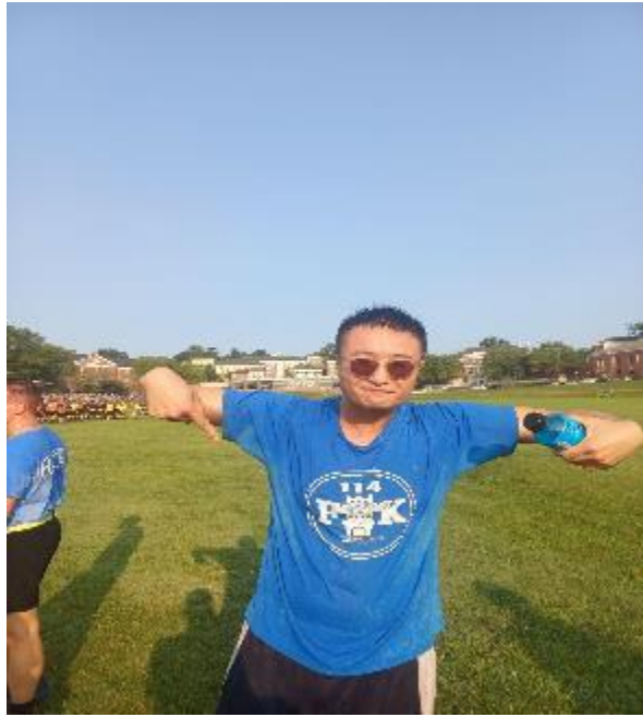
Frog Week 結訓典禮