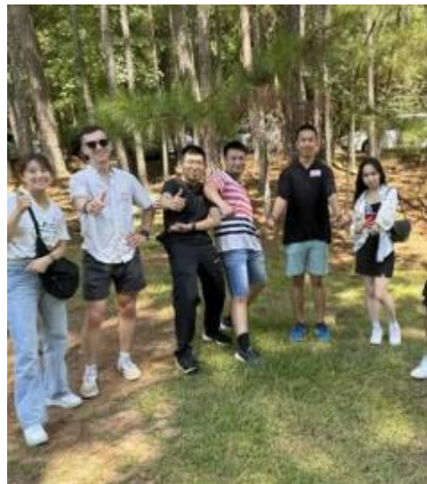
參與亞特蘭大臺灣協會中秋烤肉活動