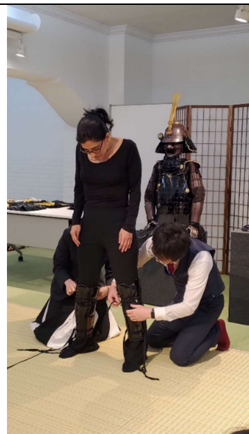
示範甲冑穿戴方式