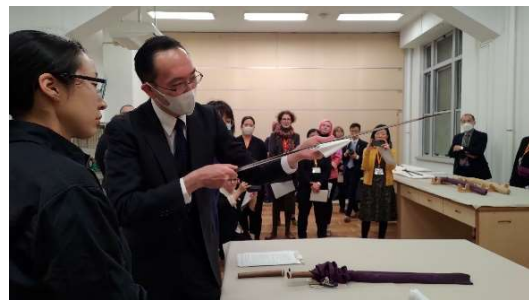
向學員示範日本刀的持拿