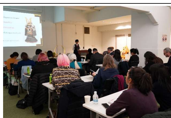
講師解說日本甲冑的各部位