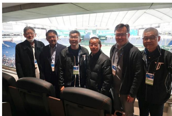
謝長廷大使觀看中澳大戰