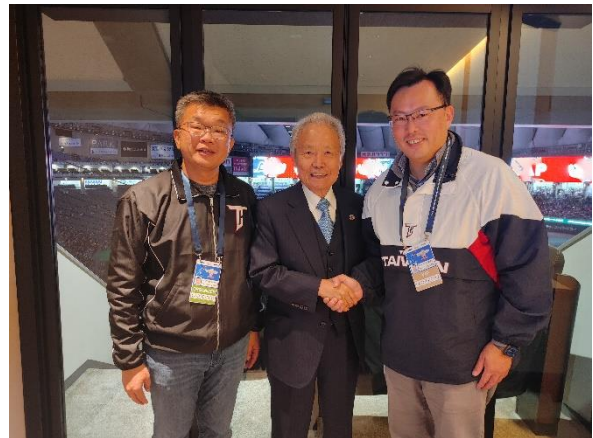
鄭世忠署長、蔡其昌會長與日本職棒聯盟會長榊原定征先生致意合影