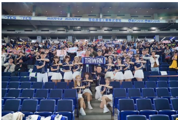
與中日大戰觀賽球迷合影