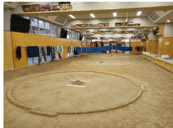
參訪日本體育大學場地