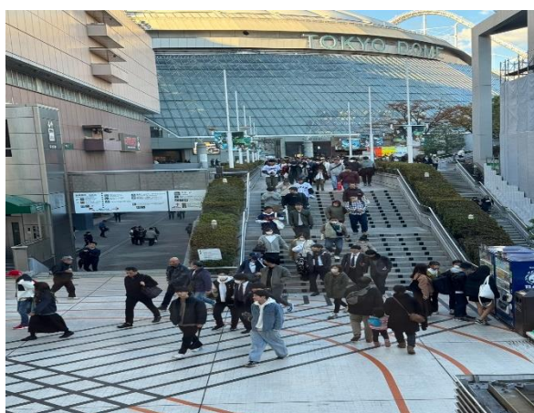
東京巨蛋外部動線及週邊