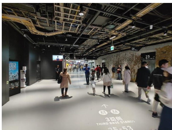
參訪東京巨蛋內部動線