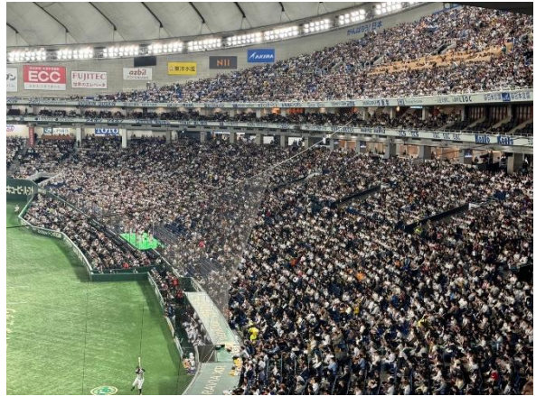
鳥瞰東京巨蛋球場內部