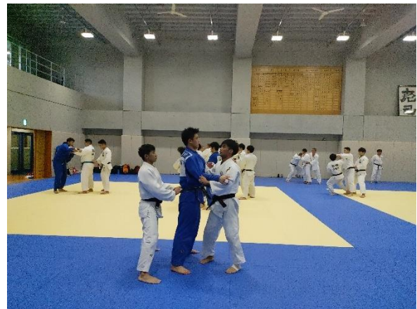
鄭世忠署長探訪柔道好手楊勇緯選手，關心移地訓練情形