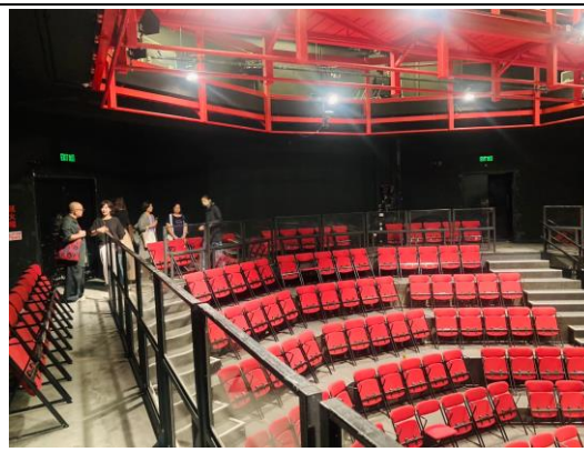
香港演藝學院小劇場