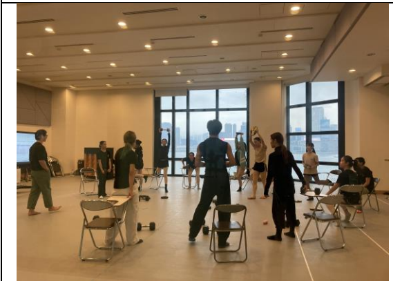
香港演藝學院排練室