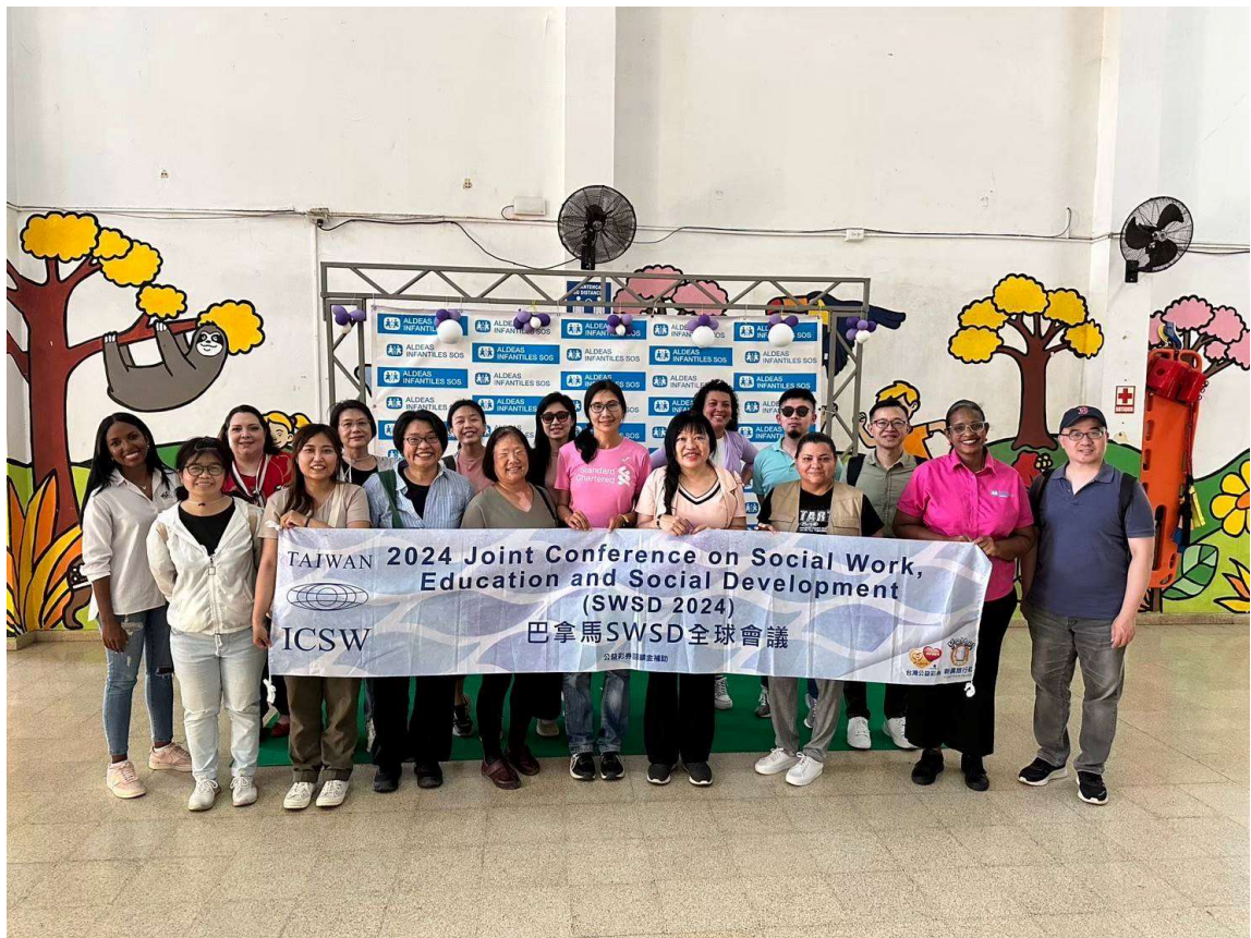
圖6：台灣代表團參訪 SOS 兒童村，與工作人員合影。