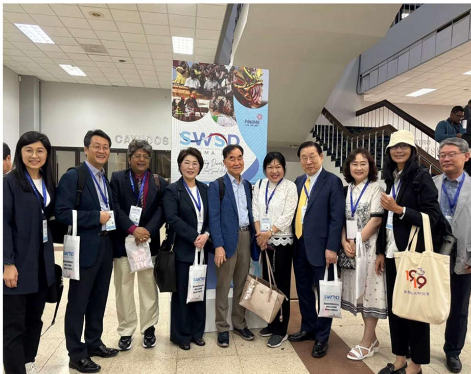
圖4：台灣、韓國代表團團員相見歡合影。

本場會議除了主題演講和論文發表外，同時還有海報展示的攤位、彰顯了促進包容性和相互學習的精神。在會議外場之攤位上，我們也發現了一個心理健康APP開發團隊，利用AI技術開發了一款互動的APP：Resilient Moment，透過題目的引導以及AI技術支援，讓使用者透過此應用程式能更好地管理情緒和心理狀態，保持穩健的心理狀態；同時該應用程式使用由醫療專業人員開發的認知行為療法(CBT)技術，並通過人工智能動態地創建個性化的視聽體驗，甚至有支援多國語言功能，雖然目前仍然在PILOT(測試版)狀態，但獲知也有團隊在用創新手段為促進心理健康努力，評估仍有進一步合作之可能。