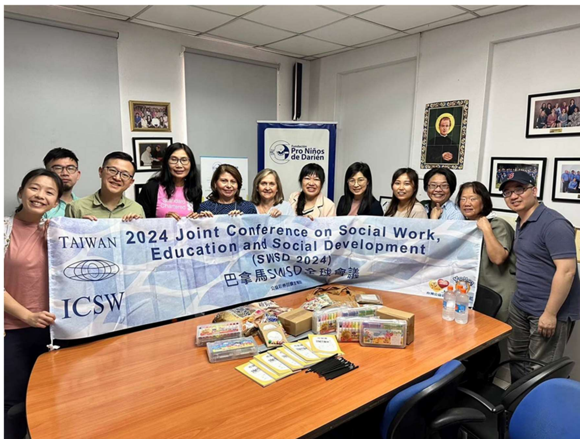
圖5：台灣代表團在達里恩兒童基金會的參訪與交流。

Pro Niños de Darien 是一個成立於1990年、有天主教背景的 NGO，組織認為透過營養、健康、教育、生產和社區發展計畫相關活動，減少兒童營養不良。主要工作區域在 Emberá-Wounaan 地區和 Darién 省，目前為92個社區的約6,268名兒童提供服務，其中48%是當地原住民，其餘52%是定居者和生活在極端貧困中的非洲裔達里安人。推動營養計畫，確保109個學校食堂和43個學前食堂的9000名兒童每日早餐和午餐，相當於學年內總共有4,320,000份餐食。基金會致力於改善達里恩地區兒童的生活條件，服務至今服務超過15萬人，主要服務包括：(一)教育支援、兒童營隊、農業與建築技巧(二)食物援助、營養及健康 (三)生活用品支援、淨水。支持97所學校之學童及學前班，其物資之提供食品占79%，口腔健康用品13%，學校用品3%，玩具2%，另行政費用及交通各2%、1%。