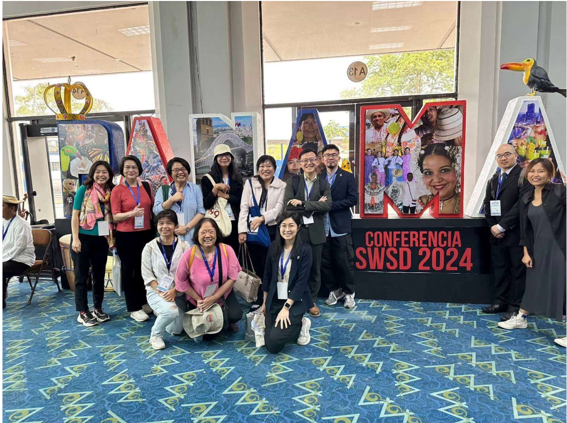
圖8：台灣代表團全程參與四天的全球會議至最後一刻，依依不捨留下最後合照。