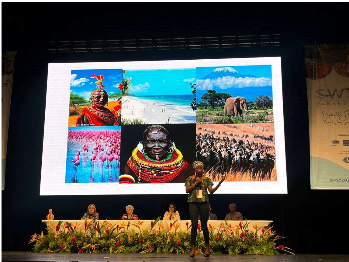
圖10：2026年 SWSW 全球會議在肯亞影片在閉幕式放映，並提出下次會議邀請。