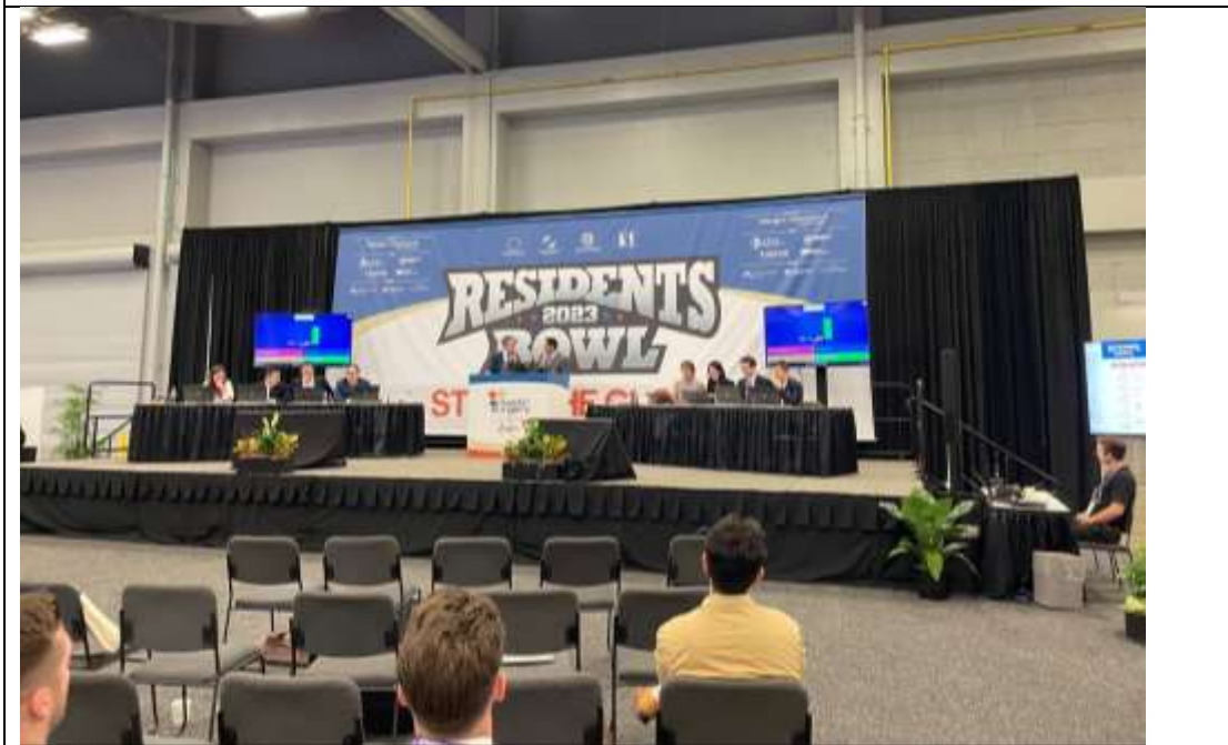
住院醫師交流競賽 Resident Bowl 之決賽與冠軍賽，最終由俄亥俄州立大學擊敗史丹佛大學奪下二連霸。