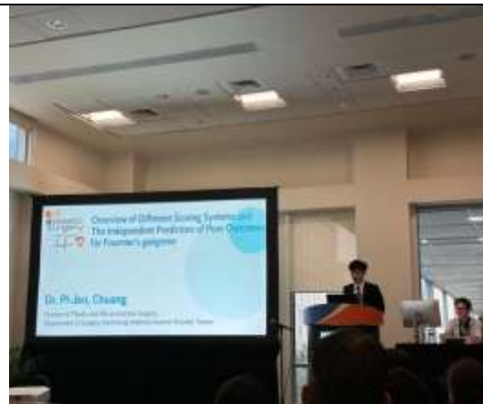
莊筆任醫師進行 podium presentation