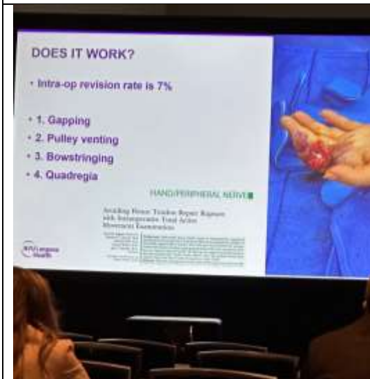
清醒麻醉手外科 (Wide-awake Local Anesthesia No Tourniquet)