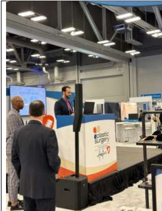
Plastic and Reconstructive Surgery 期刊 年度最佳論文頒獎