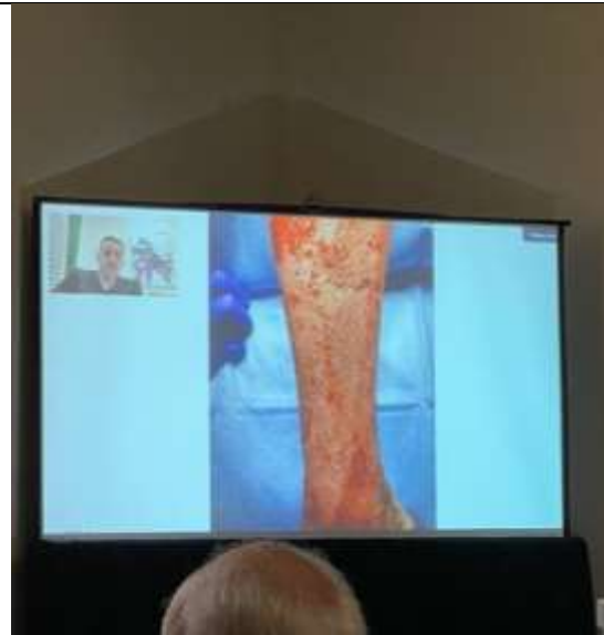
脫細胞魚皮移植在燒燙傷及皮膚癌 的重建應用