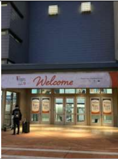
第一天抵達會場天色已暗