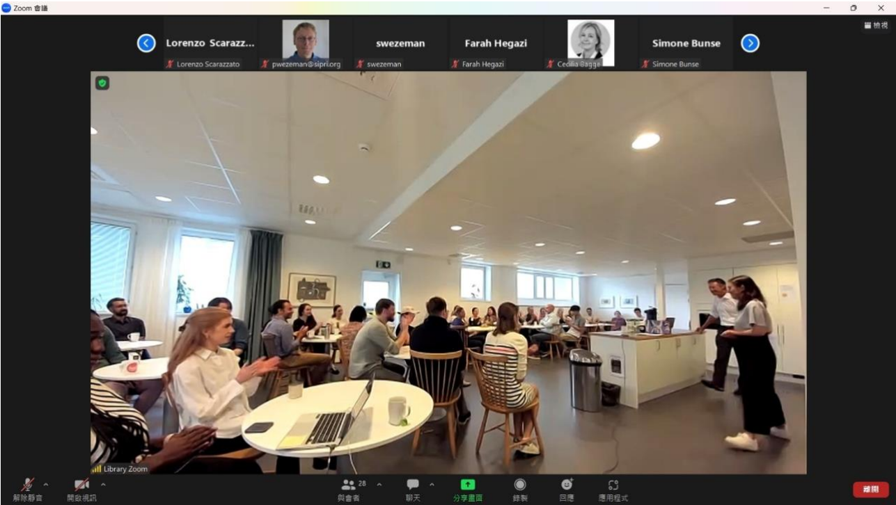
圖 7 2023 年 8 月份 SIPRI 全體會議(線上及線下)