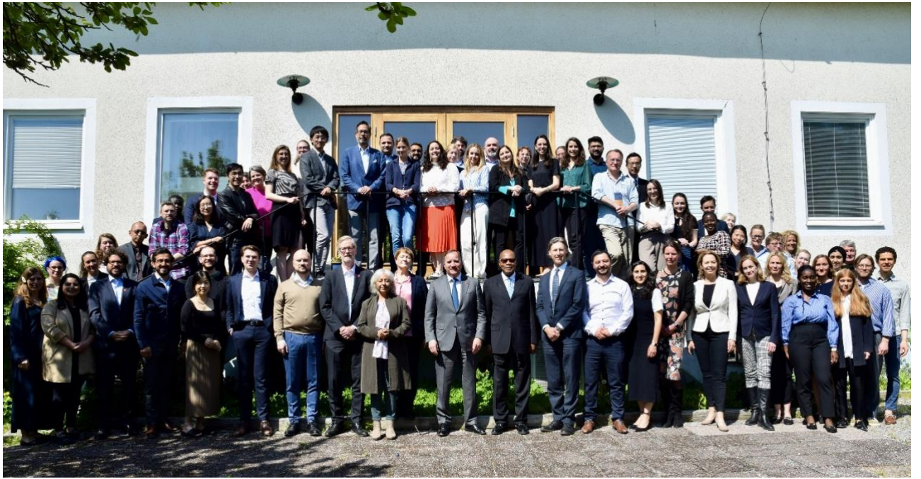
圖 3、筆者與 SIPRI 董事會成員、研究同仁之年度合影