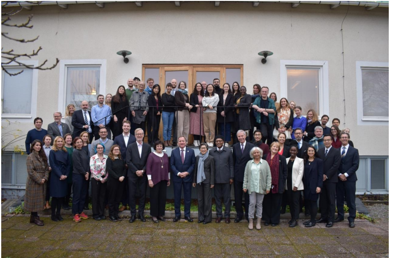
圖 2、筆者與 SIPRI 董事會成員、研究同仁之年度合影