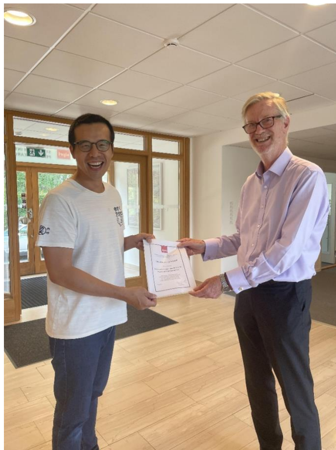
圖 9 SIPRI 院長頒發結訓證書