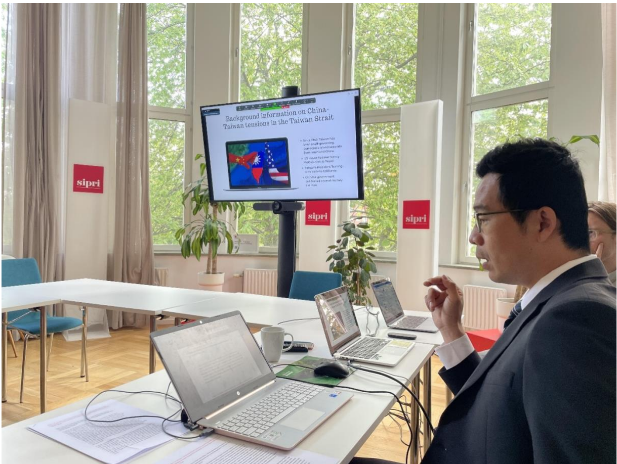
圖 4 筆者於斯德哥爾摩和平研究院實施論文發表