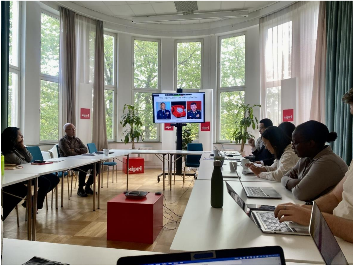
圖 5 筆者於斯德哥爾摩和平研究院實施論文發表