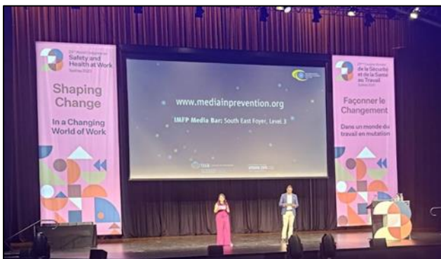
圖 10 職安衛影片競賽頒獎典禮

11 月 28 日晚上 6：30~7：30 大會於 Darling Harbour Theatre 達令港劇院舉辦 International Media Festival for Prevention 職安衛影片競賽頒獎典禮(如圖 10)。