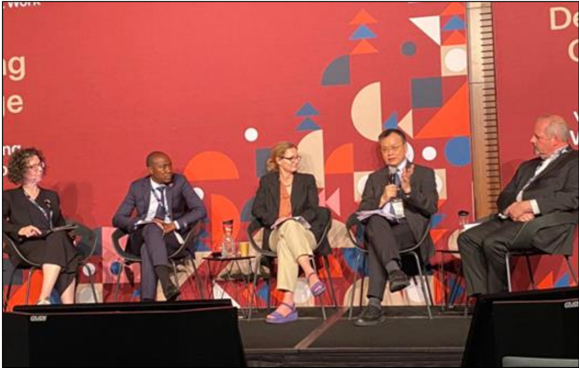
圖 7 鄒署長(右 2)分享我國對平台外送員之保障及作法

參加這難得的盛會，台灣有產官研貢獻實質績效與成果，外掛老師們研究發表加持，由署長親自領軍展現台灣的積極務實作法，創造了絕佳的團隊形象和展現實力，提供台灣 OSH 能見度，我們也不再單打獨鬥，相信下一屆會有更精彩的國際演出。