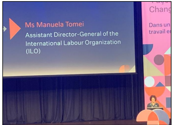
圖 4 國際勞工組織助理總幹事