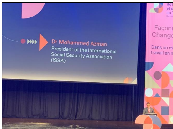
圖 5 國際社會保障協會總裁