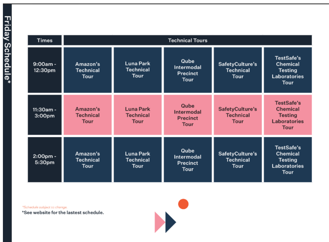
表 8 Day 5 (Friday, 1 Dec 2023) :