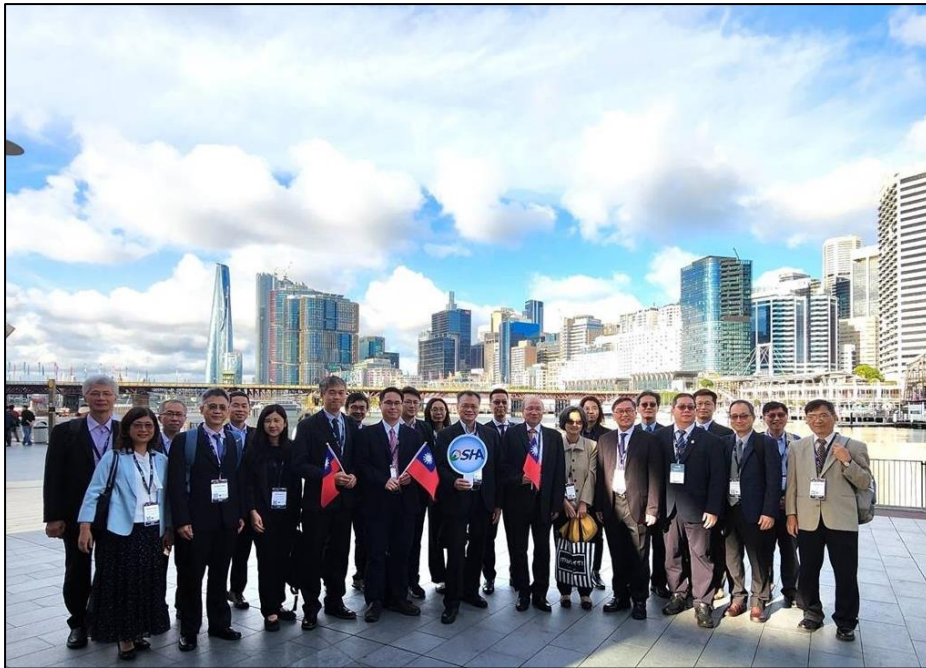
圖 1、職安署鄒子廉署長(左 6)與臺灣代表團合影