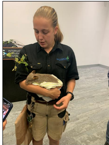
圖 9 袋鼠寶寶

11 月 28 日晚上 6：30~7：30 大會於 Darling Harbour Theatre 達令港劇院舉辦 International Media Festival for Prevention 職安衛影片競賽頒獎典禮(如圖 10)。