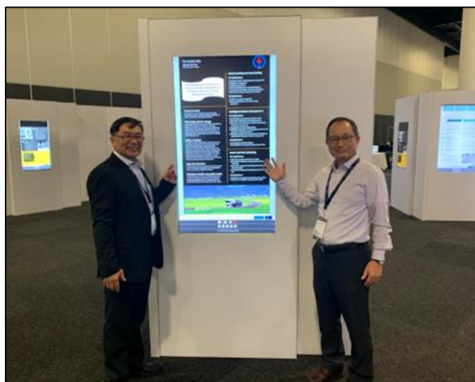
圖 11 中油公司發表之海報論文

本公司於大會之海報展覽論文題目為罐車風險管理－安全技術應用電子物聯網管理系統：透過“災害識別和風險評估流程”，識別出輪胎爆胎是風險最高的項目，因此應用油罐車電子物聯網管理系統與高階駕駛輔助系統下的輪胎壓力和輪胎溫度監測系統的安全技術(TPTMS)相結合，將行駛中的油罐車輪胎狀況即時回傳至監測系統即時監控，有助於預防、避免和控制因行駛中輪胎爆胎有關的油罐車事故。