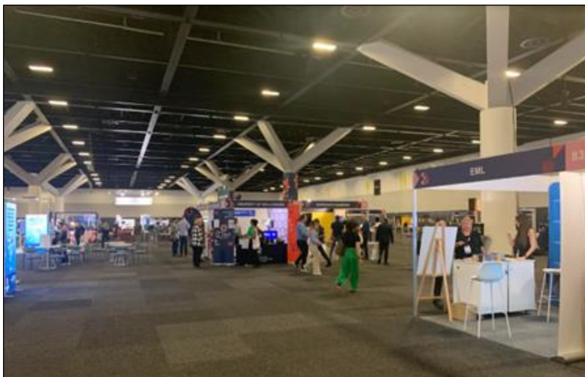
圖 12 國際安全與衛生展覽會場

大會在雪梨會議展覽中心地下一樓提供一個大型商展場空間，供各類職業安全衛生展示廠商商展，本次共有 48 家安全衛生器材、產品、技術及雜誌期刊等相關廠商參展(如圖 12)。該展覽展示廠商各種工作場所安全與衛生最新器材技術、產品及安全與衛生的趨勢發展諮詢，與會者可參觀供應商展覽商品和實際應用在工作場域之相關技術，藉由多項先進的職業安全衛生相關展覽，可算是獲得技術交流之機會。