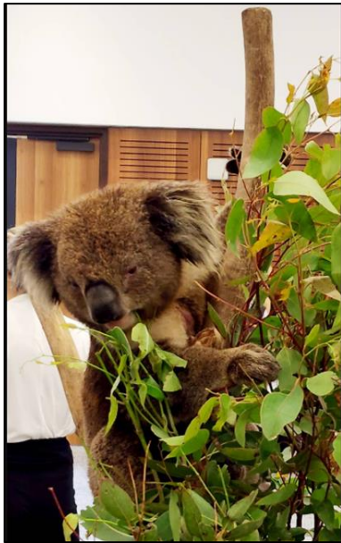
圖 8 無尾熊

研討會期間 11/28~11/30 連續三天，大會也特別安排與會者與澳洲的野生動物無尾熊(如圖 8)和袋鼠寶寶(如圖 9)近距離接觸合照，並向野生動物專家了解澳洲的保育工作。