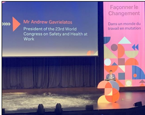
圖 3 澳洲工作安全局長暨大會主席