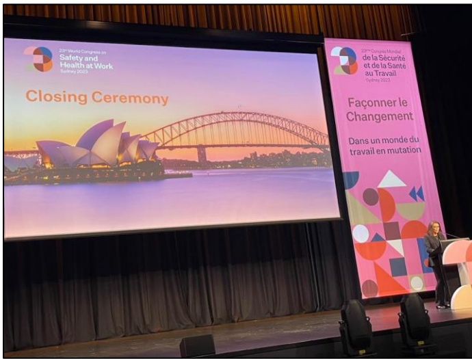
圖 13 閉幕式會場

閉幕式於 2023 年 11 月 30 日下午 4 點 45 分舉行(圖 13)，由主辦方彙整本次的關鍵重點與學習成果，並宣布海報論文展覽的優勝者，但尚未宣布下次 2026 年第 24 屆世界大會的日期與主辦國，本屆在與會者互道珍重再見後圓滿完成。