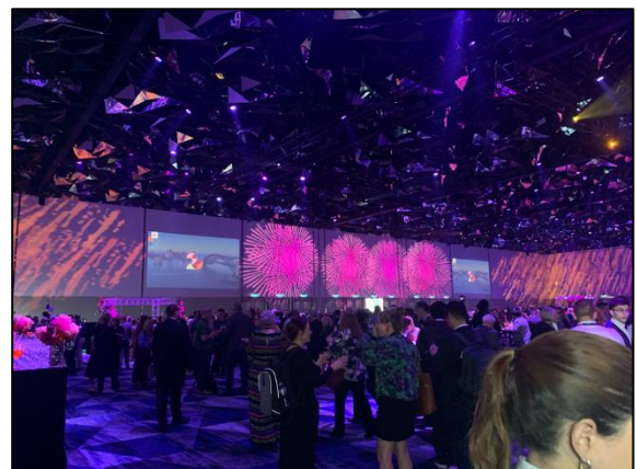
圖 6 歡迎招待會(迎賓晚宴)