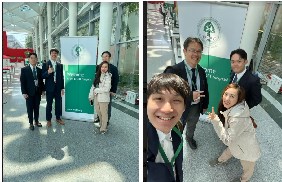
本科此次參與 EFORT 成員

進行發表，而對岸僅有一名參加)！第一天個人先與本科出席代表會面，接著再去展場逡巡，看看有無新推出的醫材或技術設備可供更新、學習；稍後再去海報區流覽，並對感興趣題目及相關內容鉅細靡遺地看了一次，並藉機與作者們討論溝通心中的疑問！會場除了各固定展廳的演講外，除了以學者為講者的主題演講，廠商區中央也安排了一個名為 Marketplace 的小講堂。雖然名字聽起來像是在做拍賣，但是實際用途是在主題演講之間的空檔安排一些題目比較廣泛但又十分受用的短講，令人印象深刻。