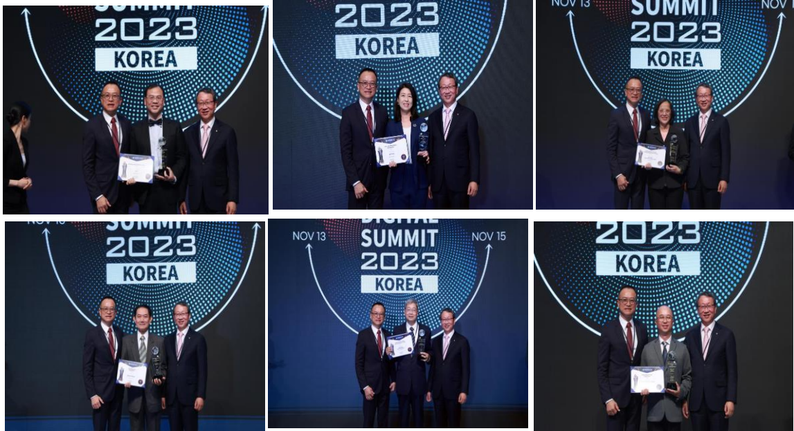
照片 3：2023 年亞太資訊服務業數位高峰會參訪團與得獎單位合影