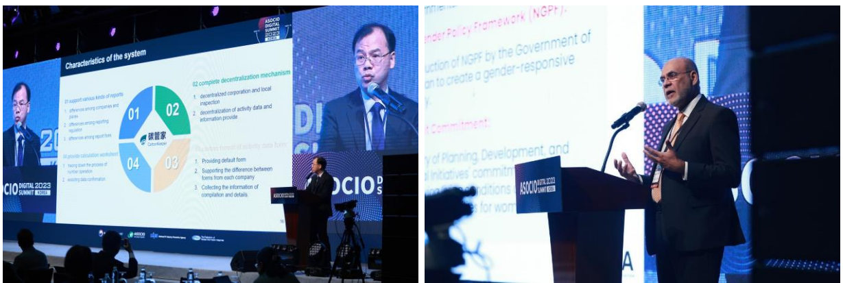
照片 4：臺灣與各國得獎單位代表展示數位解決方案與應用案例

技術，能在幾秒內解讀百萬本書籍、數千萬則社群訊息、數億則物聯網資訊，從中歸納模式、察覺關聯性，進而創造價值。此外，IBM Watson還能反覆學習與修正，使得結果越來越精準，IBM Watson已在人力資源、科技自動化、資訊安全、永續發展及現代應用領域累積成功案例，另一面，呼籲政府監管AI可能帶來的風險，並加以管理AI之創造者和應用者。