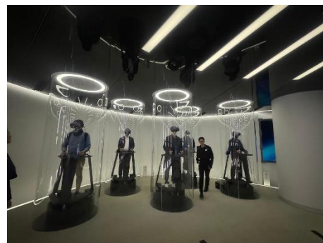
照片 2：參訪 SK 電信新 ICT 體驗館 T.um