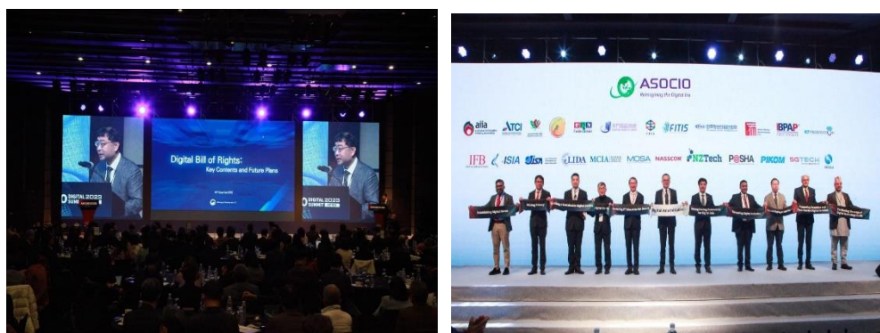
照片 1：ASOCIO 2023 Digital Summit 大會開幕式