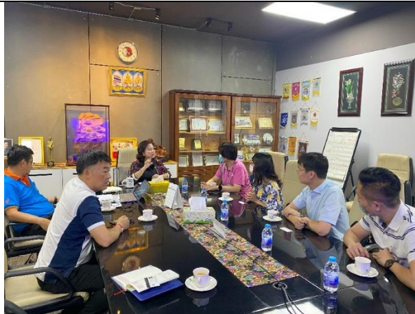
與泰國-台灣(BDI)科技學院校方討論演出內容