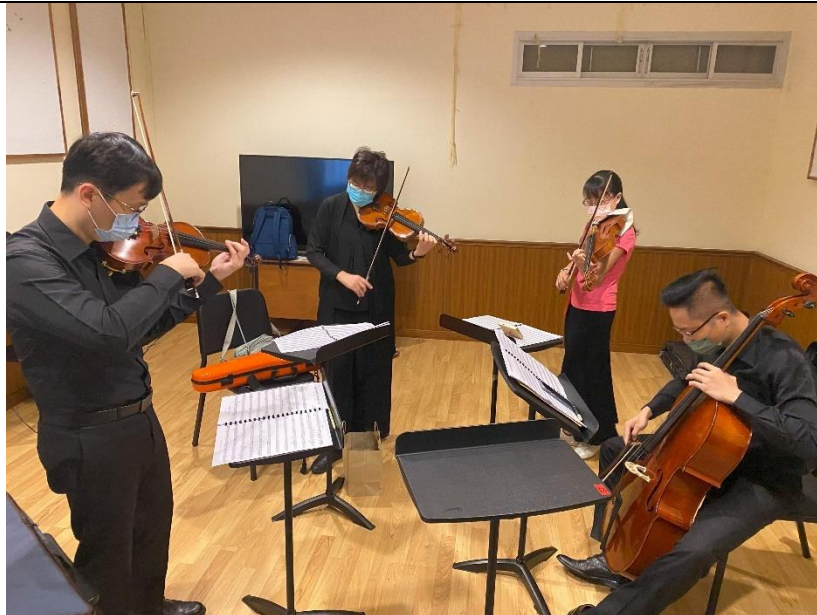
樂團老師於排練室調音