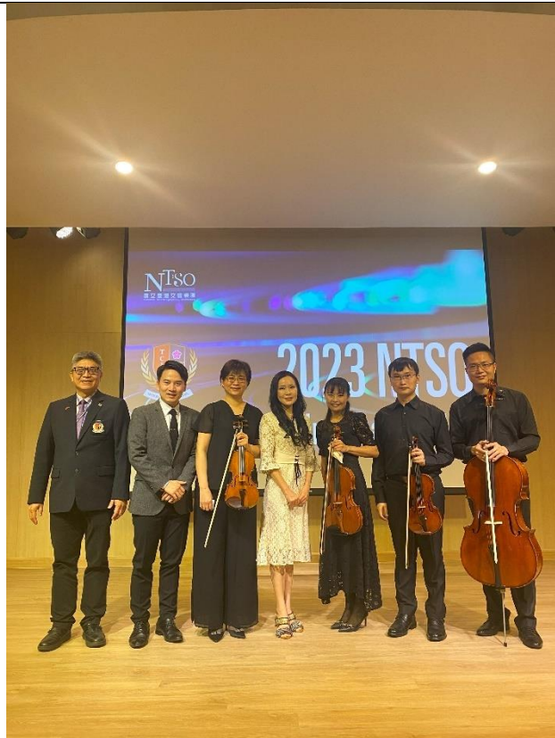
演出順利成功樂團與校方及董事會代表合照