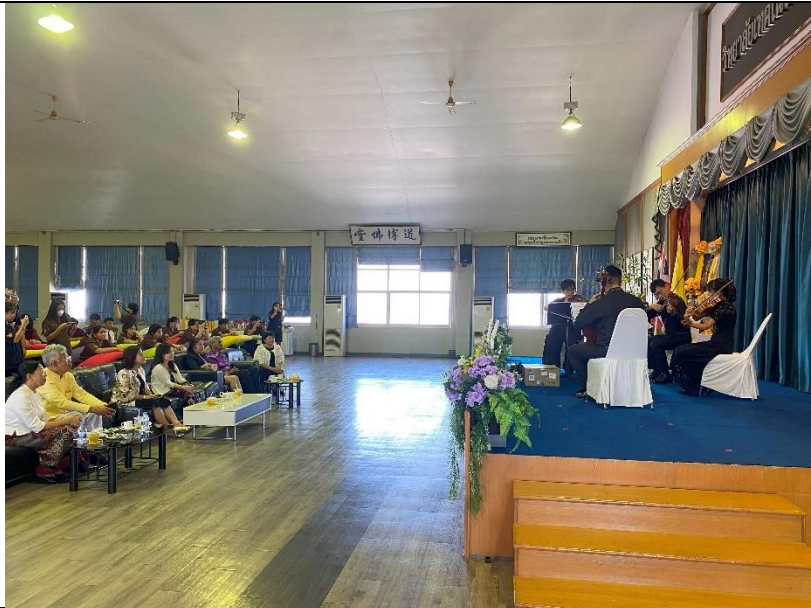
樂團老師舞台精彩演出, 貴賓認真聆聽