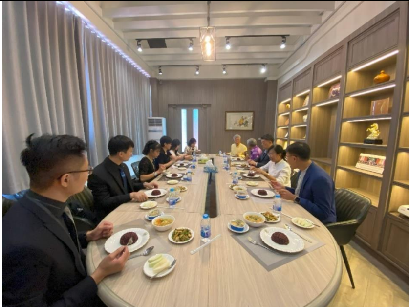
赴泰國-台灣(BDI)科技學院張董事長邀請午餐會議