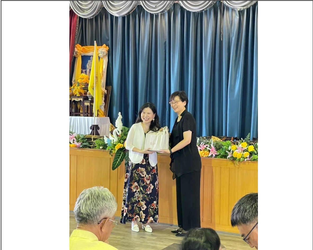
樂團首席致贈文化部田組長紀念品