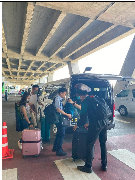
駐泰文化組張秘書協助接機事宜