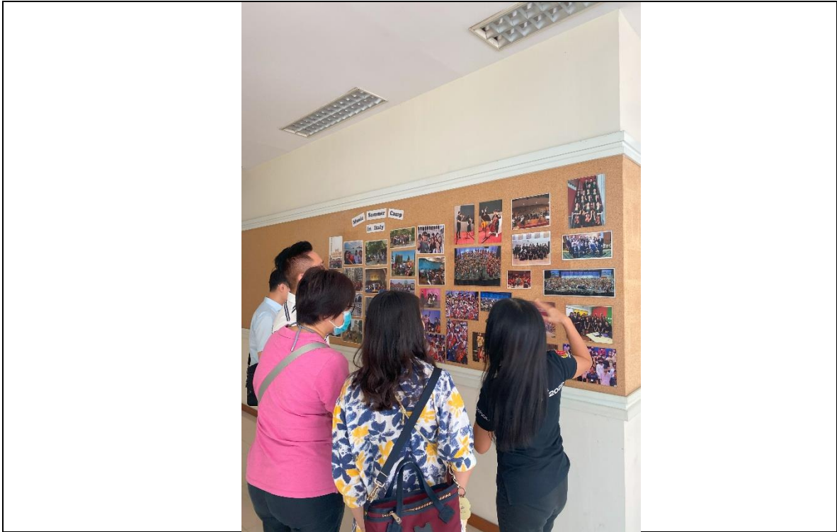
僑校老師介紹音樂部門活動