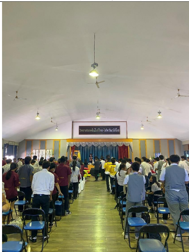
演出成功圓滿獲得滿堂彩