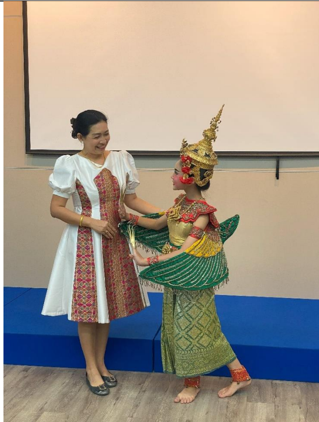
泰國傳統舞蹈家於後台與大家互動