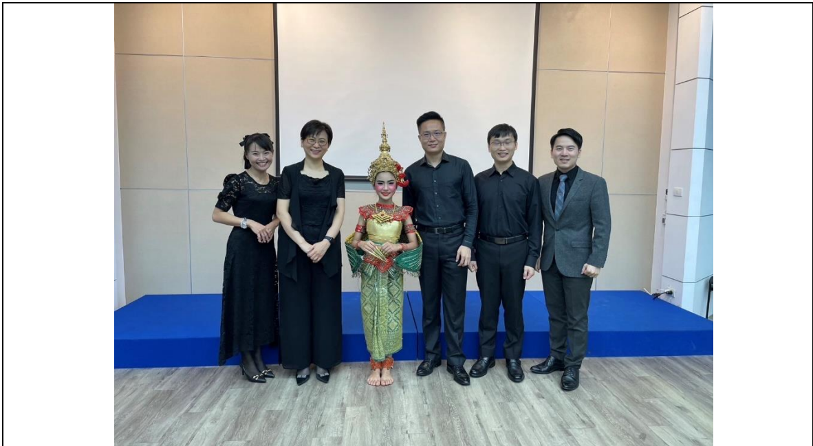
北纜府地區泰國傳統舞蹈優勝於弦樂四重奏演出結束後合影