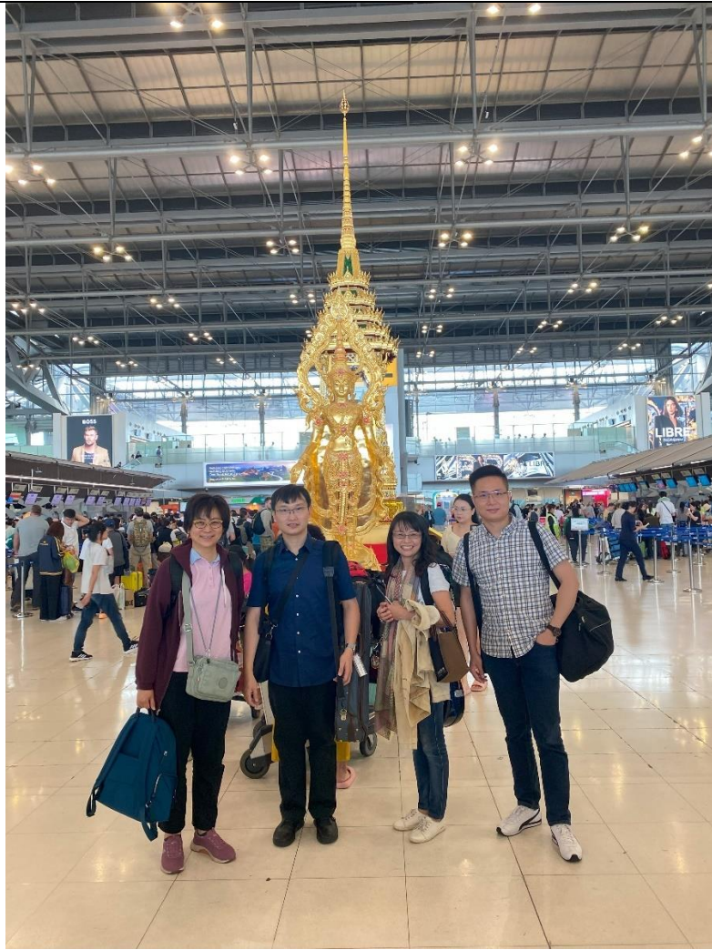
國立臺灣交響樂團弦樂四重奏訪泰圓滿順利返國於曼谷機場留影