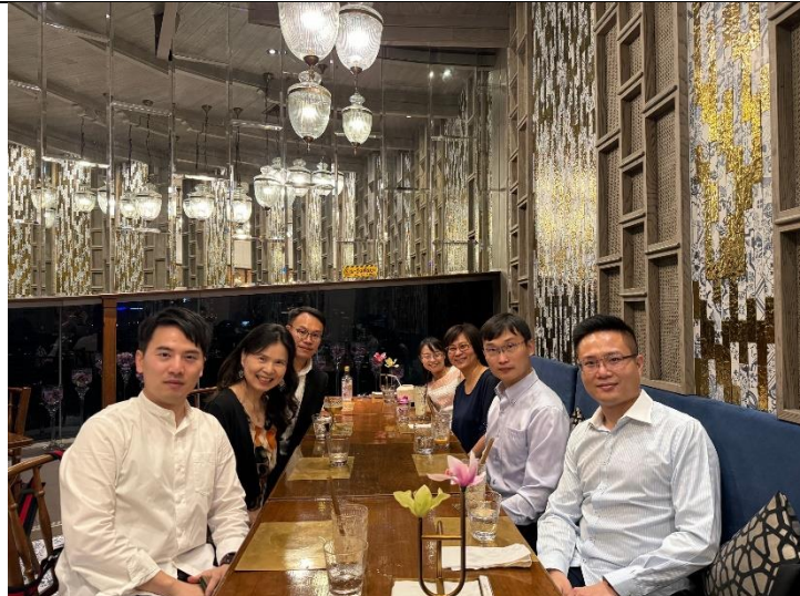
赴文化部駐泰文化組田組長及張秘書邀請晚餐會議