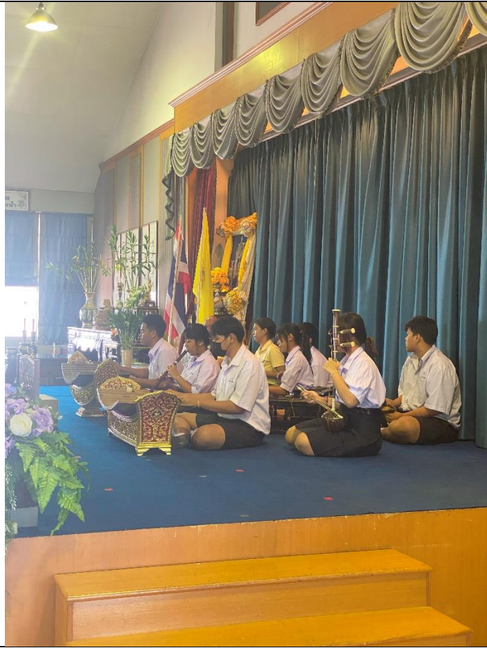
泰國傳統民族音樂演出邀請樂團欣賞