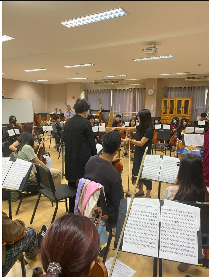
僑校老師介紹本團演出人員