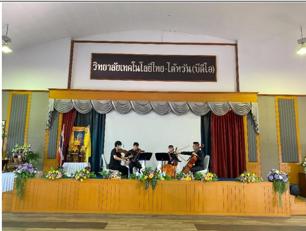
泰國-台灣(BDI)科技學院禮堂彩排