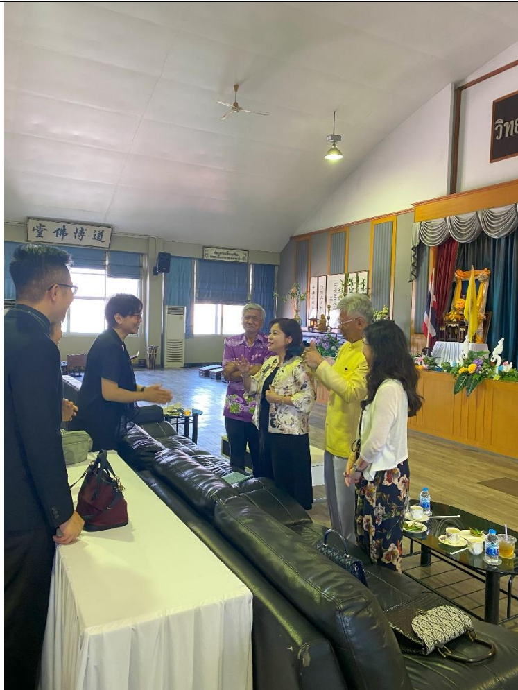
貴賓們向樂團表達感謝之意