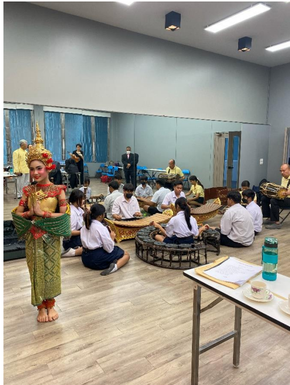
泰國傳統民族樂團於後台試音