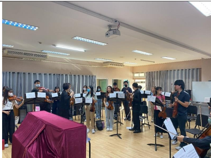
本團老師與該校弦樂團排練