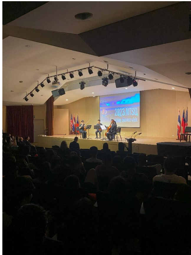
泰國中華國際學校演出劇照