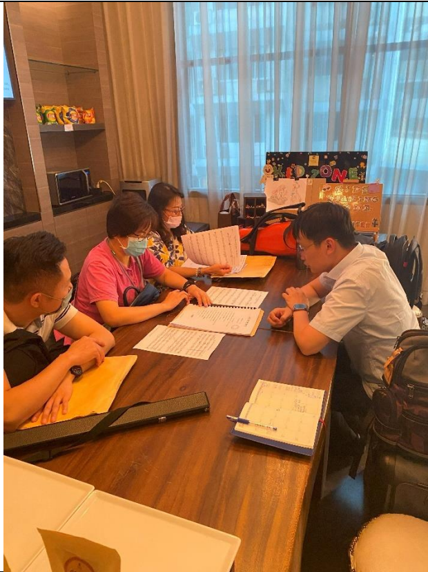
因應校方提供之當地文化及特色樂團老師開會討論並調整曲目