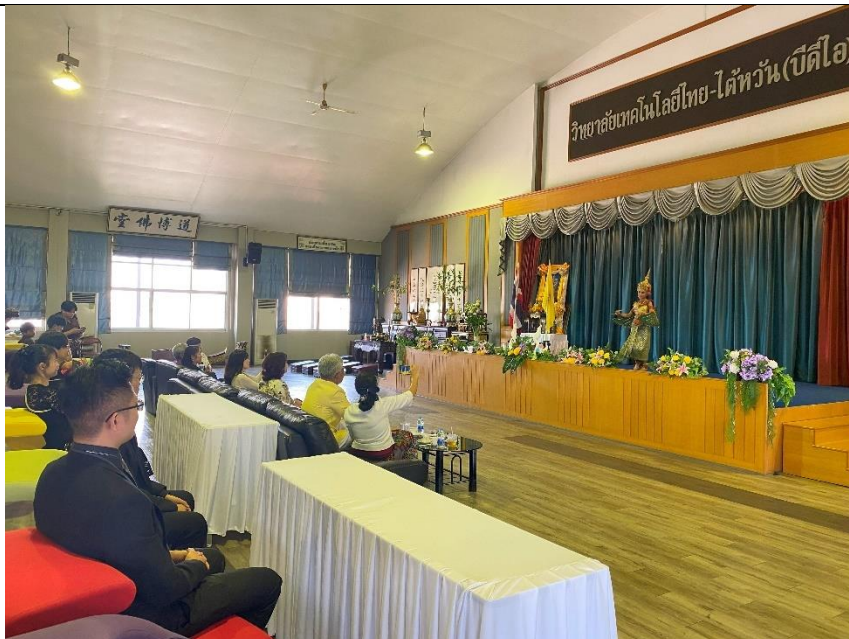
泰國傳統舞蹈演出邀請樂團欣賞