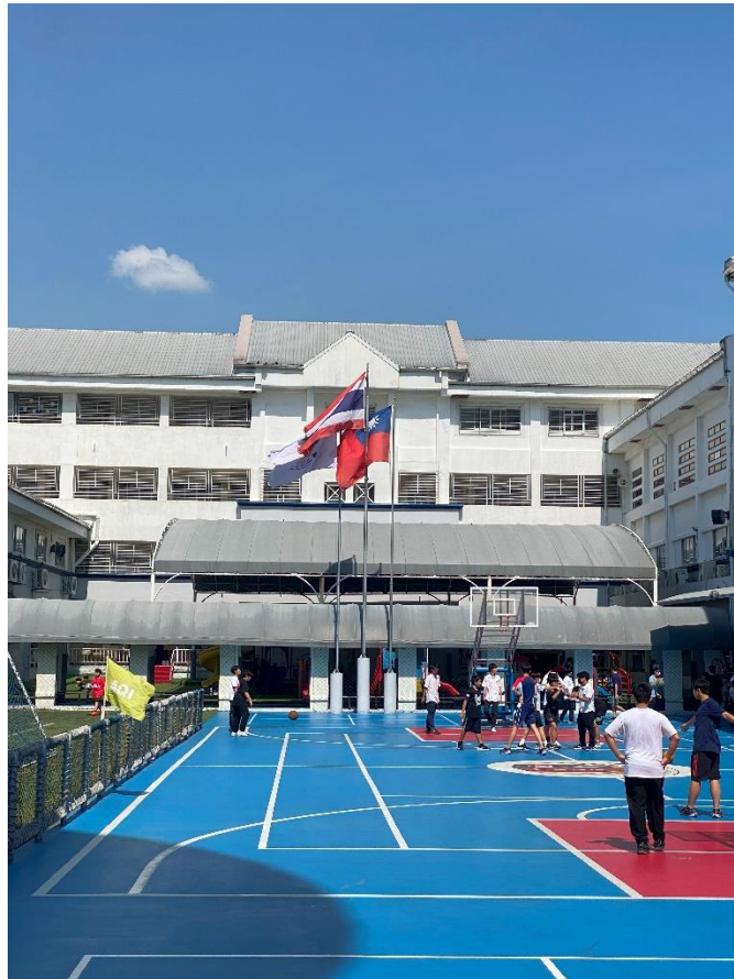
我國國旗飄揚於泰國中華國際學校操場