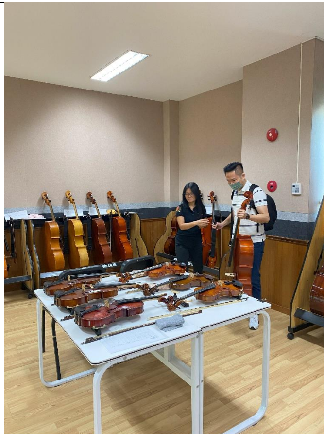
泰國中華國際學校辦理選琴事宜