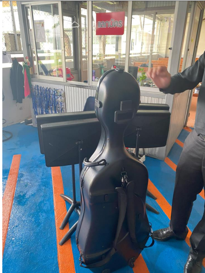
僑校服務計畫演出完成後歸還借用大提琴與譜架