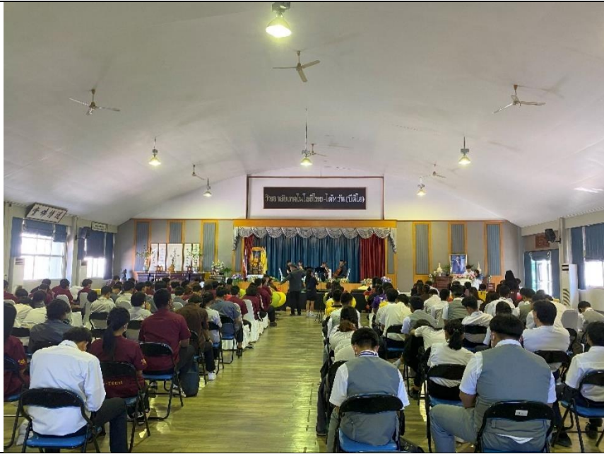
該校學生踴躍出席活動