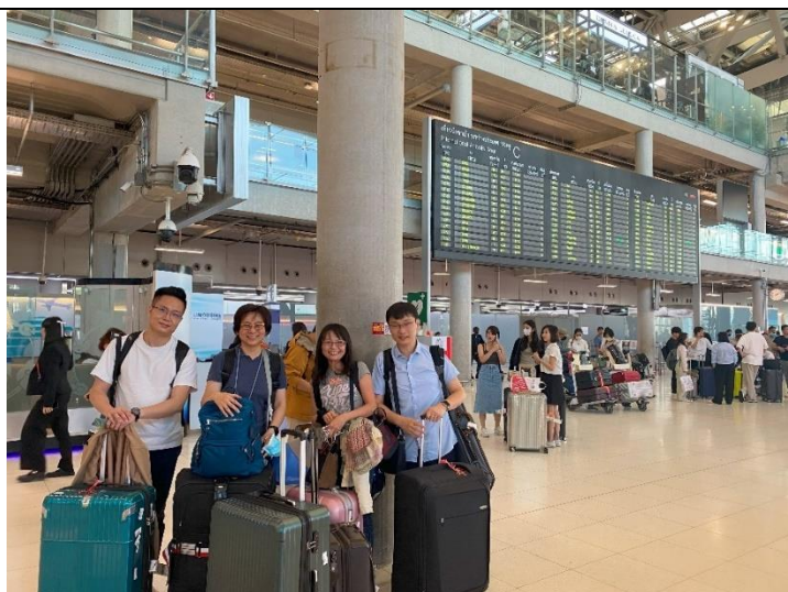
NTSO 弦樂四重奏抵達泰國曼谷機場