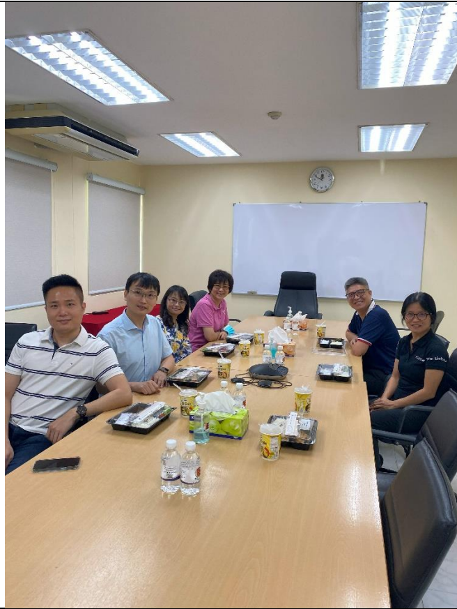
僑校接待老師與樂團老師午餐會議