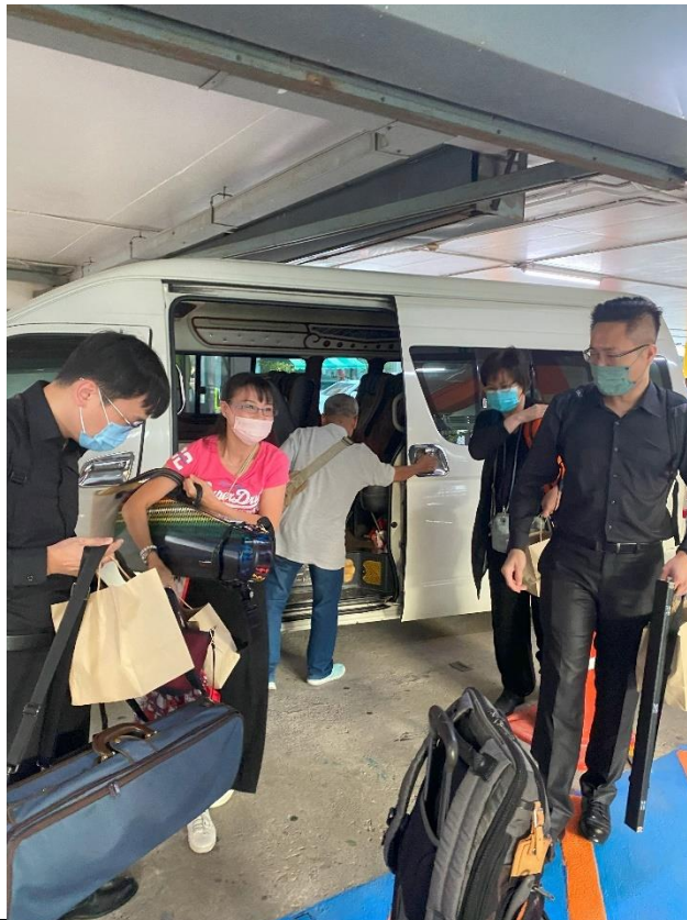
泰國中華國際學校交流演出日抵達