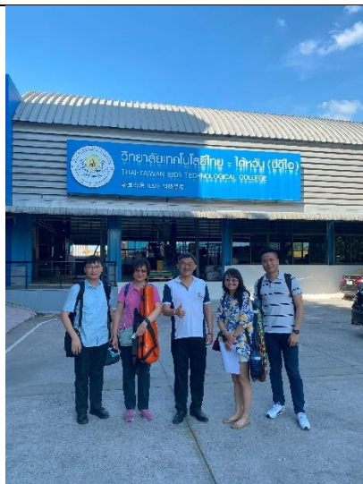
樂團老師與泰國-台灣(BDI)科技學院李副校長校門口合影