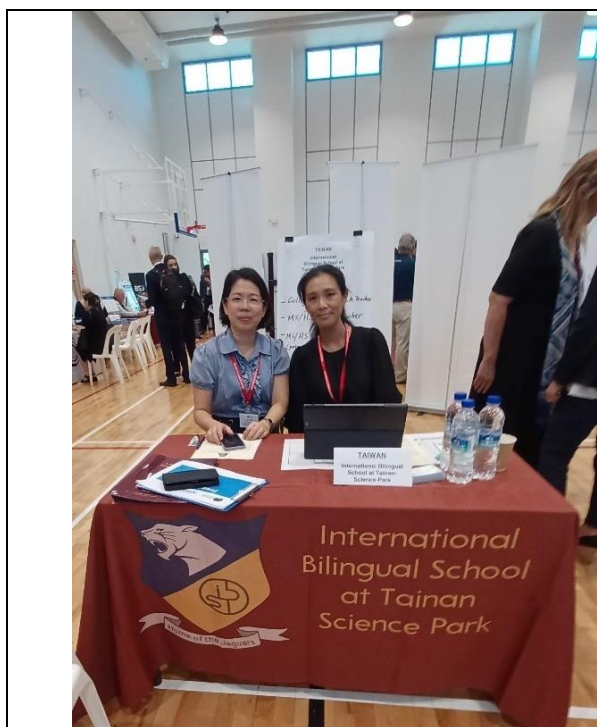
圖一：招聘博覽會會場