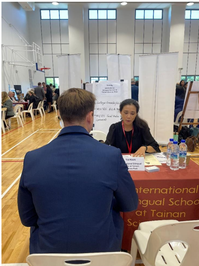
圖四：主任與求職教師面談