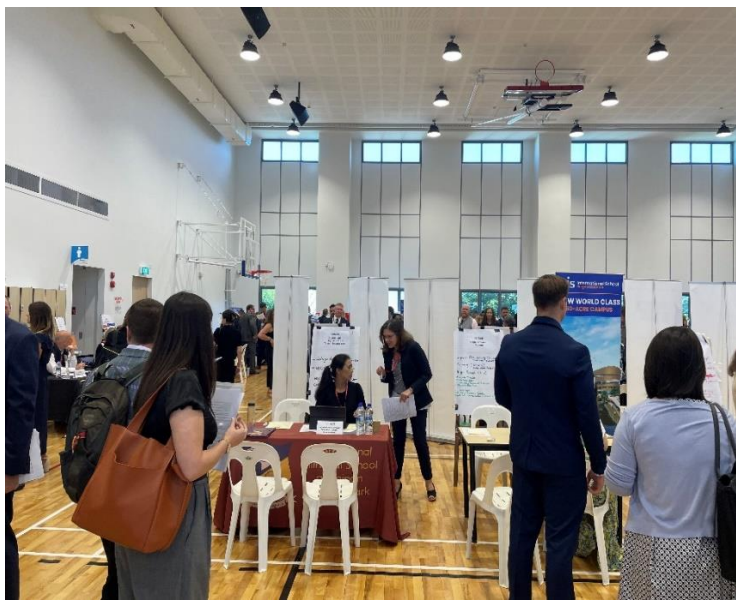
圖三：於活動會場，求職教師於會場尋找有符合專長的職缺