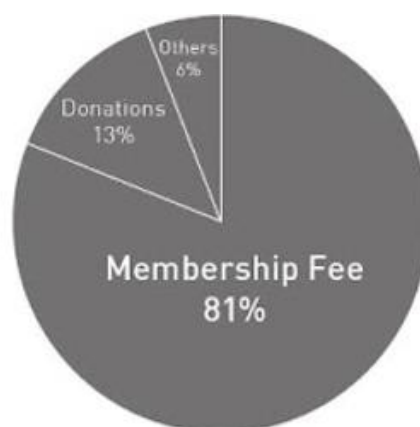
圖 2、參與連帶 2021 年度收入以個人捐贈及會費為主