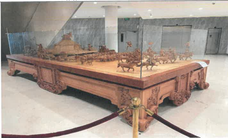
成吉思汗博物館典藏之可汗出征車隊木雕