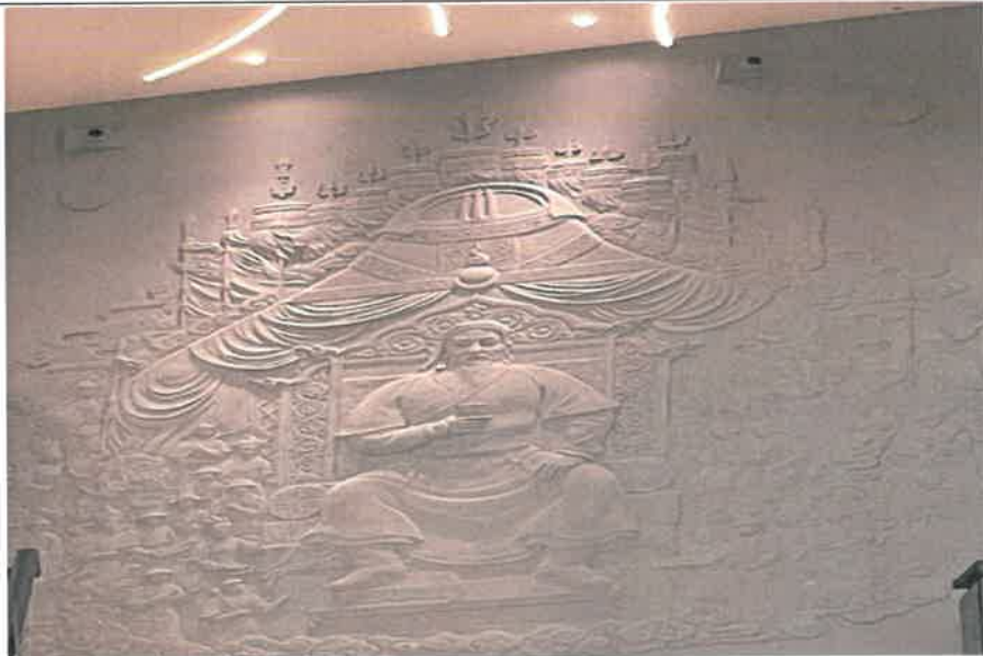
成吉思汗博物館參觀入口前方壁像