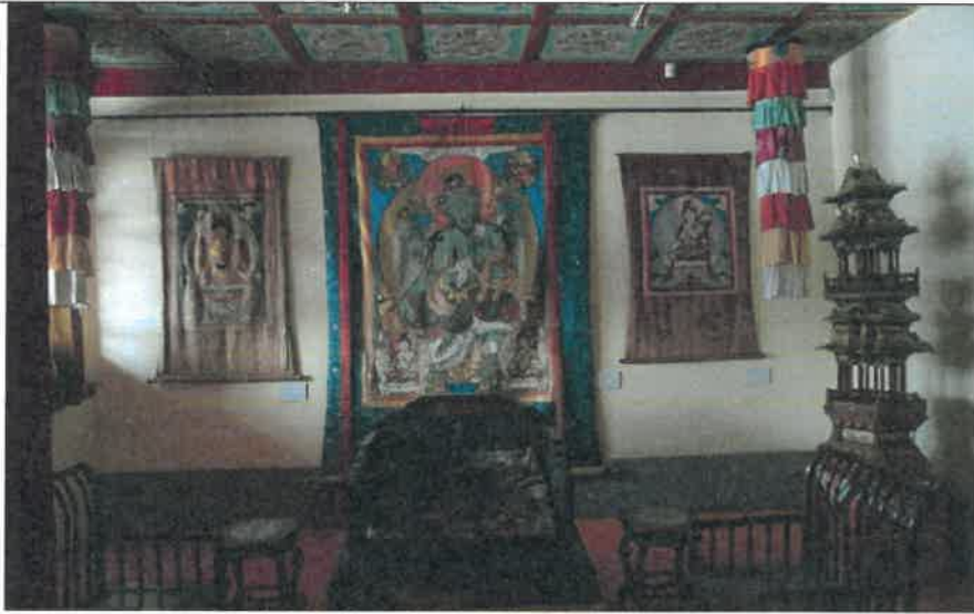
博克多汗冬宮博物館唐卡展間