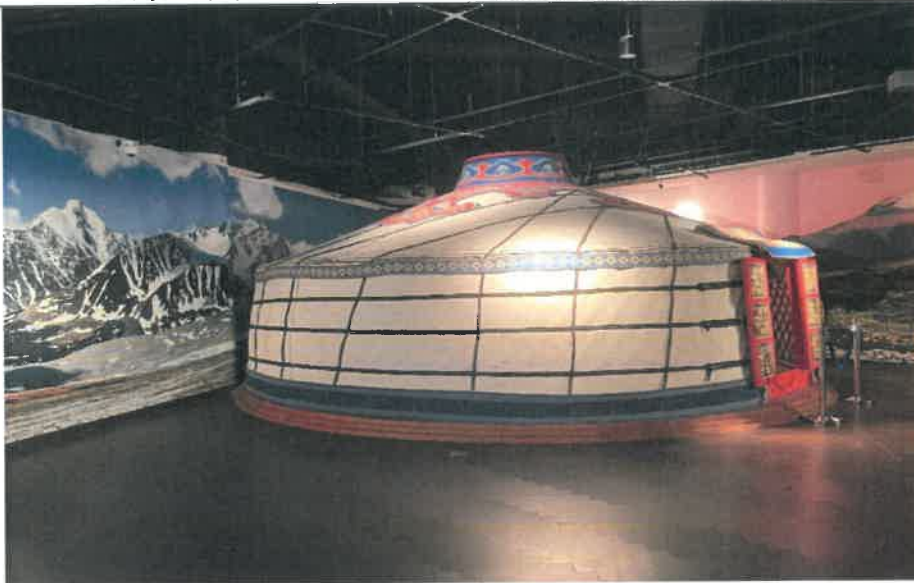
成吉思汗博物館蒙古包展間