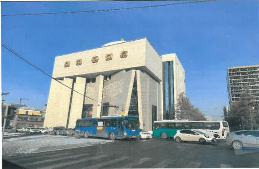
成吉思汗博物館外觀