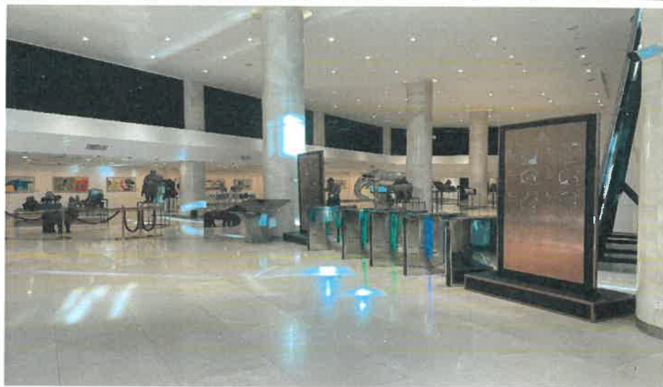
成吉思汗博物館大廳二