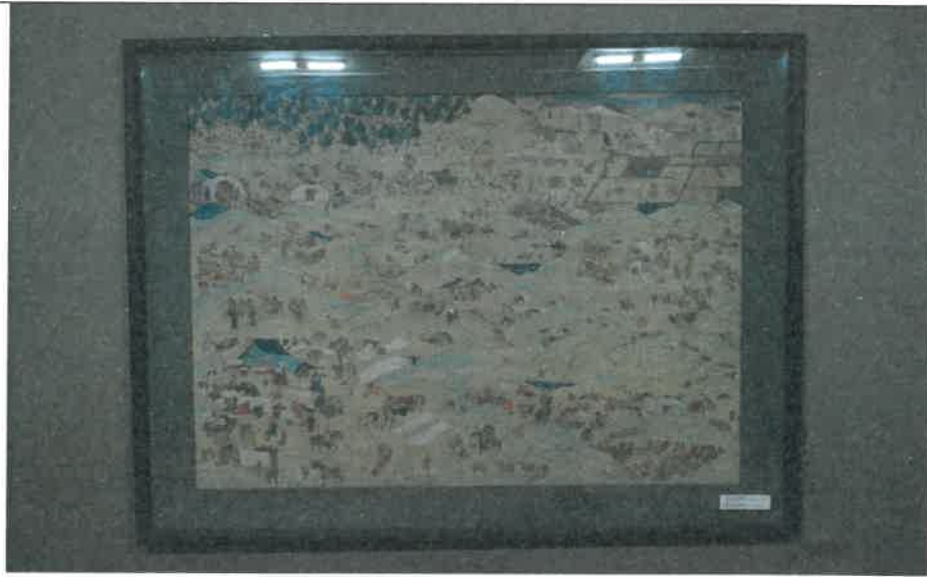
描繪蒙古牧民生活畫作—蒙古的一天