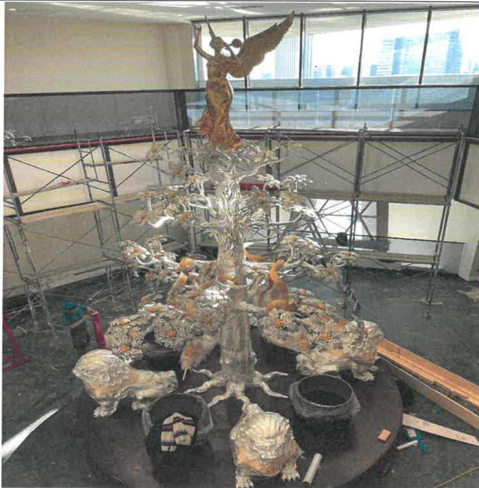
成吉思汗博物館製作中裝置—蒙古國古都哈拉和林的銀樹噴泉