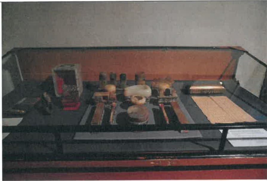
博克多汗用文房四寶