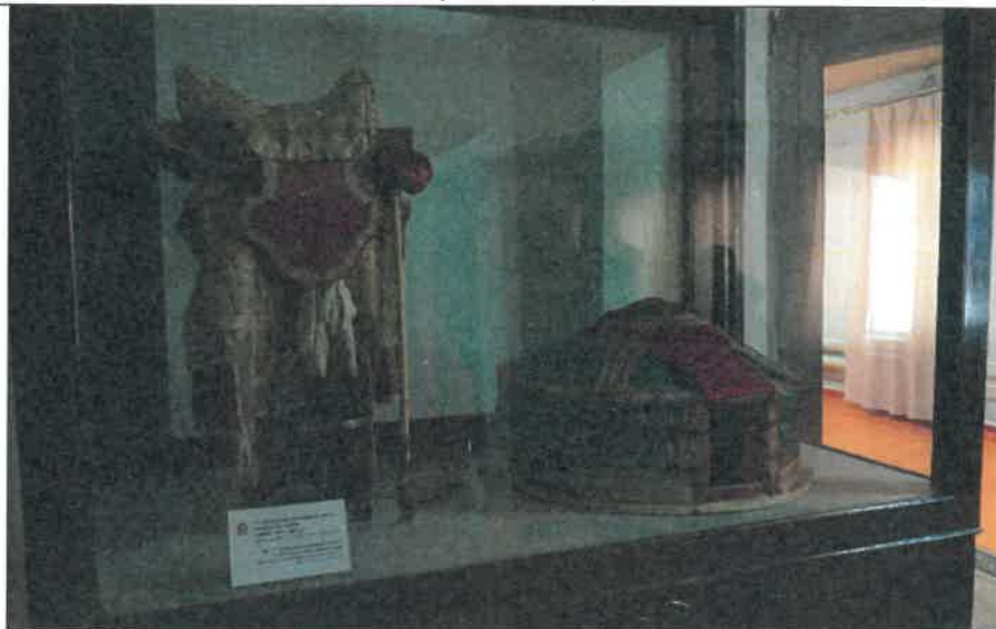
博克多汗兒時用馬鞍與蒙古包童玩