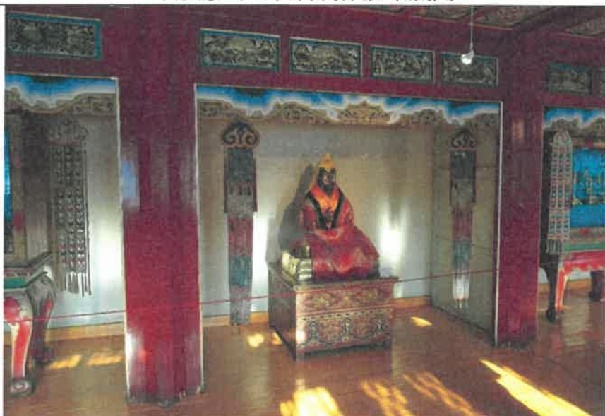
博克多汗冬宮博物館佛像展間