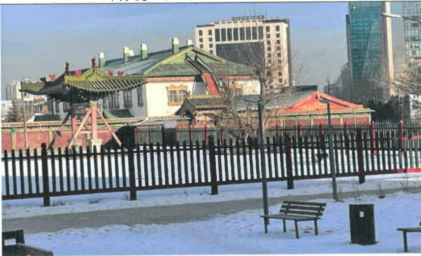
博克多汗冬宮博物館館外近照