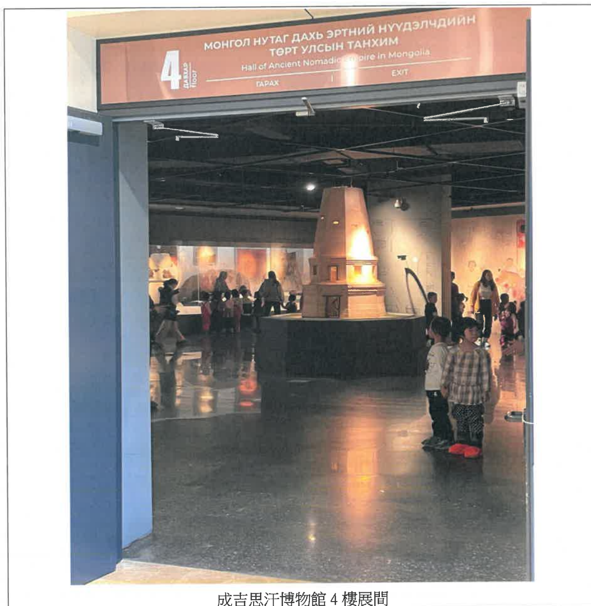
成吉思汗博物館 4 樓展間