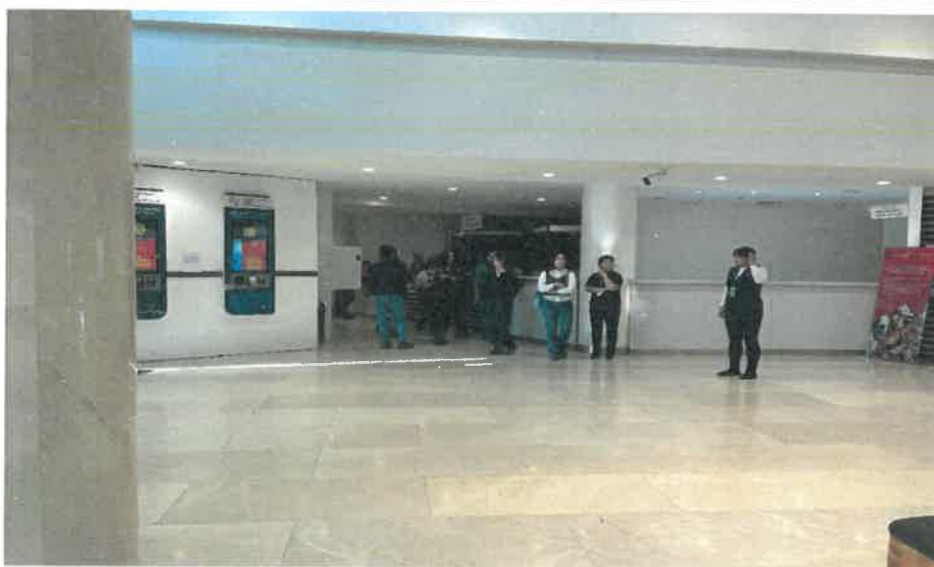
成吉思汗博物館大廳服務台與購票處