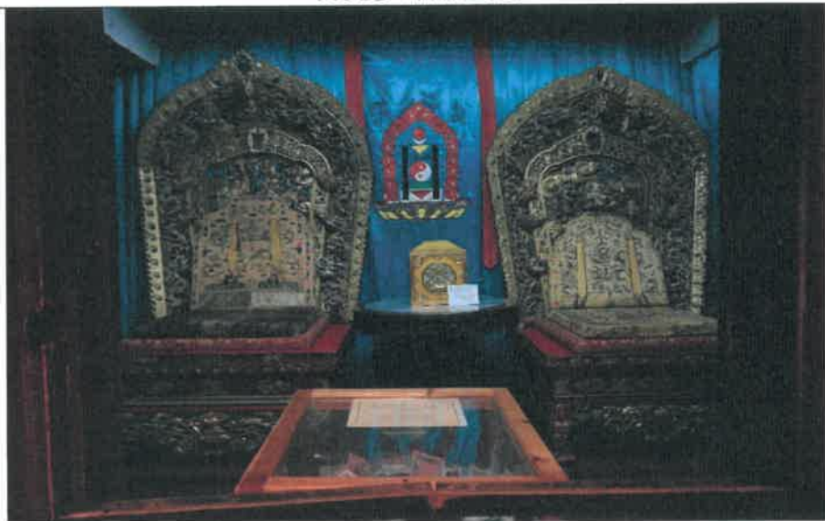
博克多汗公務座位