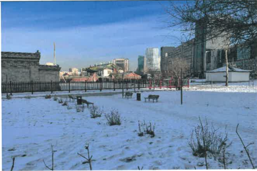
博克多汗冬宮博物館館外遠景