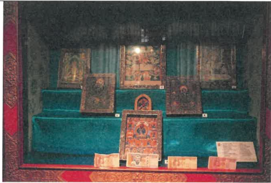
博克多汗冬宮博物館典藏嘎烏佛像