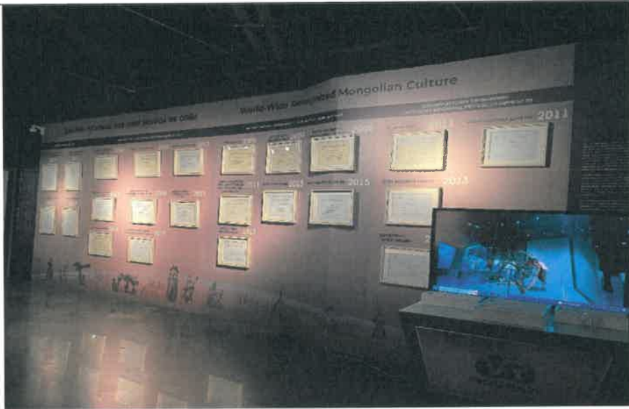
與蒙古相關之文化遺產或文物獲世界紀錄之證書牆