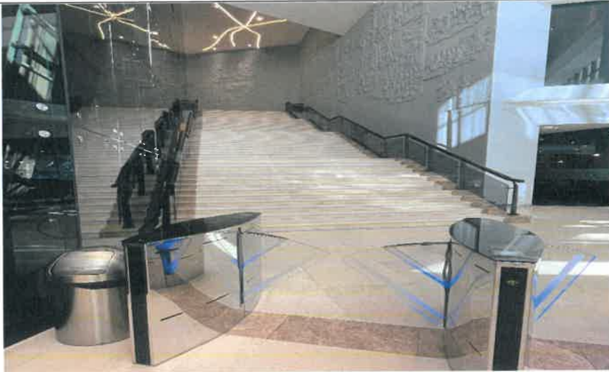
成吉思汗博物館參觀入口