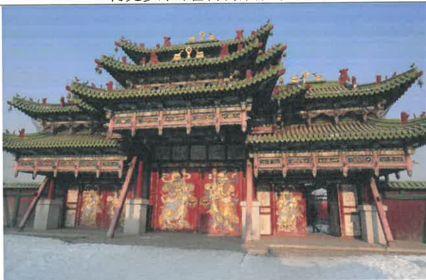
博克多汗冬宮博物館牌樓正面