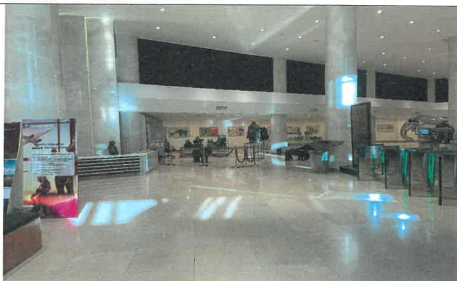
成吉思汗博物館大廳一