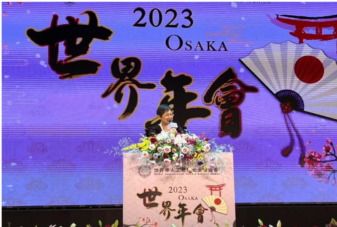
10月18日晚間主持世界華人工商婦女企管協會2023年會之僑委會晚宴