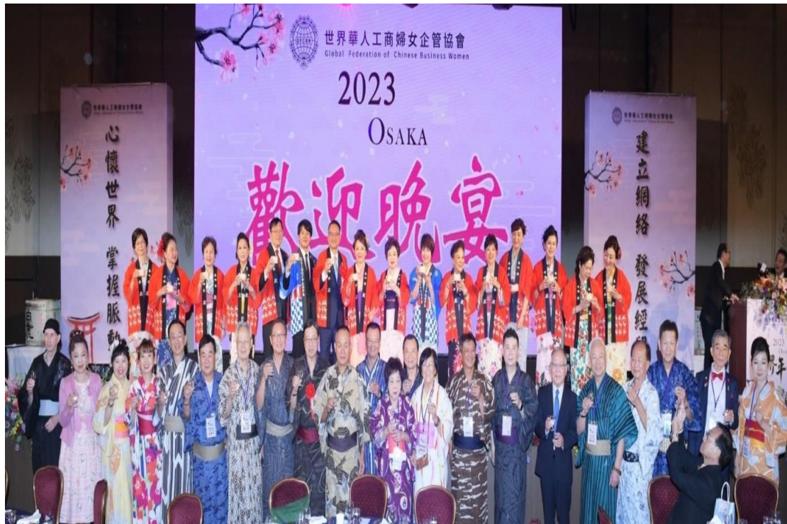
10月16日晚間出席世界華人工商婦女企管協會2023年會之歡迎晚宴