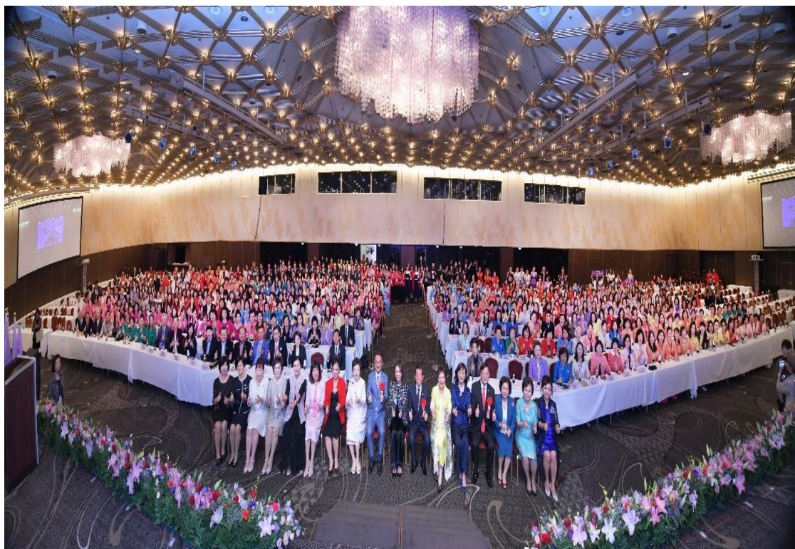
10月17日上午出席世界華人工商婦女企管協會2023年會之開幕式