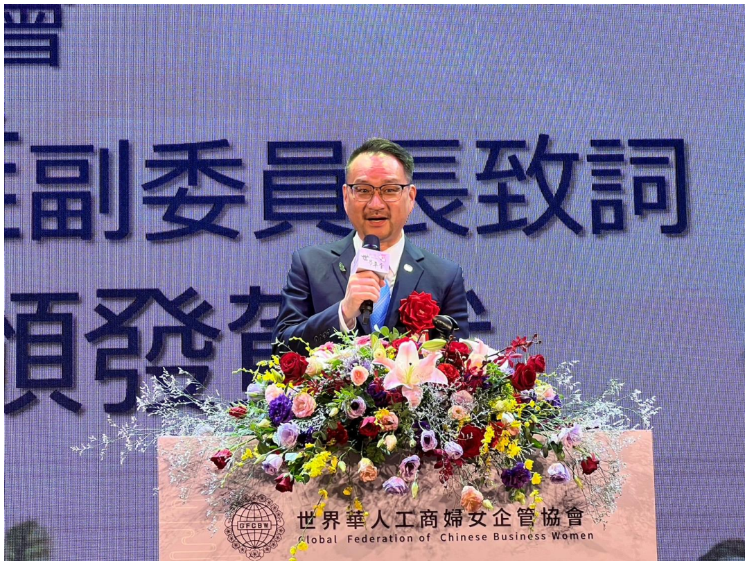
10月16日下午出席世界華人工商婦女企管協會日本關西分會第3、4屆會長交接典禮