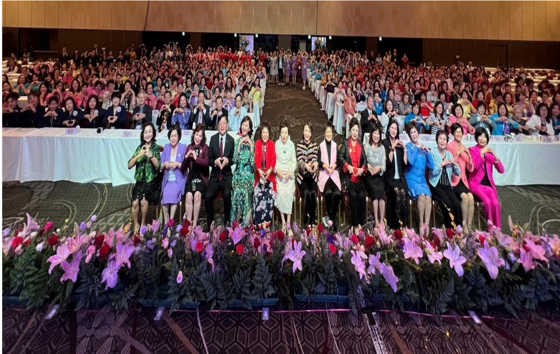
10月18日下午出席世界華人工商婦女企管協會2023年會之閉幕式