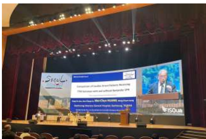
黃偉春醫師大會演講