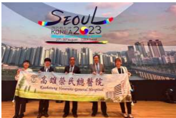
高雄榮民總醫院出席人員