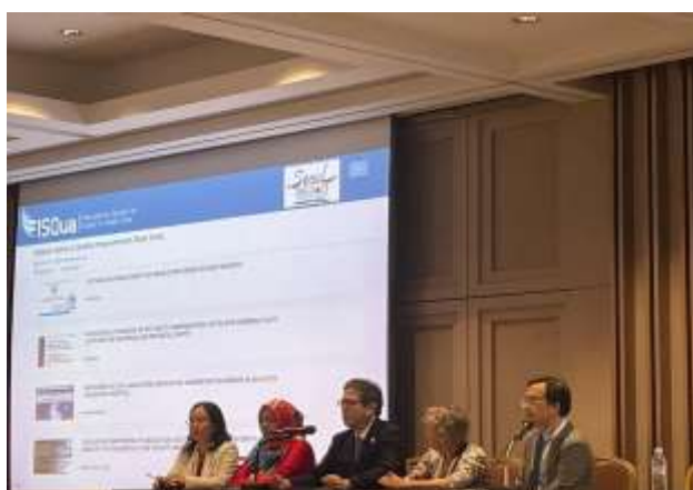
莊旺川醫師口報主題