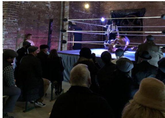
圖 20 摔角表演。