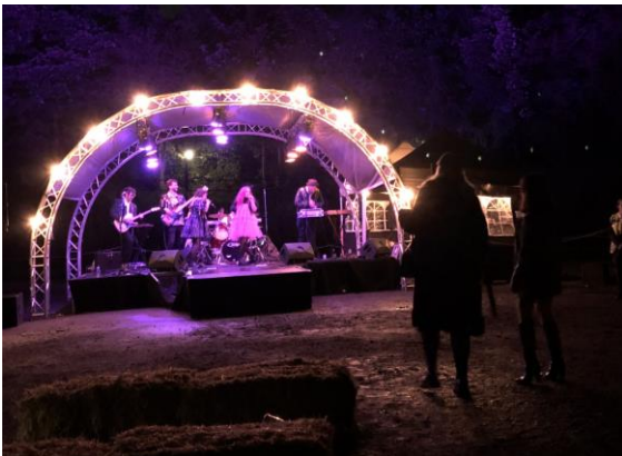
圖 19 樂團歌唱表演。

黑鄉生活博物館為英國影集《浴血黑幫》拍攝場景，劇情描述鄰近黑鄉生活博物館的伯明罕地區黑幫勢力的擴張。該館以影集名稱命名，規劃相關活動，有樂團歌唱、舞蹈、摔角、賽馬等活動。