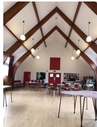
圖 30 1950 年代福利中心