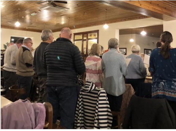
圖 27 志工合唱團排練。