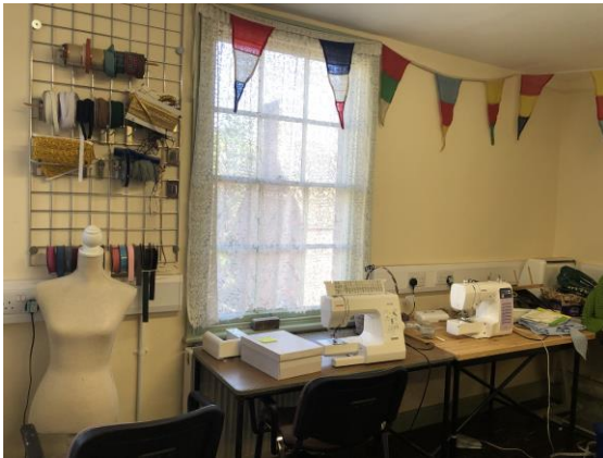
圖 15 服飾團隊的工作室。