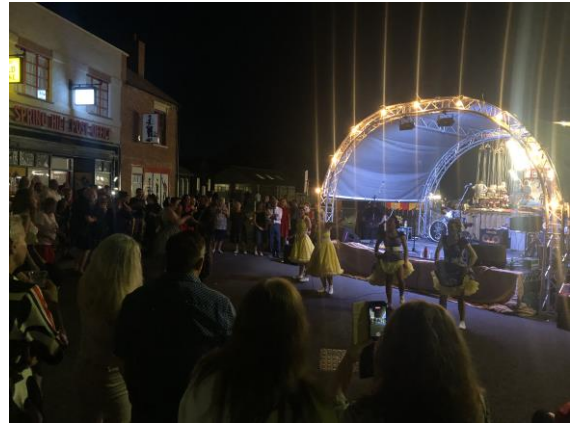
圖 18 舞蹈教學。