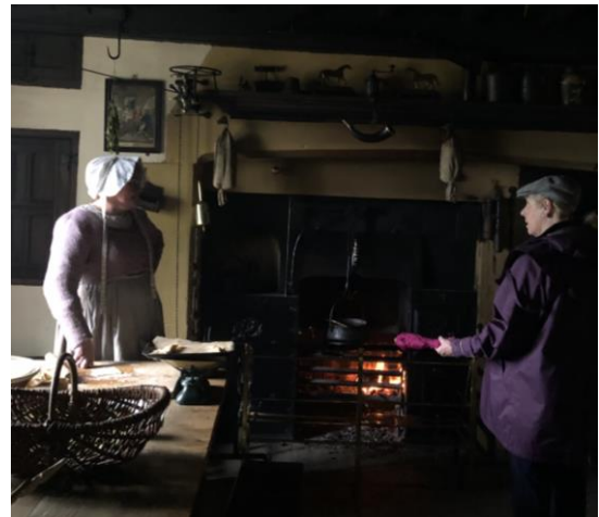
圖 26 波克里的融入人員與遊客互動。