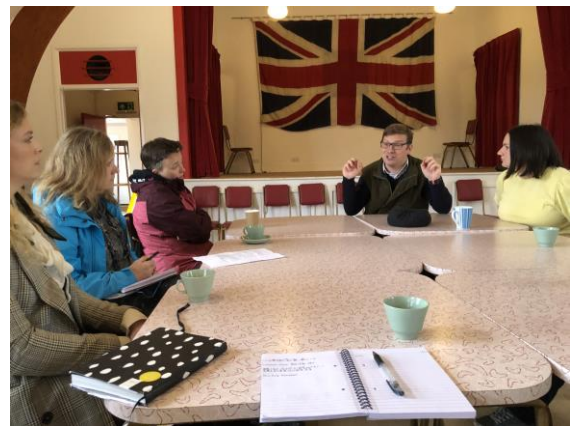
圖 3 「浴血黑幫」活動角色排練工作坊。 圖 4 至比米什北方生活博物館交流。