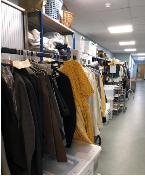
圖 35 暫存待整理之服飾。