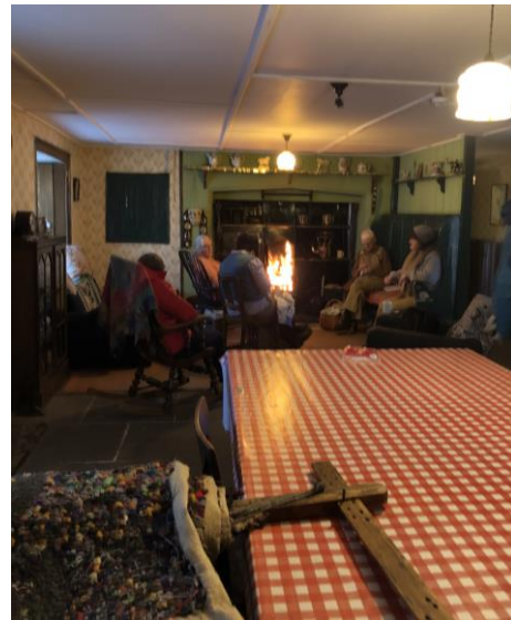
圖 34 1940 年代農莊。