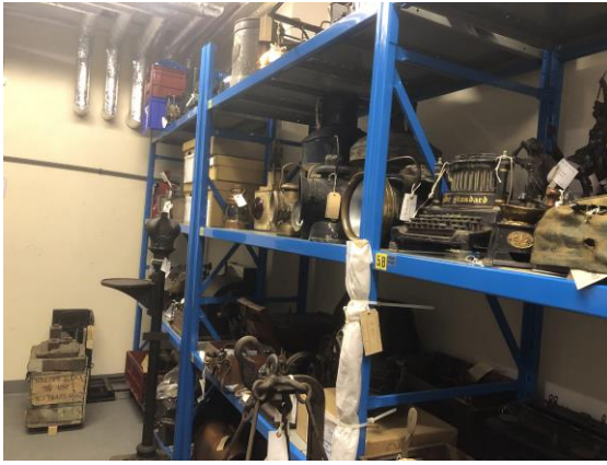
圖 5 典藏庫房。