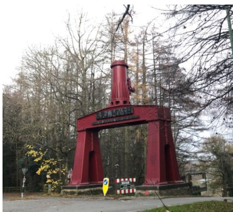
圖 21 比米什北方生活博物館大門。

比米什北方生活博物館約有 460 名館員及 400 名志工，佔地約 350 英畝，分為 1820 年代波克里、1900 年代城鎮、1900 年代礦坑聚落、1900 年代礦場、1940 年代農莊、1950 年代城鎮、1950 年代農莊、火車站、電車等區域 7 。資金來源為門票、活動等自營收入，以及國家樂透遺產基金（National Lottery Heritage Fund）、英格蘭藝術委員會（Arts Council England）等補助。