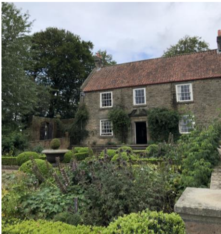
圖 25 波克里建築與花園。

管理 1820 年代波克里區域，包括融入人員培訓、波克里區域佈置、節慶活動規劃。