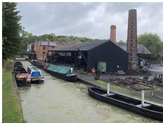
圖 2 黑箱生活博物館碼頭。