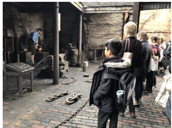
圖 11 歷史角色為遊客解說。