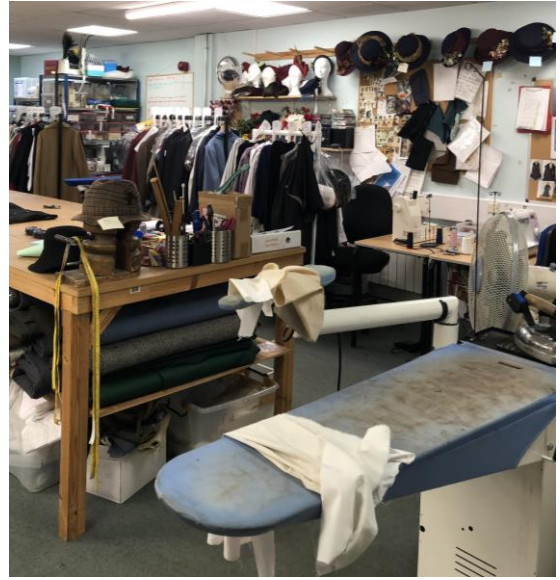
圖 36 服飾團隊工作室。