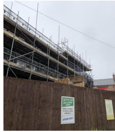
圖 32 建造中的 1950 年代電影院。