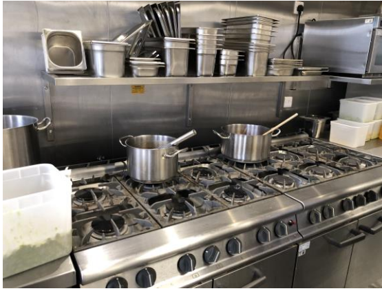
圖 13 廚房空間。