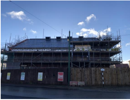
圖 31 建造中的 1950 年代電影院。