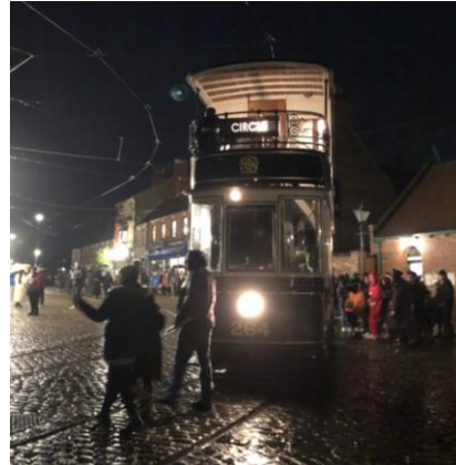
圖 39 1900 年代礦坑聚落的萬聖節佈置。 圖 40 遊客參與萬聖節活動。