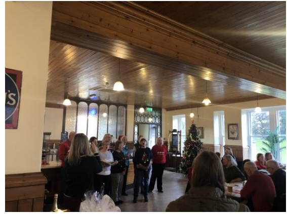
圖 28 志工早晨咖啡聚會