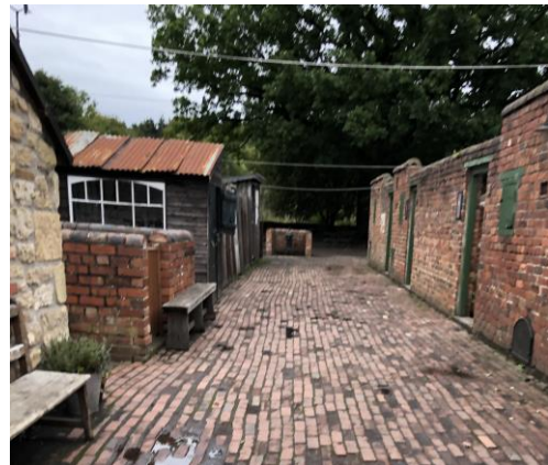
圖 38 1900 年代礦坑聚落村舍後方。