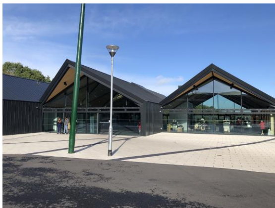
圖 1 黑鄉生活博物館入口。

黑鄉生活博物館約有 320 名館員及 160 名志工，佔地約 26 英畝，重建商店、屋舍及工業區，以代表黑鄉地區的歷史 3 。園區內有 1930 年代商業街，並持續打造 1940 年代、1950 年代及 1960 年代故事 4 。資金來源主要為門票、活動等自營收入，其餘為英格蘭藝術委員會（Arts Council England）、國家樂透遺產基金（National Lottery Heritage Fund）、當地政府等補助。