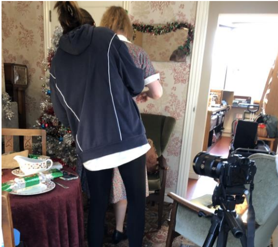
圖 7 宣傳影片拍攝。