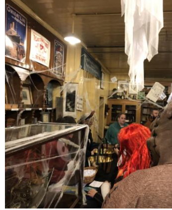
圖 24 1900 年代城鎮的萬聖節佈置