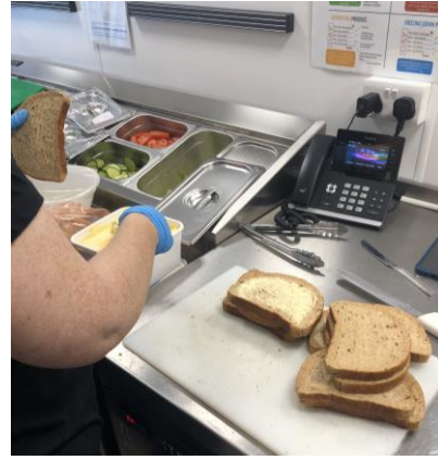
圖 14 館員製作三明治。