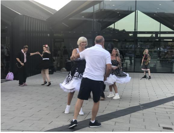
圖 17 遊客隨音樂跳舞。