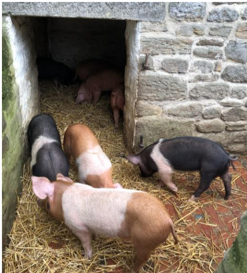
圖 33 1940 年代農莊飼養的豬隻。