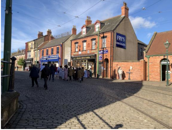
圖 23 1900 年代城鎮建築與街道。