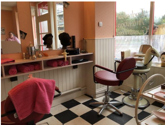
圖 29 1950 年代美髮院。