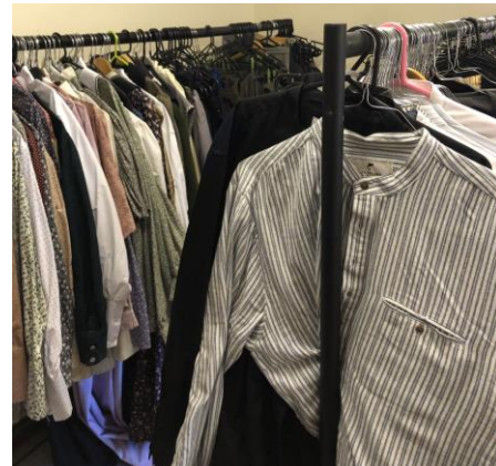
圖 16 服飾存放。