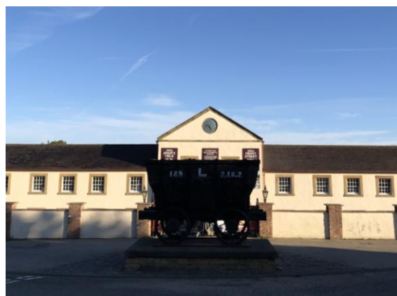
圖 22 比米什北方生活博物館入口。