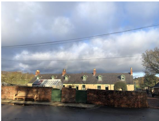
圖 37 1900 年代礦坑聚落村舍。

管理 1900 年代礦坑聚落區域，包括融入員培訓、礦坑聚落區域佈置、節慶活動規劃。