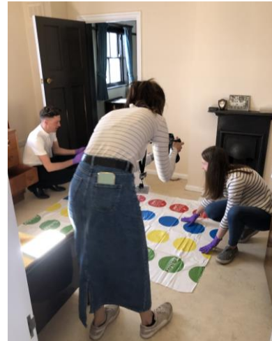
圖 8 宣傳照拍攝。