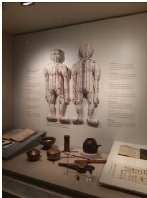
• 陳列展廳文物及說明陳列方式