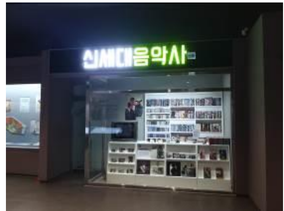
• 韓國影視產業介紹