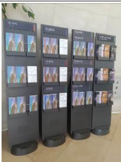
• 多種語言的展廳簡介