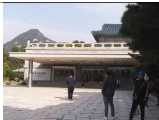
• 國立民俗博物館入口之外觀