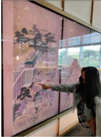
• 兼具教育及娛樂性質之多媒體裝置