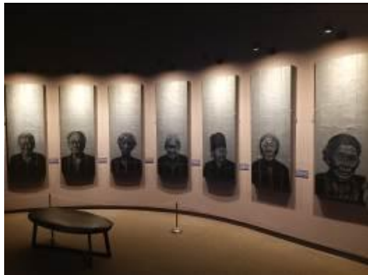
• 歷史館展廳之慰安婦介紹單元