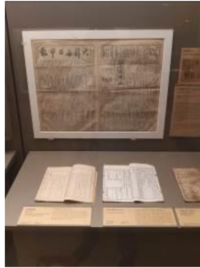
• 展廳中之展品說明