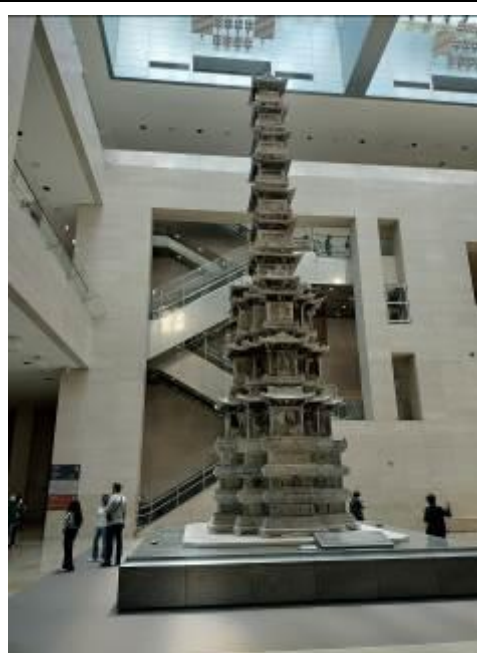
• 置於中央天井的代表館藏十層石塔