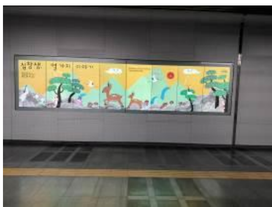
• 博物館步道開口之廣宣螢幕

此外，該館的主要展示方式仍偏傳統，即展櫃搭配說明牌，不過部分展廳利用 LED 屏幕作大型的作品投射，亦穿插部分可供觀眾操作之互動裝置，也有結合畫作主題動畫的裸視立體劇場，以及設計古畫作的遊戲性觸控裝置（類似可動清明上河圖）。該館的總說明及單元說明主要以英韓對照為主，但最基礎的展品說明，在品名處則有四種語言－韓、英、日、簡體中文字。整體而言，對略通英語但不諳韓語的參觀者來說，算是能掌握其展示說明之核心，在參觀及使用其各種設施上亦不至於產生不便感。