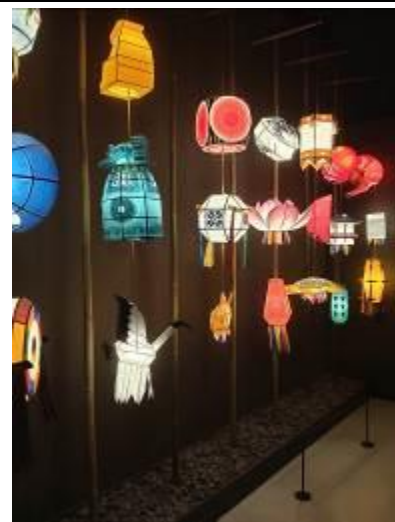
• 介紹韓國特殊禮俗的展廳裝飾