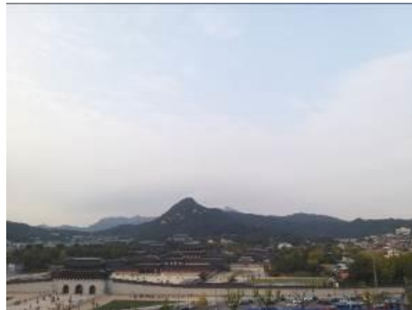
• 可遠眺景福宮的頂樓戶外空中花園