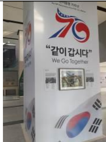
• 主題館美韓同盟七十周年特展