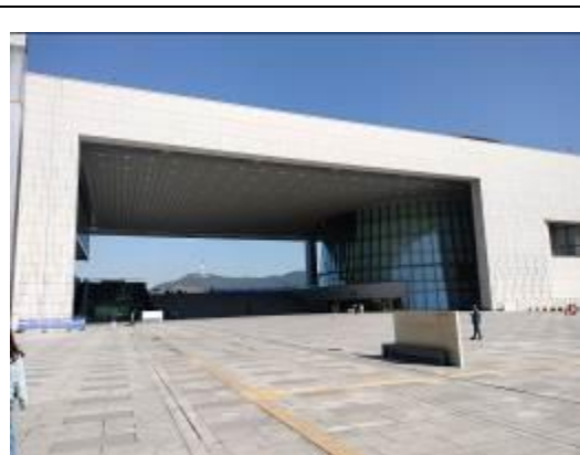
• 國立中央博物館外觀

至晚間9時，其於至下午6時。1樓為「中世・近世館」及「史前・古代館」，2樓為「書畫館」、「捐贈館」和「思惟展廳」、「數位沉浸式體驗館」，3樓為「雕塑・工藝館」與「世界文化館」。基本上1樓是以年代通史的方式，隨著時間流逝從古至近，講述韓國歷史與文化之發展。而2樓的「捐贈館」是展出受贈藏品，同時也在一面紀念牆中展示捐贈者大名，以令人緬懷及深思捐贈之意義和價值。「數位沉浸式體驗館」是以文化遺產為主要的播放素材，直接以數位圖像代替語言，讓不同年齡、國籍或知識背景的受眾，都能有最直觀的美學體驗，進而對博物館藏品產生更多興趣。另外，特別值得一提的「思惟展廳」，則是在偌大的圓形空間中，展出韓國國寶－兩座《半伽思惟像》，以其沉靜冥想風格的空靈聲光及展場木質調設計，引導民眾進入平靜祥和的展示空間中細細欣賞。