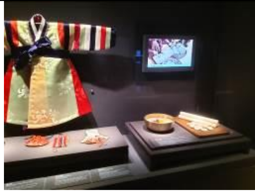
• 陳列展廳文物及說明陳列方式