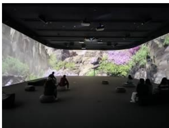
• 轉化重要藏品為動畫的沉浸式劇場