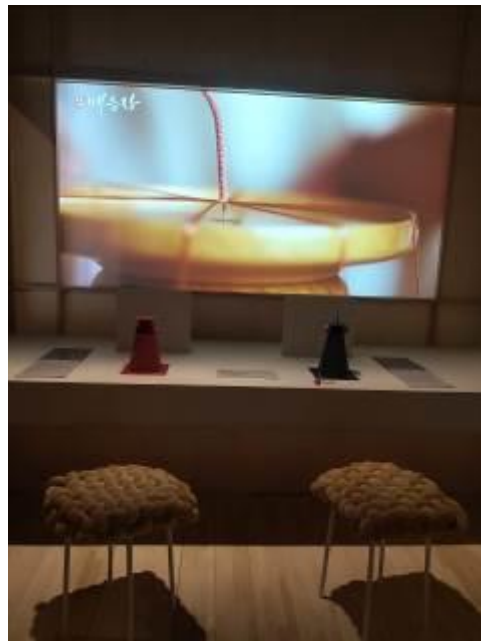
• 企劃展廳之製作繩結輔助工具