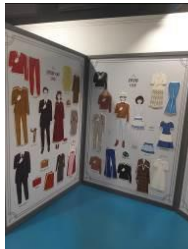
• 兒童體驗專區一隅