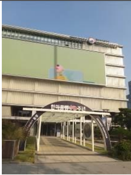
• 大韓民國歷史博物館外觀