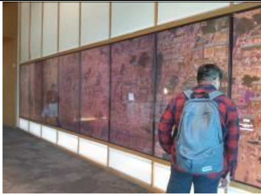
• 數位沉浸式體驗館一隅