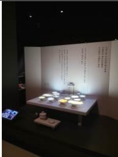
• 介紹韓國特殊禮俗的影音裝置