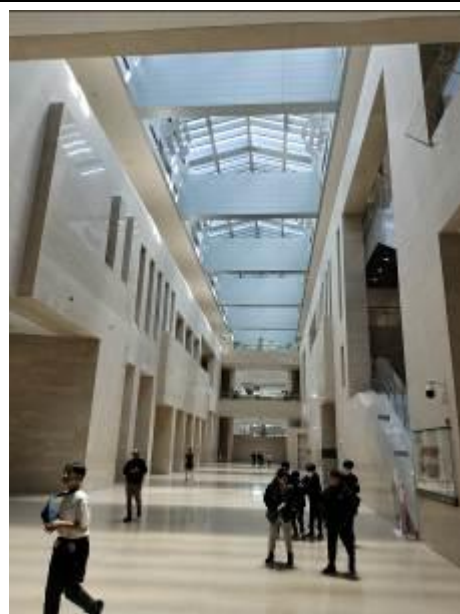
• 國立中央博物館之挑高天井