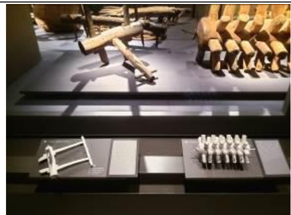
• 可供觸摸之展品模型（旁附點字說明）