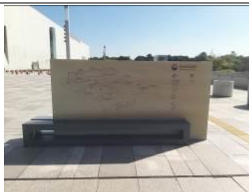
• 國立中央博物館廣場之園區說明圖