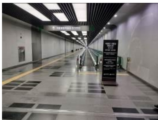
• 由捷運站通往博物館之專屬電動步道