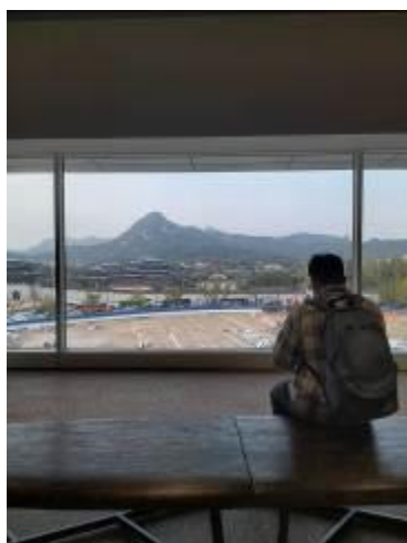
• 有大片落地窗的室內休憩空間

該館韓戰後的展示內容較偏重於常民生活、民主運動、金融風暴影響等單元，陳設展品方式多以常民物件或當時選舉文宣、新聞影片等方式展出，整體風格平易近人，可惜除了影片可供觀者自行點選外，其餘並無太多互動方式。展場最末段，講述韓國影視產業的崛起，年表式選單整合的十分詳細，而且操作容易，實體展品包括 BTS（韓國男子團體－防彈少年團）所獲的獎牌等，非常貼近觀眾切身所經歷的時事，可見其展廳能彈性因應現行事件或議題發展，持續規劃並儘速更新展示內容。