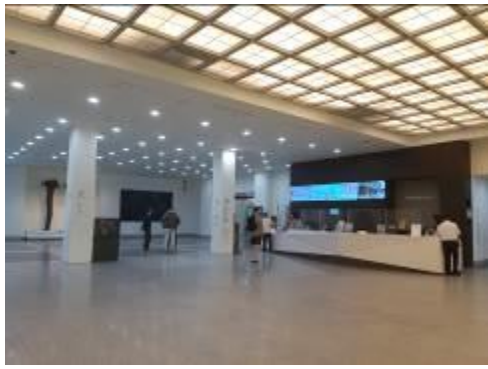
• 國立民俗博物館之大廳