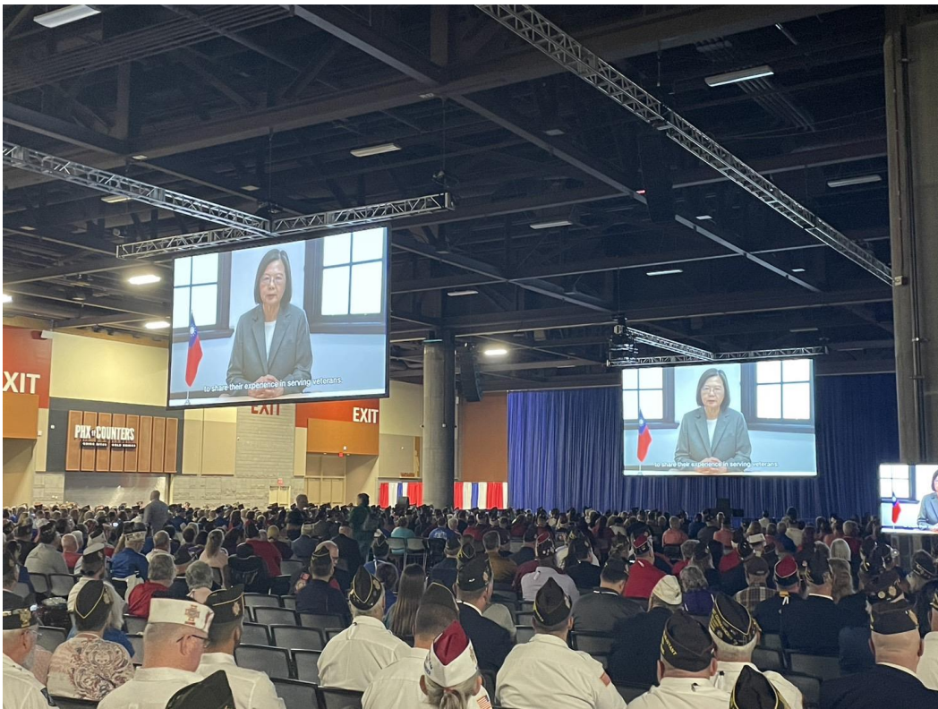
蔡總統預錄賀詞於聯合開幕大會中播放