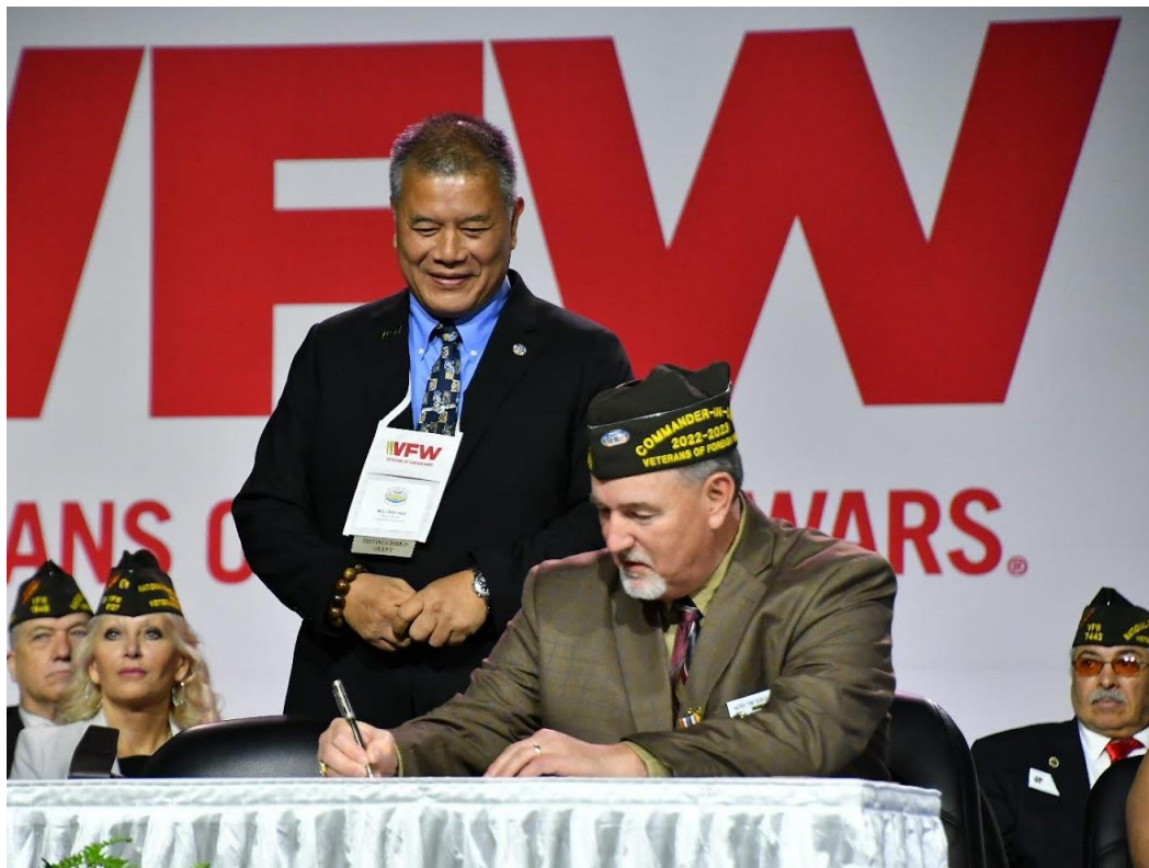
博蘭總會長(坐者)與退輔會締結兄弟會新約