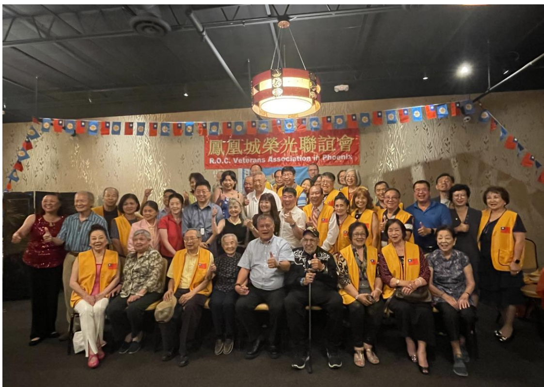
吳副主任委員(第一排左5)與鳳凰城榮光會會員代表合影