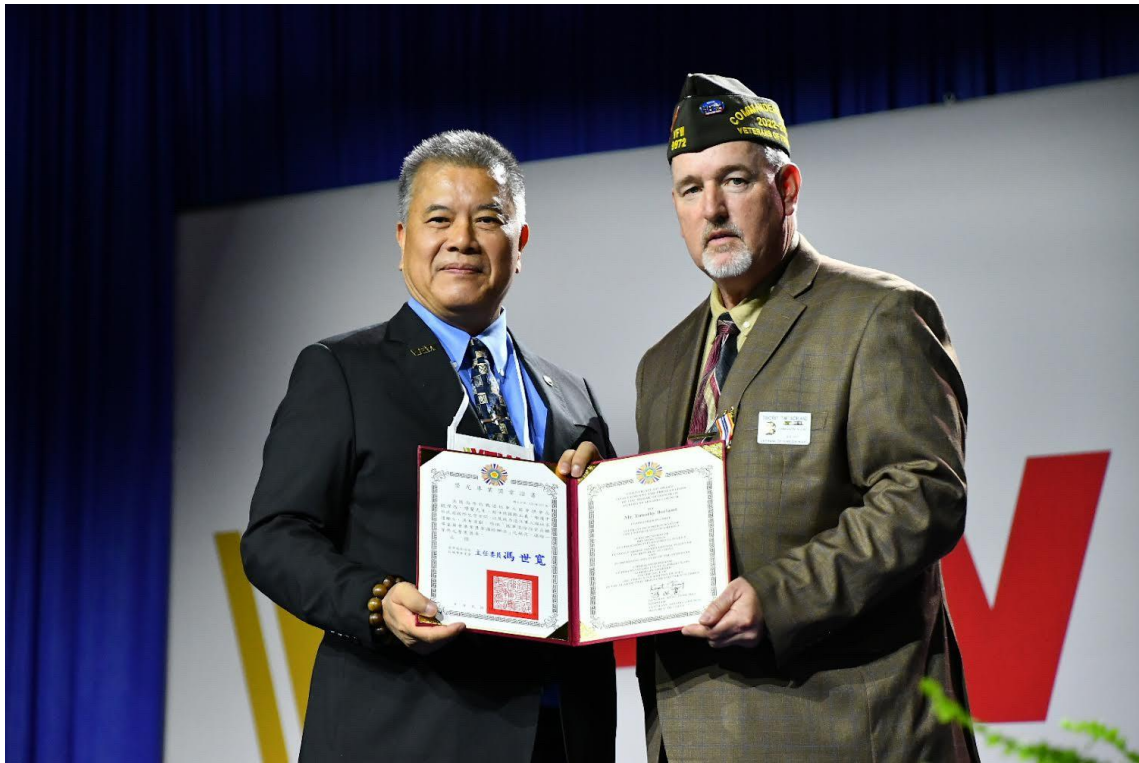
吳副主任委員(左)致贈退輔會榮光專業獎章予美國海外作戰退伍軍人協會總會會長提摩西·博蘭先生(右)