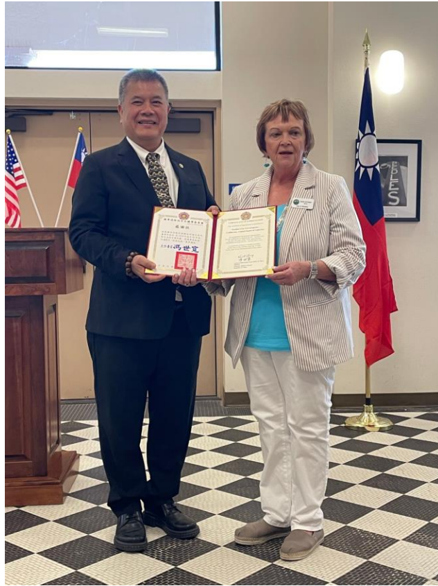
吳副主任委員(左)頒贈感謝狀予麗都市市長Janet Jernigan女士(右)