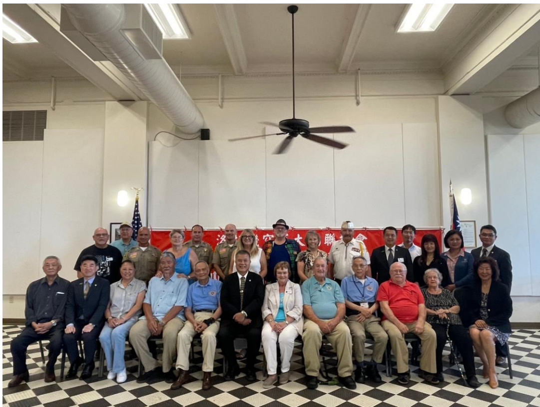
吳副主任委員(坐者左6)、麗都市市長(坐者左7)、鳳凰城榮光會、洛杉磯榮光會及空軍大鵬聯誼會合影留念