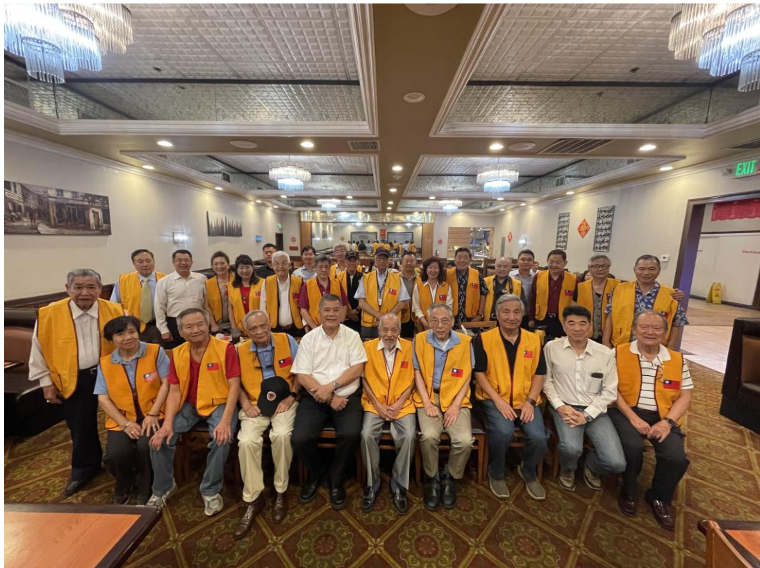
吳副主任委員(第一排左4)與洛杉磯榮光會會員代表合影