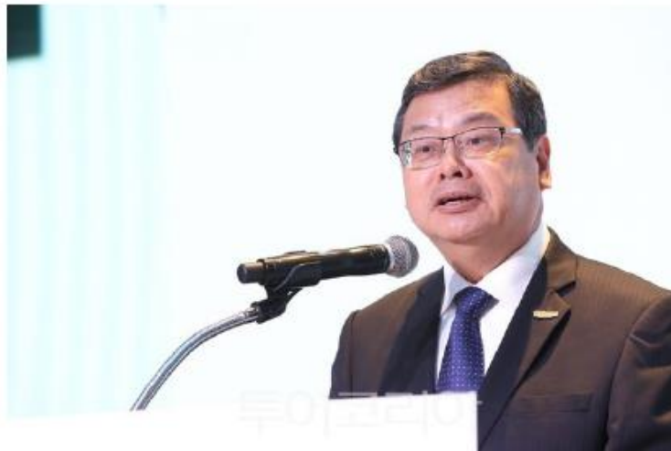
대만 교통부 관광국장 장시충 국장

한국과 대만의 관광 활성화를 위한 '한국-대만 관광교류회'가 강원도 강릉 세인트존스호텔에서 오늘(14일) 시작됐다.