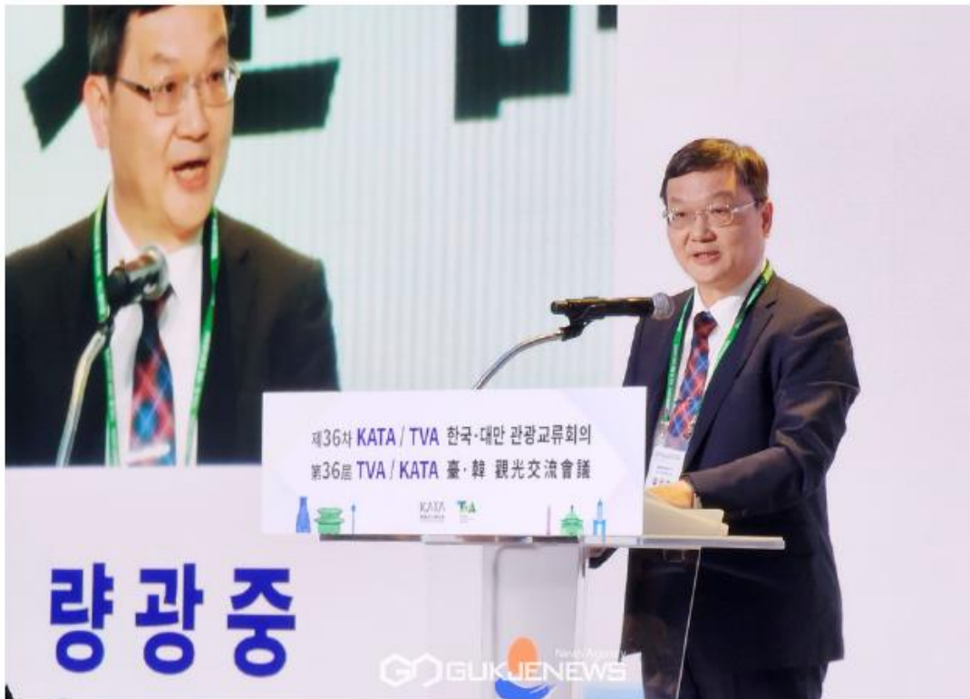
량광중 대표 사진/유지현 기자

(서울=국제뉴스) 유지현 기자 = 14일 강원도 강릉시 세인트존스호텔에서 제36차 KATA/TVA 한국·대만 관광교류회의가 열렸다.