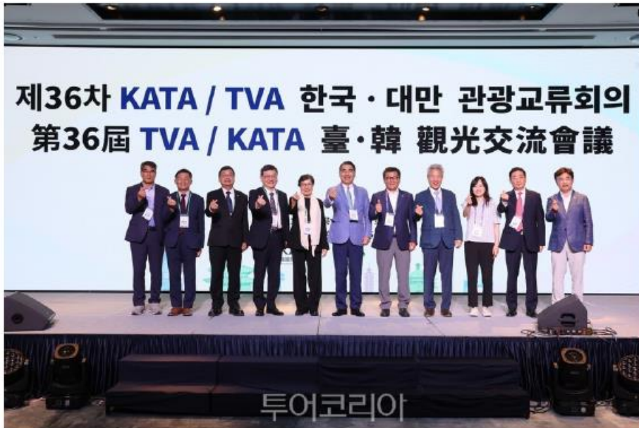
한국-대만 관광교류회의 개최식 후 단체 기념사진 촬영

이번 관광교류회의에서는 '한국-대만간 상호 교류 300만 명 목표 달성을 위한 국제 관광 재개 전략을 주제로 ▲한국-대만관광시장 활성화 전략, ▲ 테마관광 활성화 계획, ▲ 지방 도시의 관광전략 등에 대해 집중적으로 논의할 예정이다.