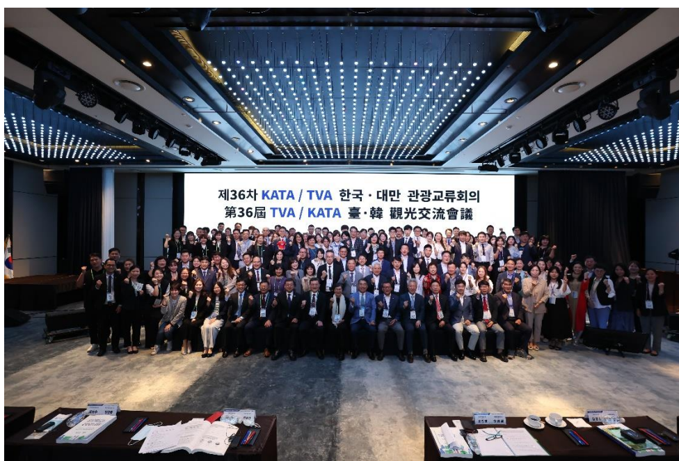
2023年6月14日臺韓觀光交流會議全體大合照