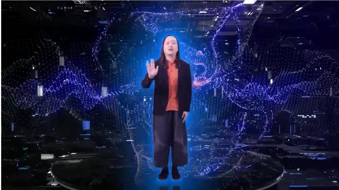
唐鳳部長的虛擬分身