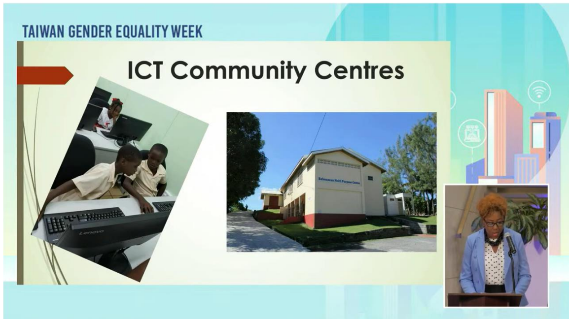
聖露西亞的 ICT 社區中心

丙、國家科學及技術委員會（以下簡稱國科會）副主委陳儀莊介紹我國推動性別主流化之成果以及我國近年重要進展，包括 2019 年同性婚姻合法化、2021 年有超過 40% 的立法委員為女性，以及 2022 年性別不平等指數（Gender Inequality Index），我國居亞洲首位等。另說明國科會的性別平等策略，例如為鼓勵女性研究人員在生育子女後仍留在職場，提供多元協助措施。