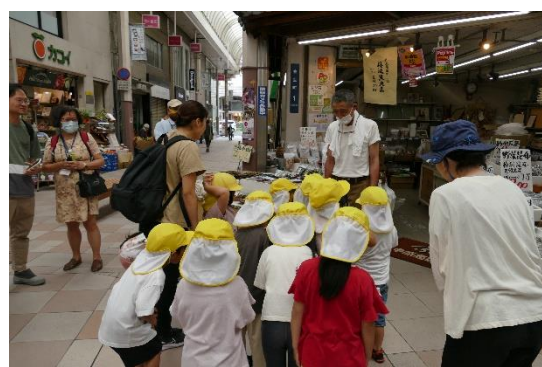
幼兒園會帶著小朋友到商店街購買食材，甚至為社區的獨居老人送餐