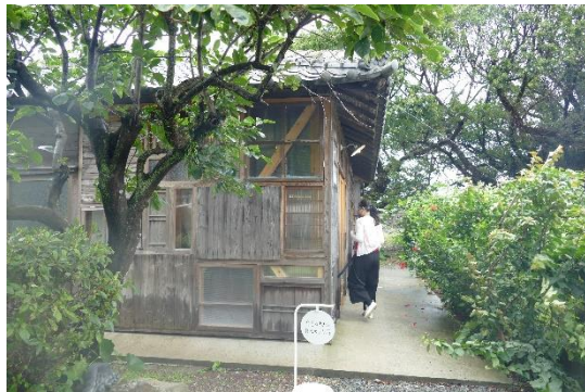
山下社長認為開店為促成島嶼自立的重要基礎設施