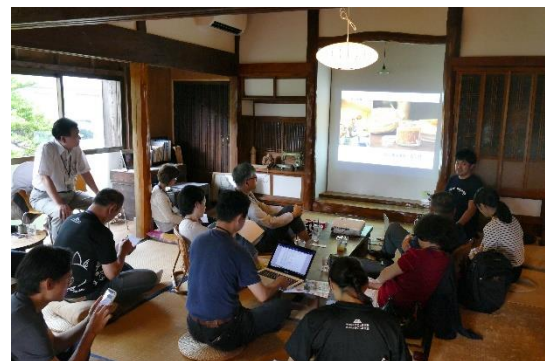
以「島守株式會社」作為空屋改造、移居者諮詢及島內生活人才育成窗口