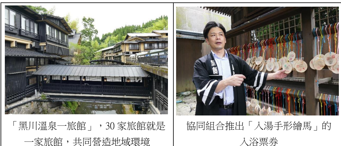
「黑川溫泉一旅館」，30 家旅館就是一家旅館，共同營造地域環境

通過上述方案，黑川溫泉的業者們希望以協同組合作為共同行動的中介機制，打造黑川溫泉 2030 願景，藉由同業與異業之間的串連，形成彼此相互團結的行動團，共同實踐日本里山指標，讓黑川溫泉得以成為可持續性發展的溫泉地，並促成地方農牧業與生態環境的永續循環發展。