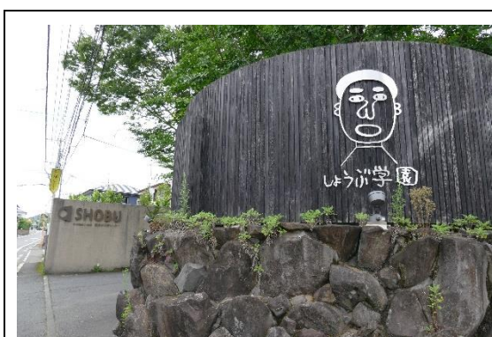
菖蒲學園為一所陪伴智能與精神障礙者的社會福利措施兼庇護工場

在這個過程中，可以看到，園方並未將「設施使用者」自身所處的邊緣角色視為人格或身心發展的「障礙」，反而將其視為創作、創意發想的起點，並且不斷思考，園區所提供的各項服務設施是否能夠帶給「設施使用者」幸福，以及幸福、正常的標準到底是什麼。園方認為，與其引導「設施使用者」去適應主流社會所定義的「正常」道路，不如創造一個空間(如劇場、工藝工場)，讓他們能夠充份發揮他們已經有的能力或是他們所具備的特質。同時要讓大家認識他們，而且讓他們可以更去發揮他們所擅長的事情，反過來拓寬主流社會對於「正常」的想像，讓更多異質群體的差異都可以被包含在其中，創造一個彼此和諧共存、分棲共生的多樣社會。