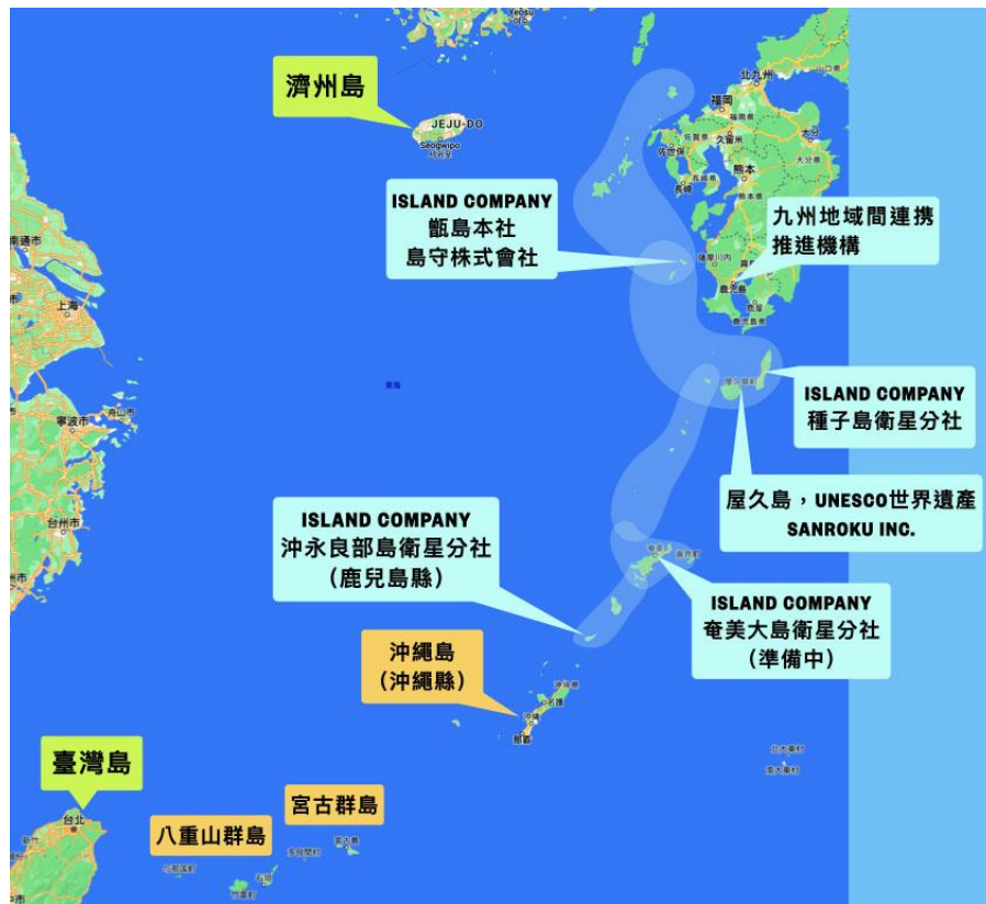
圖 2：東海島嶼的斷裂認同與 Island Company 的東海島嶼聯盟規劃