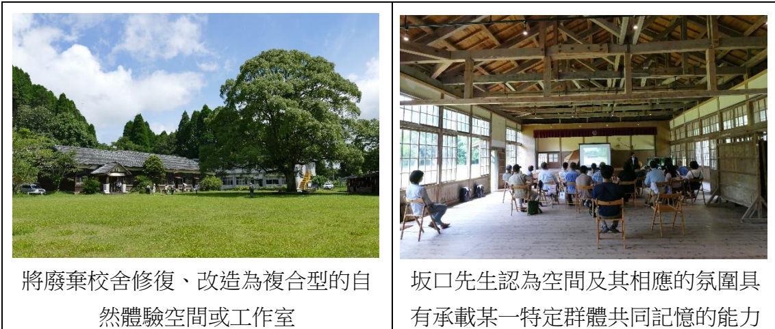
將廢棄校舍修復、改造為複合型的自然體驗空間或工作室