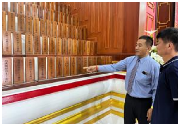
王會長說明陣亡將士牌位