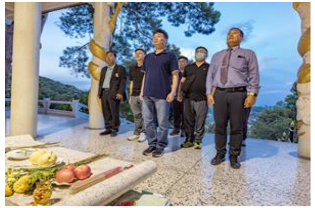
向段希文將軍墓致敬