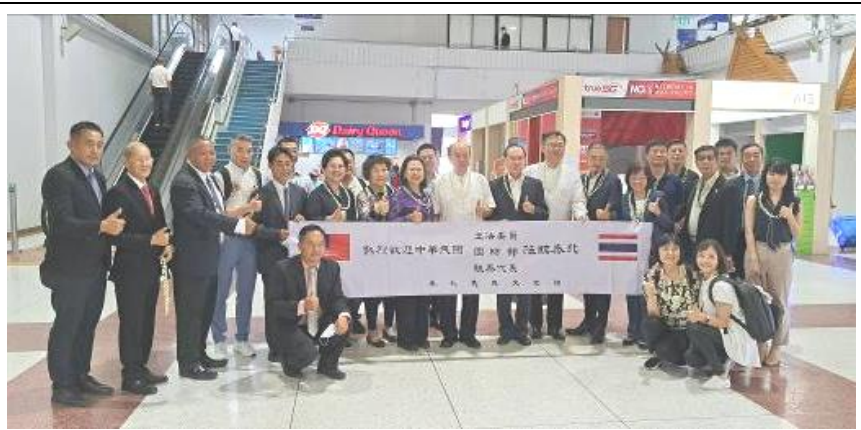
泰北義民文史館王會長等員接機恭迎

(二)專案小組於當地時間 1750 時抵達美斯樂，正門牌樓用中、泰文題有「泰北義民文史館」，兩側對聯「養天地正氣，法古今完人」，字裡行間蘊含著濃厚