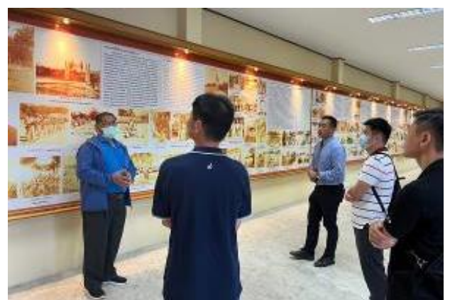
專員解說孤軍歷史

(三)專案小組於 1900 時前往段希文將軍墓前致敬，王會長於現地說明當年段將軍於美斯樂幫助孤軍及遺族重建家園等往事，迄今仍深受美斯樂後代孤軍所尊崇。