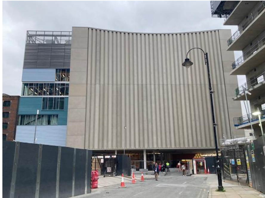
Aviva Studios 部分空間正在施工中，預計 2023 年 10 月竣工。

講者也分享建造過程遇到的技術困難，例如伸縮座椅移動收納的部分，考量到運輸與負重的問題，與擁有特殊全向輪組運輸系統的法國公司合作，並與德國製造商合作開發相關負重系統。另外吊掛系統也經過團隊的特殊設計，以符合使用需求。