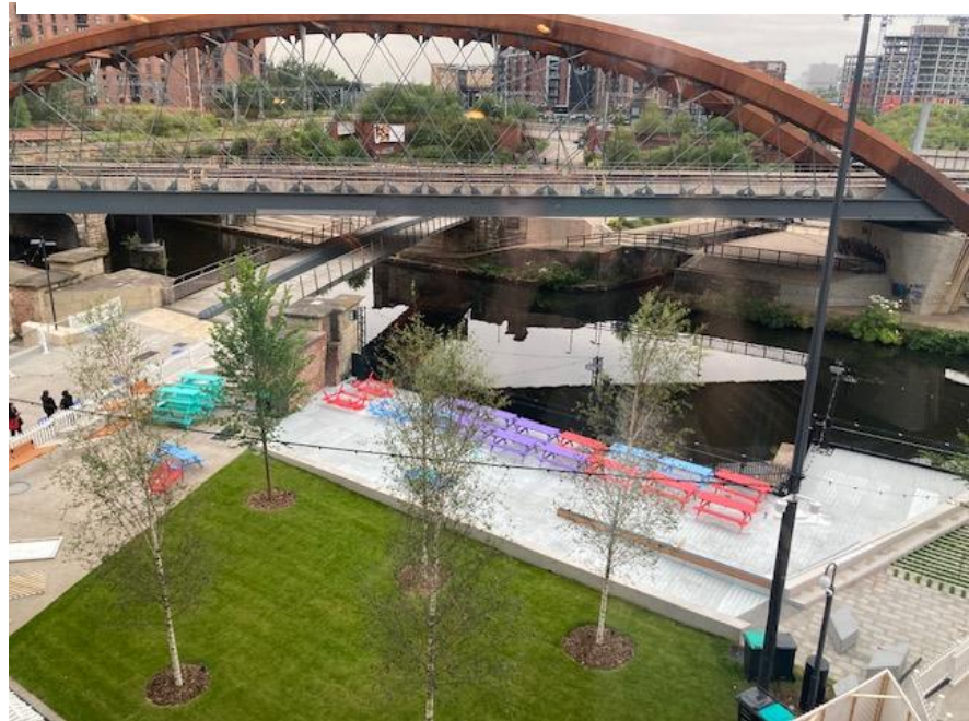
場館旁河畔廣場（River Square）可作為快閃活動、現場音樂及市集使用。曼徹斯特藝術節期間則為節慶廣場（Festival Square）單元舉辦的場地。