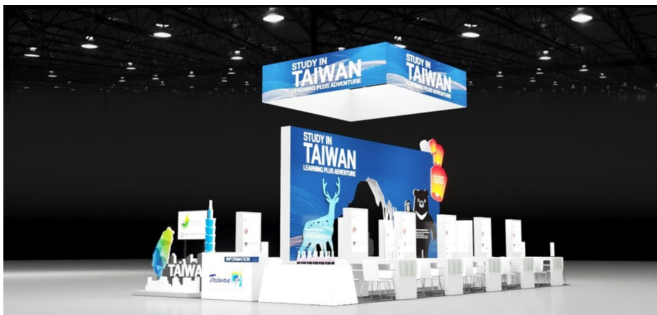
「Study in Taiwan」整體國家攤位設計形象

2023年亞太教育者年會展場於上午8點正式展開，李司長於一早前往我國「Study in Taiwan」展區，為我國團員加油打氣及勉勵。本次我國共有32所大學及中央研究院共67名人員聯合參展。我國攤位共分兩區，「Study in Taiwan」國家攤位以臺灣特色作為設計主軸，攤位正面有最具知名度的臺北101及臺灣地圖，側面背板則有臺灣黑熊、梅花鹿及天燈作為宣傳亮點。臺灣國家攤位對面另設有國立臺灣大學系統攤位，由國立臺灣大學、國立臺灣師範大學及國立臺灣科技大學合設。李司長於展場與多位國內大學代表討論如何推展教育國際化及招收外生等議題，並至其他國家攤位觀察各國設計及文宣，以作為日後教育部規劃參與各類國際教育展之參考。