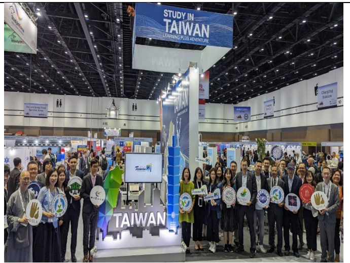
20230314李司長與國內大學代表於 APAIE 合影