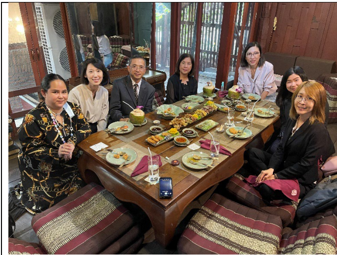
20230313與泰國臺教中心主任等人餐敘