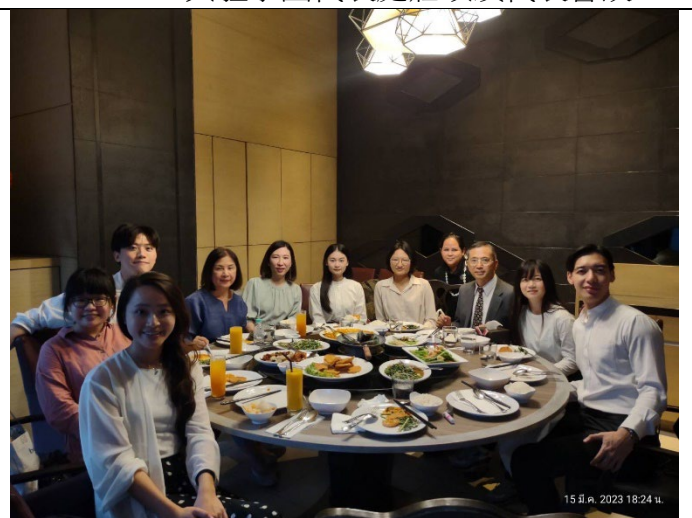
20230315與教育部公費生及華語教師餐敘