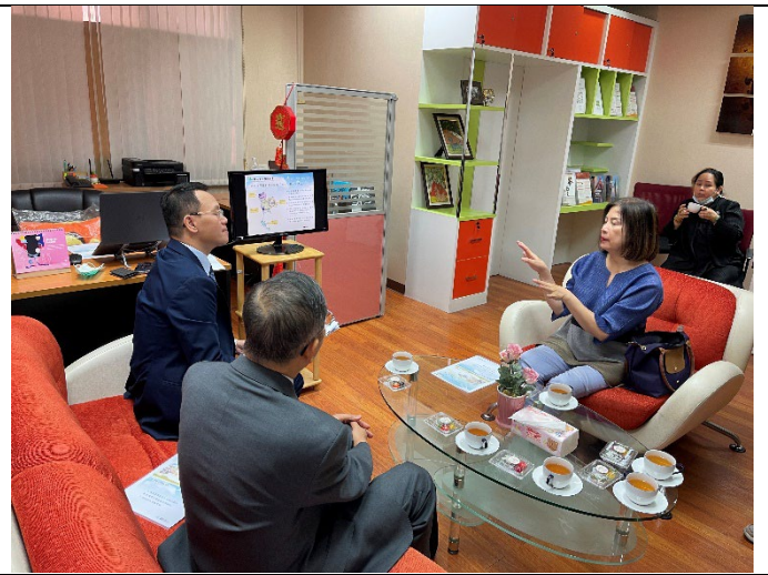
20230315聽取泰國臺灣教育中心業務簡報