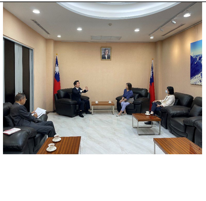
20230315與駐泰國代表處莊碩漢代表會談