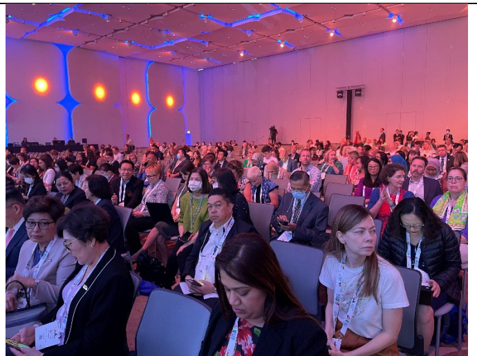
20230314出席 APAIE 大會開幕式