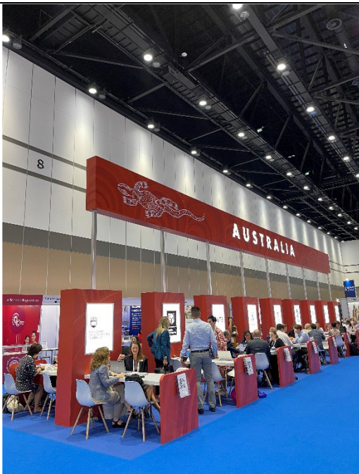
澳洲參展攤位設計