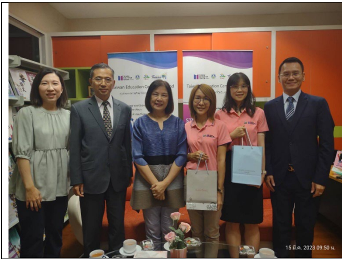
20230315拜會泰國臺灣教育中心