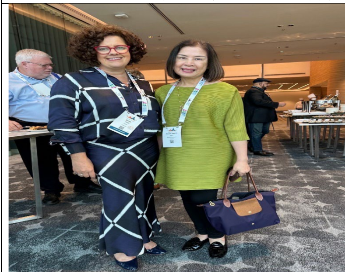
20230314李司長與 APAIE 主席 Sarah TODD 合影