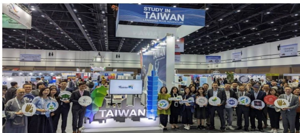
▲本次年會我國以「Study in Taiwan」為攤位主題聯合參展。