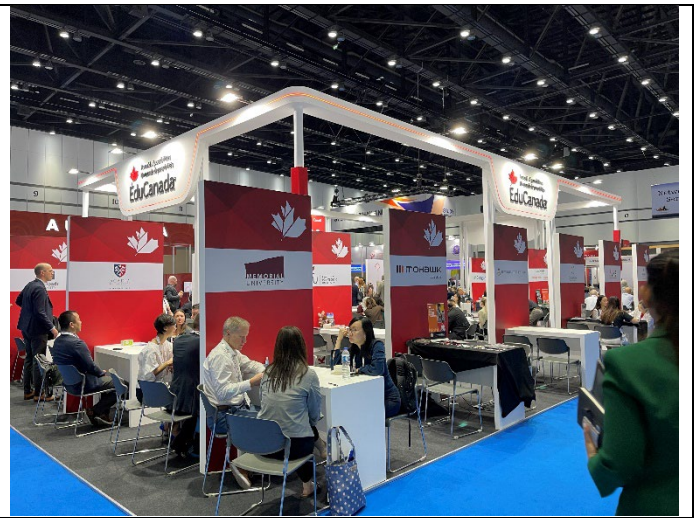
加拿大參展攤位設計