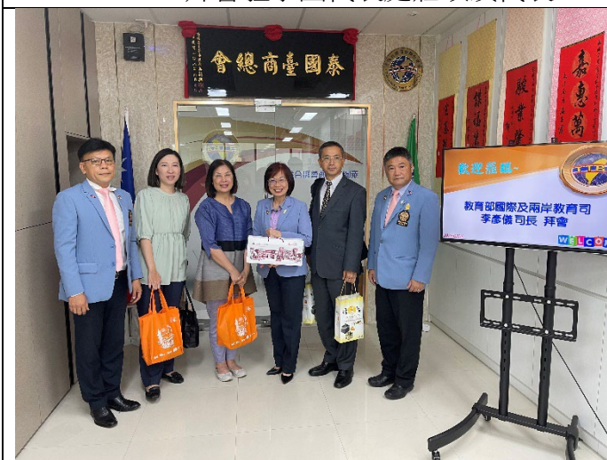
20230315拜會泰國台商總會