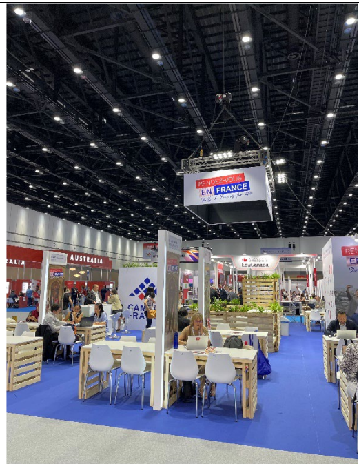
法國參展攤位設計