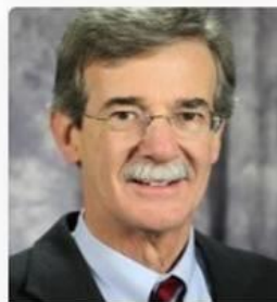
Brian Frosh Maryland