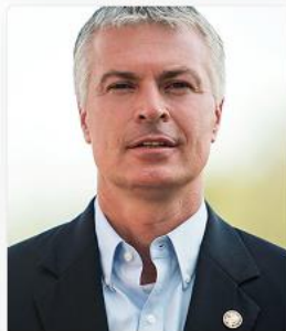
Marty Jackley South Dakota