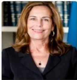
Kathy Jennings Delaware