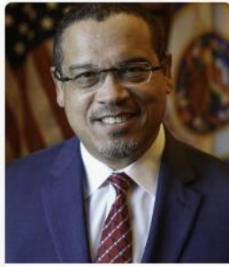
Keith Ellison Minnesota