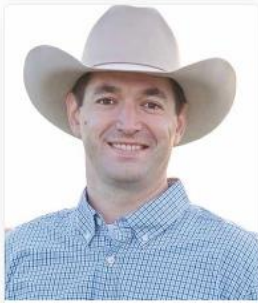
Austin Knudsen Montana