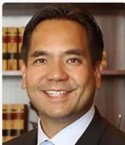
Sean Reyes Utah