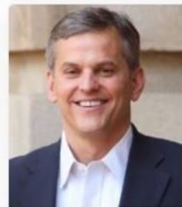
Josh Stein North Carolina