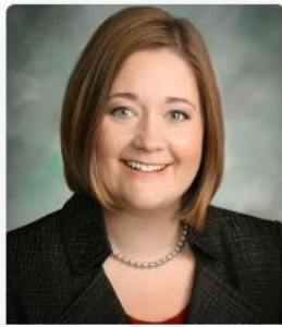
Brenna Bird Iowa