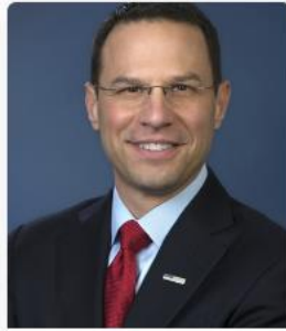
Josh Shapiro Pennsylvania