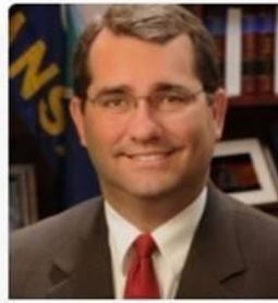
Derek Schmidt Kansas