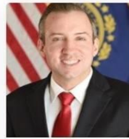
John Formella New Hampshire