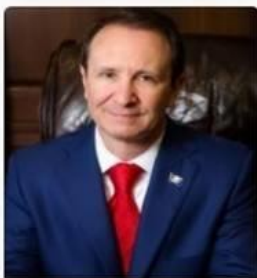
Jeff Landry Louisiana