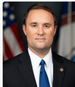
Jason Miyares Virginia