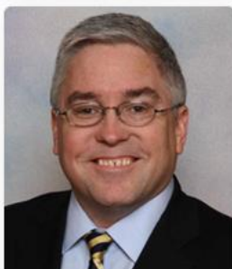
Patrick Morrissey West Virginia