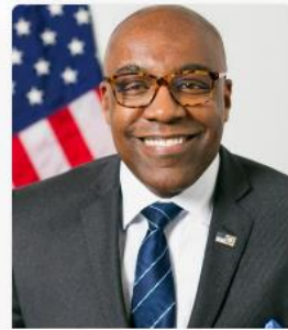
Kwame Raoul Illinois