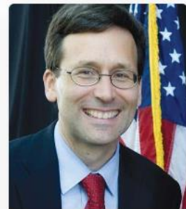
Bob Ferguson Washington