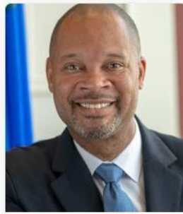
Aaron D. Ford Nevada