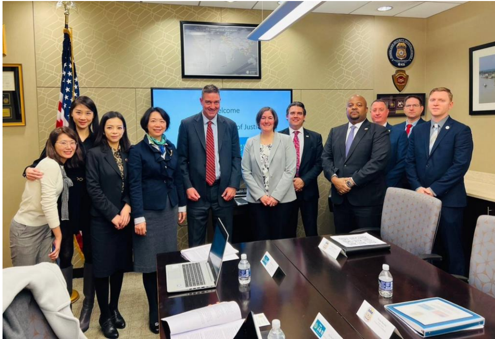
與 HSI 與會者合影