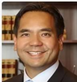
Sean Reyes Utah