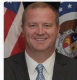
Eric Schmitt Missouri