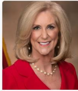
Lynn Fitch Mississippi