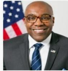
Kwame Raoul Illinois