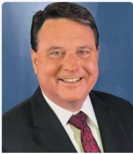
Todd Rokita Indiana