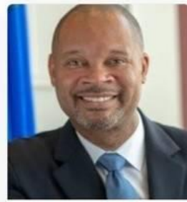
Aaron D. Ford Nevada