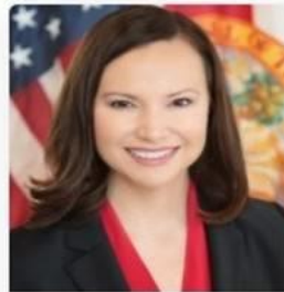
Ashley Moody Florida