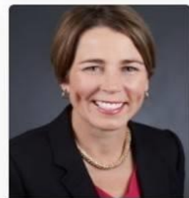
Maura Healey Massachusetts