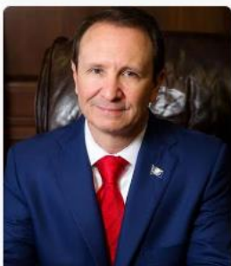
Jeff Landry Louisiana