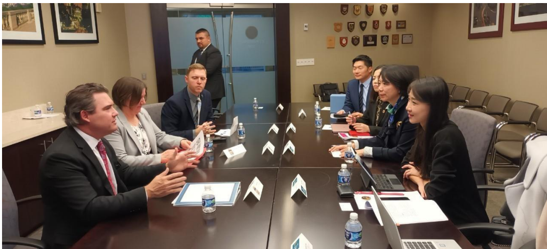
於 HSI 工作會談