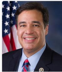
Raúl Labrador Idaho