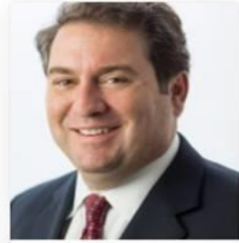
Mark Brnovich Arizona