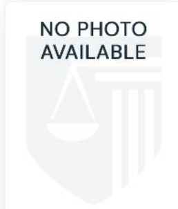
Andrew Bailey Missouri