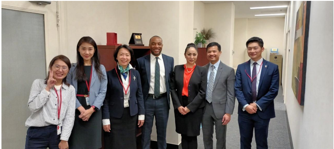
與 IRS-CI 與會者合影