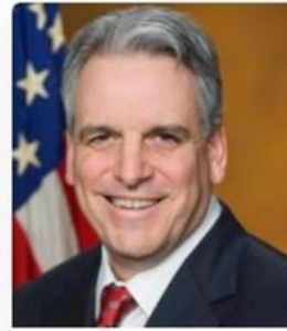
Peter F. Neronha Rhode Island