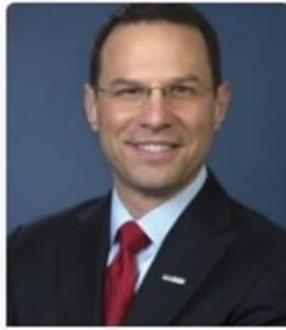
Josh Shapiro Pennsylvania