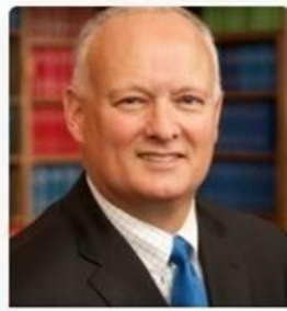
Doug Peterson Nebraska