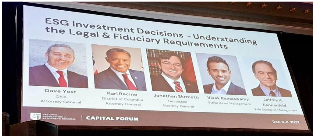
本場 ESG 座談會之主持人及與談人