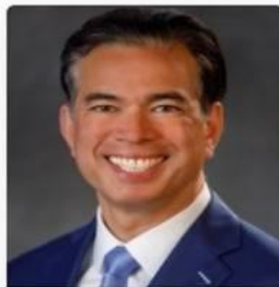
Rob Bonta California