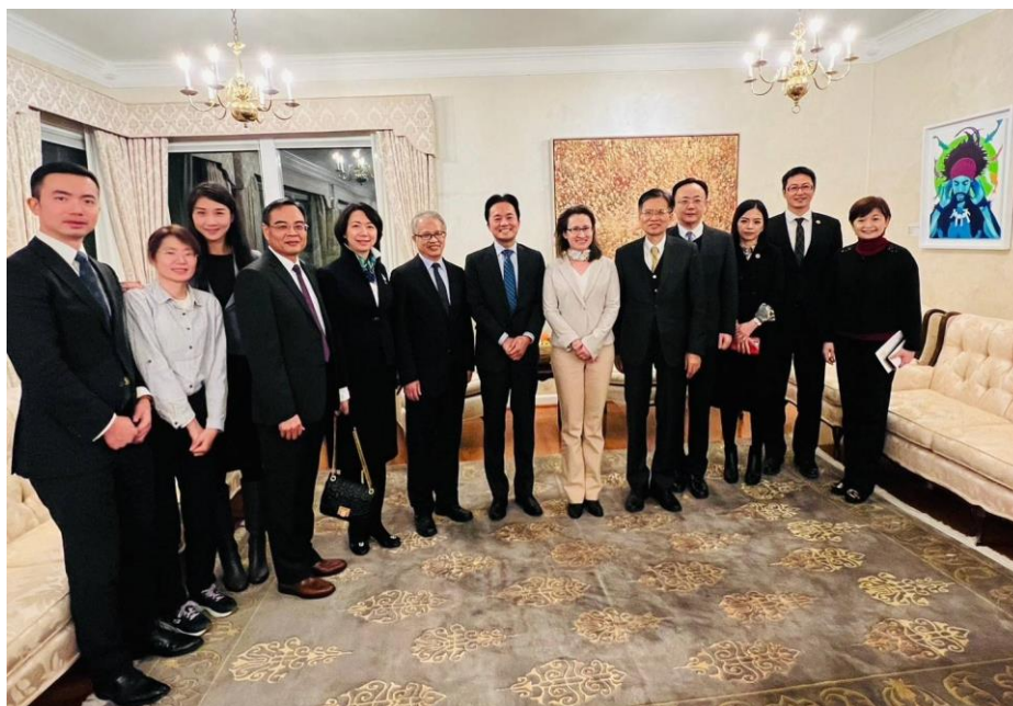
與蕭美琴大使、鄭榮俊公使合影

晚宴在十分歡樂的氣氛中結束，大家亦把握機會在此極具歷史意義的典雅宅邸內合影，今晚為本代表團在華府的行程劃下圓滿的句點。