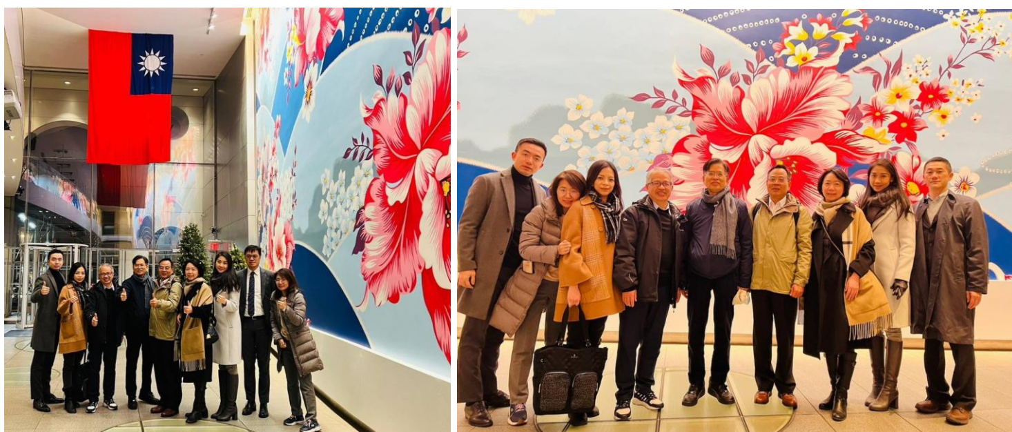
在駐紐約辦事處大廳《島嶼生活》畫作前合影

李大使向團員們介紹辦事處的歷史後，團員們承載滿滿的感官及知識收穫，向李大使及劉組長致上深深的謝意，於合影後，雙方均期許日後有更多交流互動，共同為增添臺灣在國際上的能量努力。