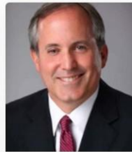
Ken Paxton Texas