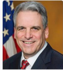
Peter F. Neronha Rhode Island