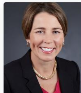
Maura Healey Massachusetts