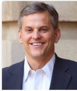
Josh Stein North Carolina