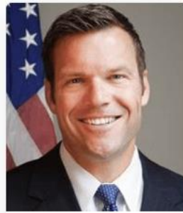
Kris Kobach Kansas