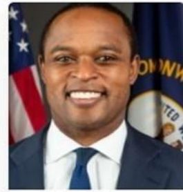
Daniel Cameron Kentucky