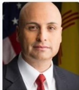
Hector Balderas New Mexico