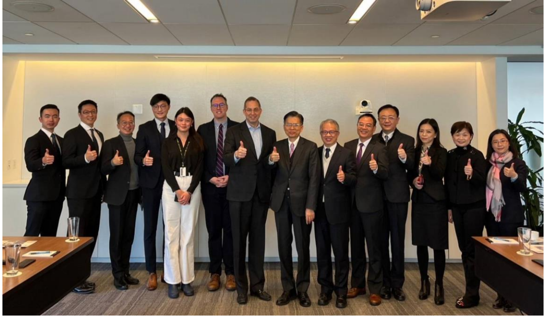
本代表團及廉政署團與 NDI 會長、亞太組資深顧問、香港籍工作人員合影