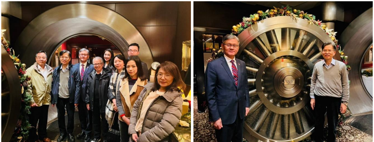
舊金庫門扇前合影

午宴氣氛十分輕鬆愉快，李大使並分享美光公司不久前宣布在紐約上州投資 1,000 億美元蓋建晶圓廠，比台積電多 2.5 倍，是紐約市最大的投資案，團員們亦向李大使分享目前美光案之進度 27 。用餐完畢，眾人在舊金庫門扇前合影，並約定下午前往辦事處參訪。