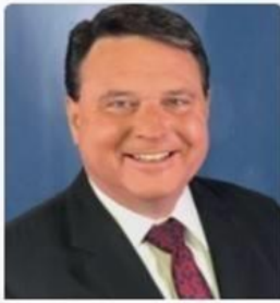
Todd Rokita Indiana