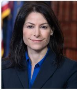
Dana Nessel Michigan