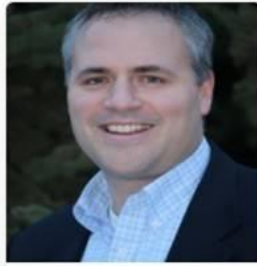
Treg Taylor Alaska