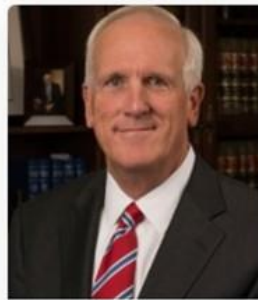
Herbert H. Slatery III Tennessee