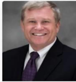
Lawrence Wasden Idaho