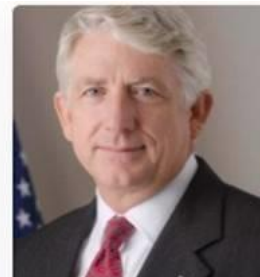
Mark Herring Virginia