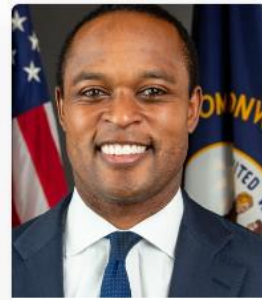
Daniel Cameron Kentucky