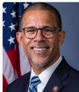
Anthony G. Brown Maryland