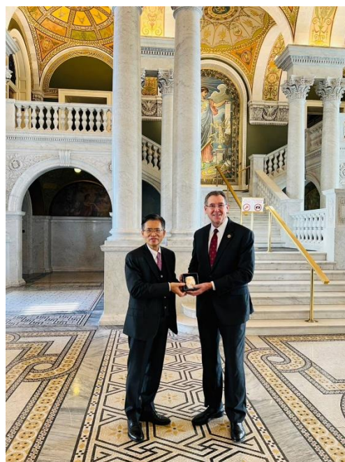
代表團與 Gregg Harper 在雕像大廳合影（左）；林次長致贈象徵平安祝福的天燈燭臺予 Gregg Harper（右）