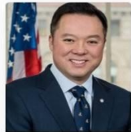
William Tong Connecticut