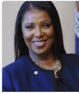
Letitia A. James New York