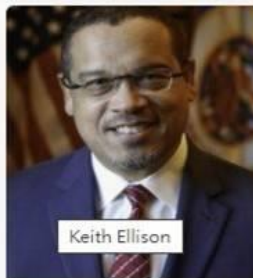
Keith Ellison Minnesota