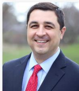
Josh Kaul Wisconsin