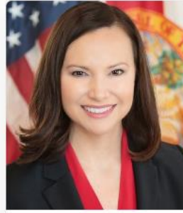
Ashley Moody Florida