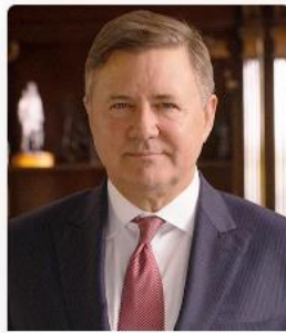
Gentner Drummond Oklahoma