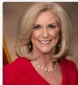
Lynn Fitch Mississippi