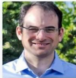
Phil Weiser Colorado