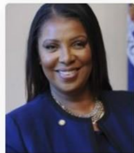
Letitia A. James New York