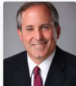
Ken Paxton Texas