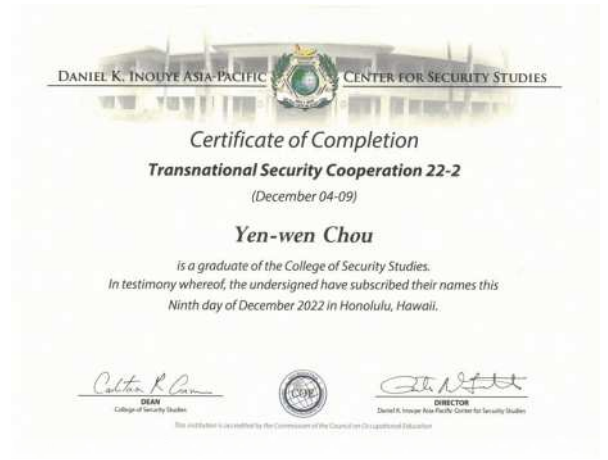
筆者獲頒之結業證書