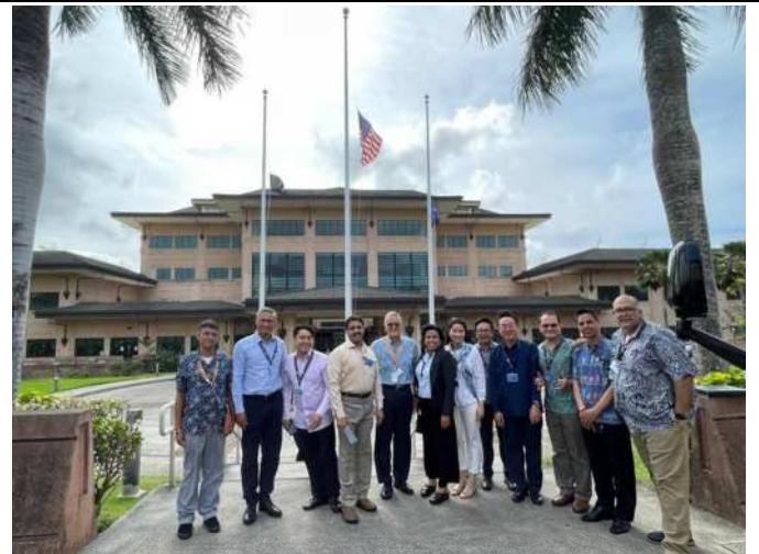
學員於印太司令部前與中心副主任合影