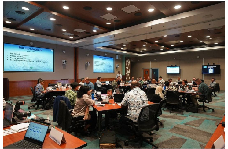
主題課程期間互動情形