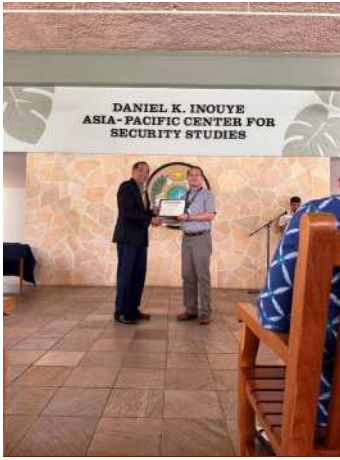
筆者接受中心主任頒贈結業證書