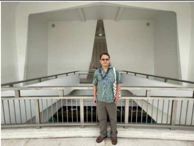
筆者於珍珠港亞利桑那號戰艦紀念館留影