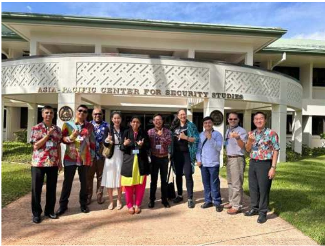
學員於中心前合影