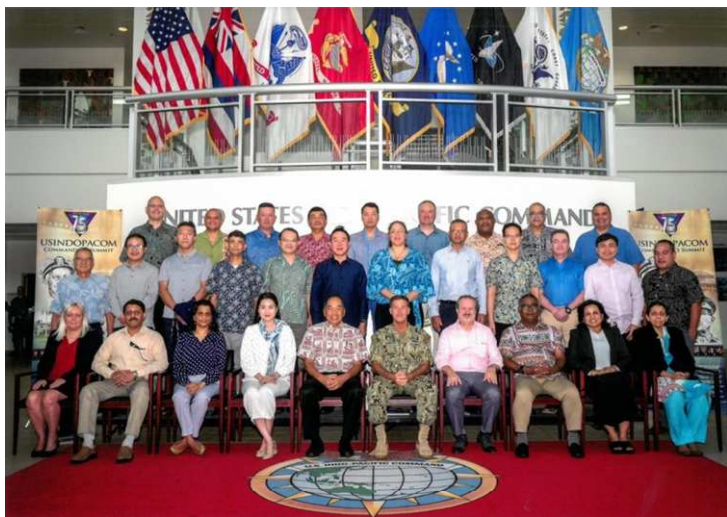
學員與印太司令部司令約翰·阿奎利諾上將合影