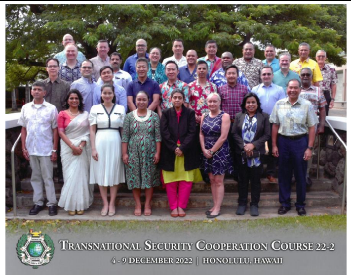
全體學員在中心結業紀念合影