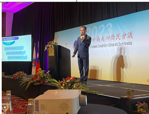
第三屆中南美洲僑民會議，僑務工作報告