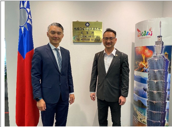
拜會駐墨爾本辦事處