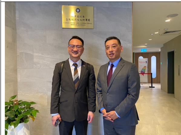
拜會駐布里斯班辦事處