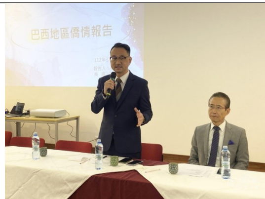
主持聖保羅地區僑務座談，聆聽僑界心聲