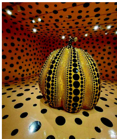
(草間彌生創作「南瓜」)

赫須巨集博物館為史密森尼學會一員，主要展示當代(二戰後近 50 年)的藝術品 1 。草間彌生為日本當代著名藝術家，1957 年移居美國，展露其前衛藝術創作，現則居日本。美國藝術網站 My Morden Met 將其選為「21 世紀十大前衛藝術家」 2 。