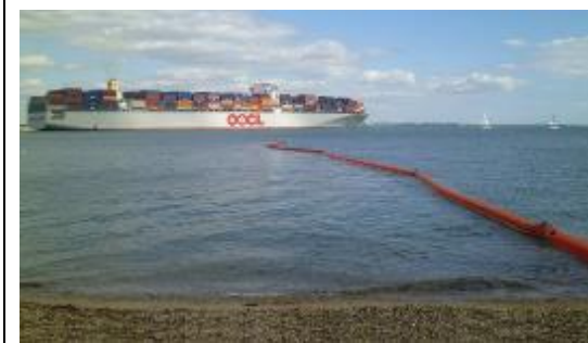
淺灘、沙灘攔油柵佈放作業 Beach Boom (Vikoma, U.K.)