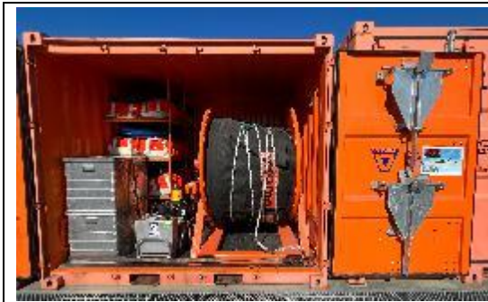
淺灘、沙灘攔油柵 Beach Boom (Vikoma, U.K.)