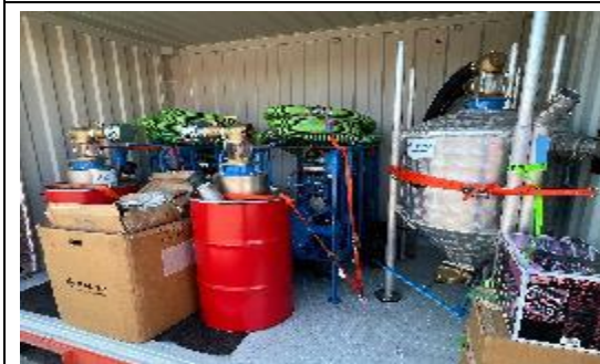
真空抽吸收集系統 Drum Filling Vacuum (ELASTEC, USA)