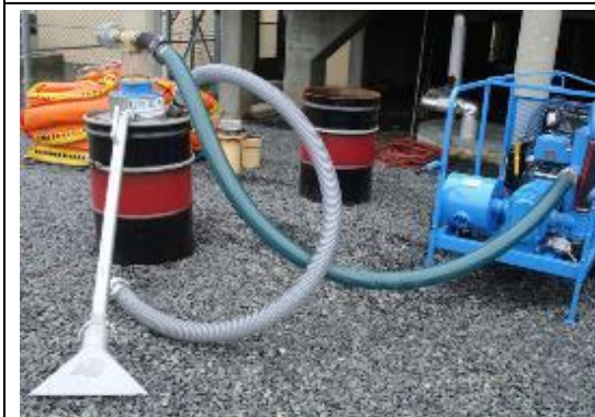
真空抽吸收集系統組裝完成 Drum Filling Vacuum (ELASTEC, USA)