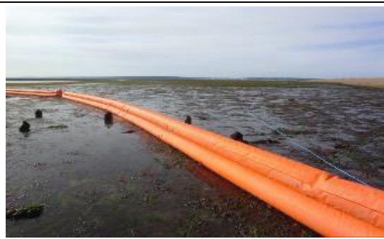
淺灘、沙灘攔油柵佈放作業 Beach Boom (Vikoma, U.K.)