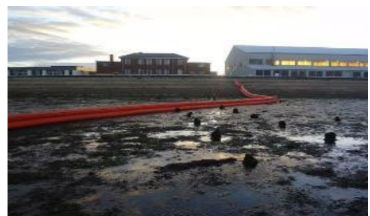
淺灘、沙灘攔油柵佈放作業 Beach Boom (Vikoma, U.K.)