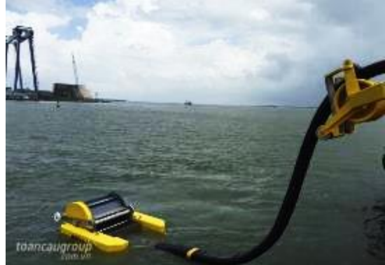
海上油污回收與輸送獨立整合系統 搭配含蠟或粘度極高的溢油回收單元 Hiwax Skimmer (Klemfare, USA)