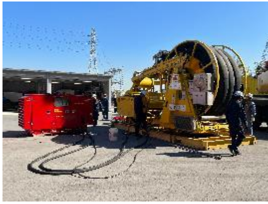
海上油污回收與輸送獨立整合系統 Hiwax Skimmer (Klemfare, USA)