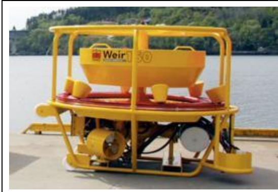
海上油污回收與輸送獨立整合系統 搭配高粘度的溢油堰式回收單元 Hiwax Skimmer (Klemfare, USA)