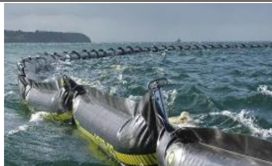
海上攔油柵佈放作業 Ro-Boom 1800