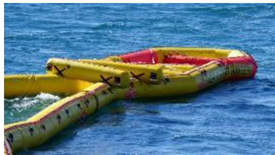
高速海上攔油系統汲油單元 (NOFI, Norway)