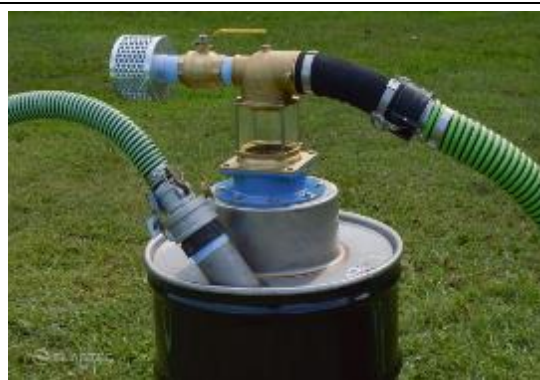
真空抽吸收集系統真空單元 Drum Filling Vacuum (ELASTEC, USA)