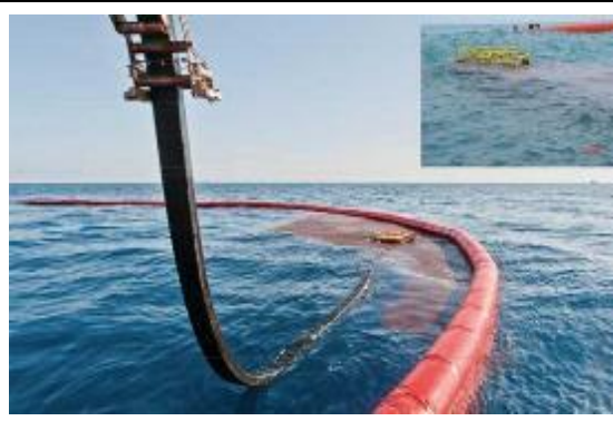
海上油污回收與輸送獨立整合系統 海上操作示意 Hiwax Skimmer (Klemfare, USA)