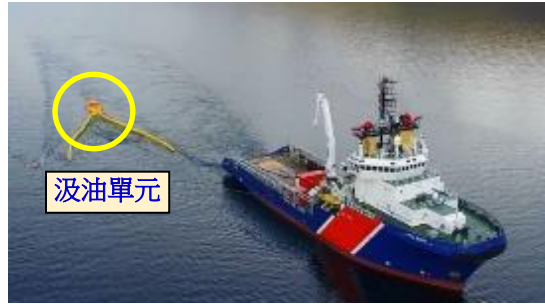
高速海上攔油系統 Current Buster (NOFI, Norway)