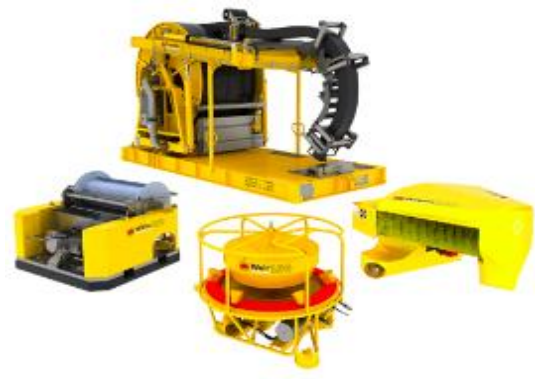
海上油污回收與輸送獨立整合系統 前端多用途汲油單元 Hiwax Skimmer (Klemfare, USA)