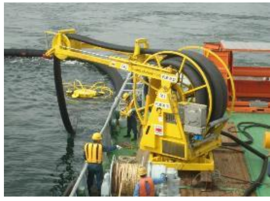
海上油污回收與輸送獨立整合系統 佈放作業 Hiwax Skimmer (Klemfare, USA)