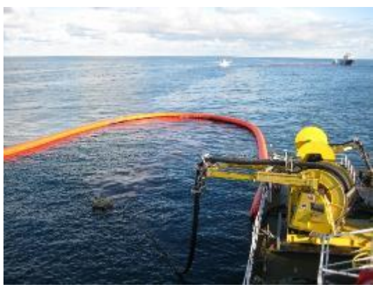
海上油污回收與輸送獨立整合系統 操作示意 Hiwax Skimmer (Klemfare, USA)