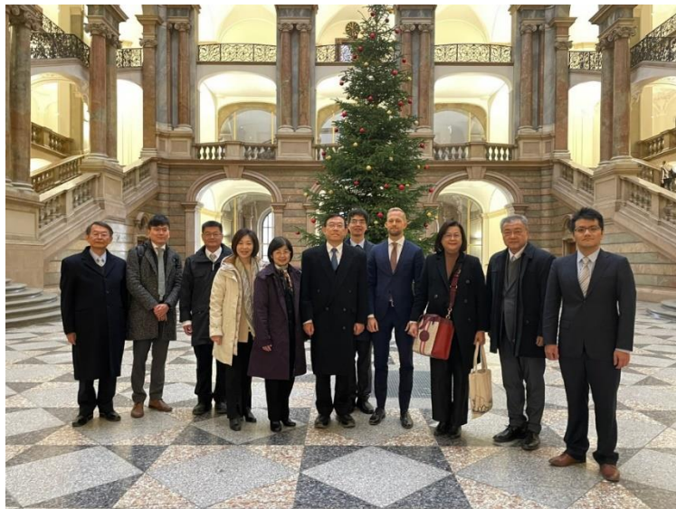
訪團與 König 檢察官在司法廳大廳合影