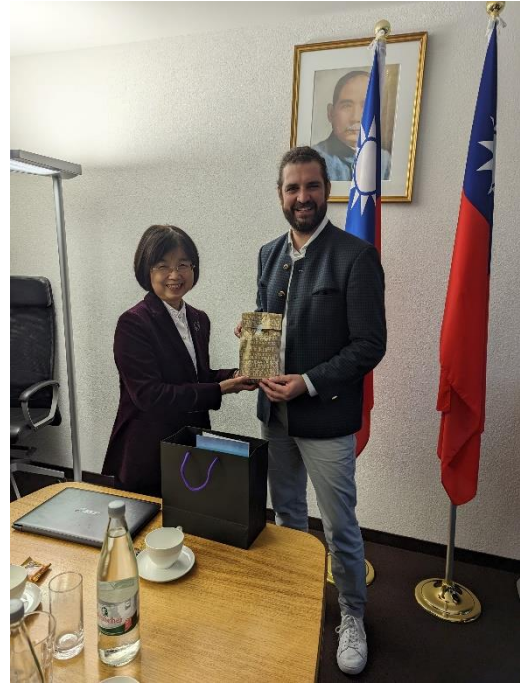
柯院長與 Krämer 律師相互致贈紀念品