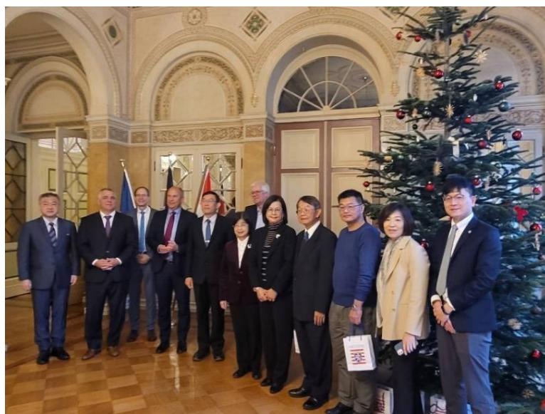
訪團與司法廳出席成員合照