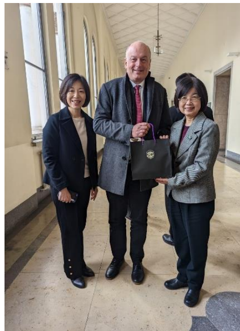
柯院長致贈 Satzger 教授紀念品