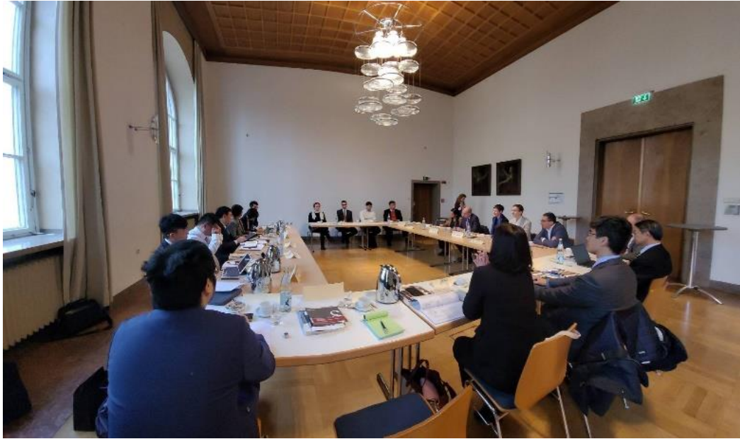
與慕尼黑大學法學院座談情形