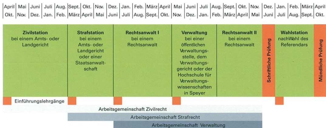
*巴登符騰堡邦實習時程表，該邦將律師實習切為兩階段各 4.5 個月

實習生的津貼各邦不同，在巴登符騰堡邦實習生津貼每月是稅前 1353 歐元（該邦基本工資為每小時 12.5 歐元），由前述的工資及福利局辦理發放；津貼以德國消費水準而言不高，因此實習生時有兼差打工賺取生活費的情形。訪團詢問民眾是否會質疑在多數實習生將來進入私部門工作的前提下，給予實習生津貼的正當性？Leßner 局長回應為了所有法律人的水準齊平、整體國家法制建設的提昇，這是必要的支出。