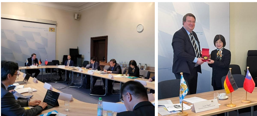
柯院長致贈 Tiesel 局長紀念品

另外訪團詢問：實習生通過第 2 次國家考試後，有沒有限制多久以內要申請法官、檢察官？Tiesel 局長表示法律沒有規定，因為第 2 次國家考試成績永久有效。曾經有一個極端案例，實習生於大學階段同時主修神學，第 1 次國家考試通後去當修士，後來認為自己比較適合擔任司法官，所以很久後才申請參加實習並通過第 2 次國家考試。不過還是要注意 45 歲的申請年齡限制，並儘量在通過第 2 次國家考試的 3 年內申請當法官或檢察官。例如在場的 Lorenz König 調辦事檢察官，他本人就是超過 3 年後才申請，面試時就會被特別問是否記得受訓時的內容。