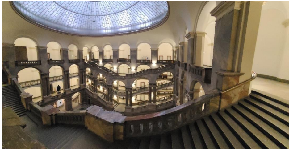
司法廳內部樣貌，部分廳舍為法院，該處前身為皇宮