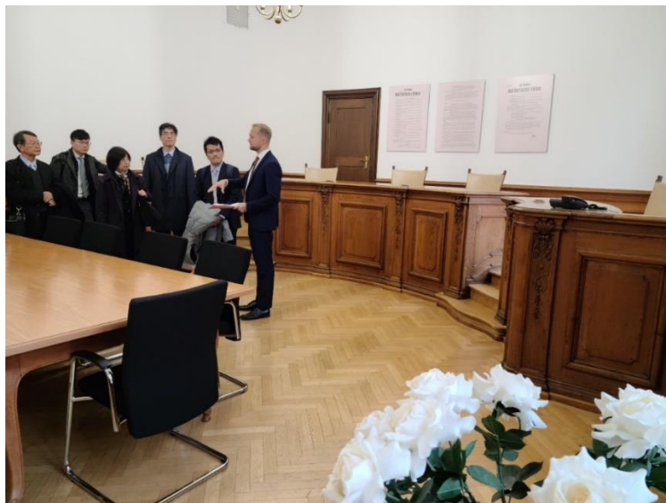
König 檢察官介紹二戰期間與德國司法史有關的白玫瑰運動