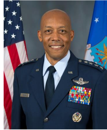
空軍參謀長 General Charles Brown