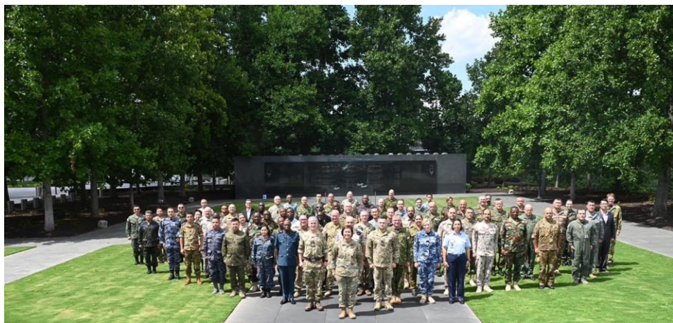
美空軍紀念碑官方合照

當日下午議程結束，即由美空軍率隊前往美空軍紀念碑 (USAF Memorial) 進行官方合照。