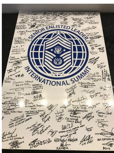
世界各國與會代表簽名紀念