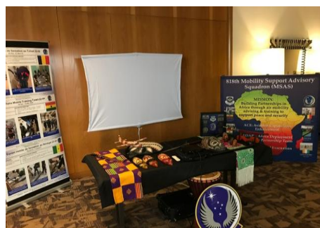
818 移動支援顧問中隊 (MSAS) 介紹