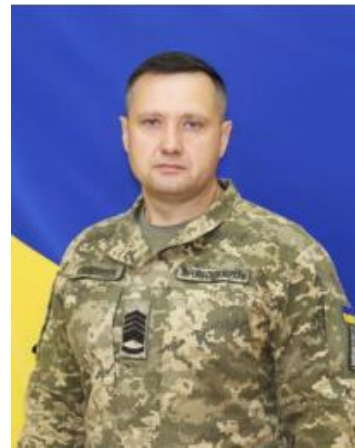
烏克蘭空軍士官督導長 Kostiantyn Stanislavchuk

去 8 年，烏國空軍承受各項風險及計畫應對，許多人認為應該藉由政治力量來避免衝突，但戰爭一旦展開了就要面對，空軍若被打敗即失去了空域，對於俄國現聚焦大量空優，烏國正戮力使用後備力量補充，烏國人數少，僅能依靠有限兵力，以 2 架攔截 4 架、4 架攔截 8 架、8 架攔截 12 架等作為來應對俄國的大量兵力優勢，勇敢接戰，堅持精神及毅力。透過專業培訓、動員，士官是扮演重要決策之一，士官要能透過自我決策執行小兵力作戰，不能依賴將軍或指揮官下達命令，根據北約部隊模式，士官永遠走在士兵前面，士督長則要有能力直接指揮作戰，在此感謝每個幫助烏國的人、國家，並非僅捍衛烏國的民主，而是全世界的和平。