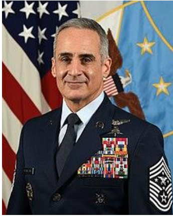
參謀首長聯席會資深士官顧問 SEAC Ramón Colón-López

重要的投資，能集結人才、知識、團結，這才是邁向成功的三要素。再次強調，每一階層的士官兵皆為最重要的，要擰結成一體化力量，才能打破現今尚存在的官僚主義及其他問題。