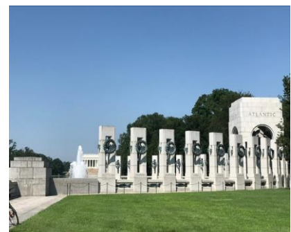
二戰紀念碑-大西洋戰爭 World War II Memorial-Atlantic