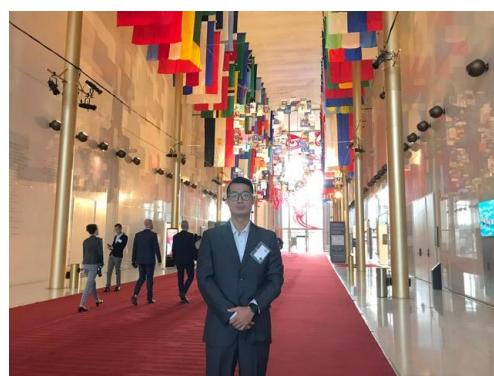
甘迺迪藝術中心 Kennedy Center for the Performing Arts