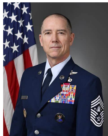
美太空軍士官督導長 CMSSF Roger A. Towberman