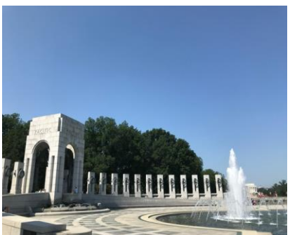
二戰紀念碑-太平洋戰爭 World War II Memorial-Pacific