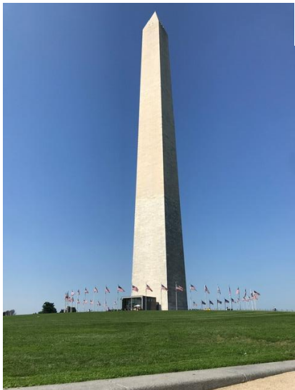
華盛頓紀念碑 Washington Monument