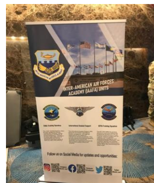
美洲國家空軍學院介紹