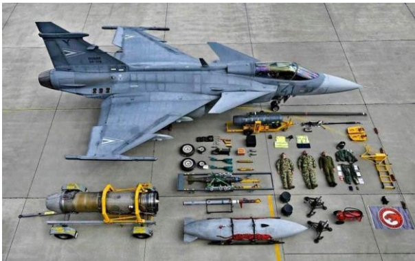
瑞典空軍裝備陳展圖

包含飛行員的素質提升，隨時保持機動修復能量（如：設立移動式棚廠，安置移動輪組，以保持快速移動、整備），保持基地的可變動性，但指揮官須仰賴健全的士官體制運行，對照俄羅斯空軍尚維持老舊戰術，瑞典的機動性發展是正確的。瑞典空軍沒有軍士官之別，只有專業之分，共同教學相長，相呼應。瑞典目前設定為全募兵制度，男女比例為各 50%，目標就是為了取得菁英人才，沒有性別之分。不同國家，文化也不同，軍士官兵彼此間要能互相信任，並盡力解決各項問題，有效培訓士官，運用靈活戰場模式必須不停的訓練磨合。