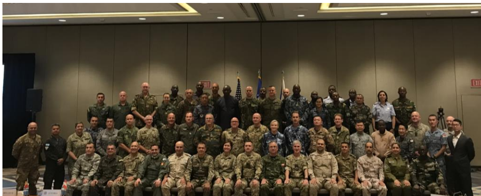
於會議廳各國代表進行官方合照