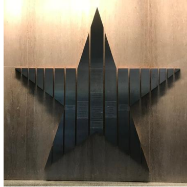
存放於美國歷史博物館 歷史上參戰犧牲的英雄