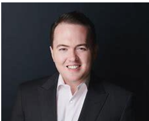
作者 Emerson Brooking

戰爭是政治的延續，歷史名將拿破崙說過：戰爭要直接打中心點，現今運用媒體來動搖人民已是一貫手段，早期德國與愛爾蘭的戰爭即實施資訊戰，但礙於設備不足成效有限；越戰時，運用運輸機發放宣傳單、衛生紙也是，而現今網路就像電報一樣，且產生了一對一的效果，廣大的接受群注意力是有限的，因此需要爭取最短的效果。最早的網路戰爭發生在 1994 年，墨西哥的 Zapatistas 民族解放軍，是第一支把網路「武器化」的軍隊，他們透過網路進行世界性的串連，迫使墨西哥政府停止圍剿軍事行動；1999 年，法輪功對中共政府的反抗，以及西雅圖的反全球化運動中，網際網路的串連都扮演了舉足輕重的角色，社群媒體降世二十年後，從 2011 年的佔領華爾街運動；2014 年，伊拉克年輕人運用社群軟體-推特 (Twitter) 讓大家認識 ISIS，讓近 100 多國的民眾加入了 ISIS，運用媒體拍攝殺人恐嚇的視頻畫面，乃至於港臺的兩傘運動及太陽花運動，透過社群媒體的新連結形式，為組織運作提供了新想像；現今 2022 年，烏俄戰爭也同樣運用社群媒體來散播假消息，在網路的注意力是短暫的，澄清事實須集中運用網路傳播，同樣也要能忍受錯誤，現今的科技技術，已可使用人工智慧 (AI) 來辨識訊息的真假，網路傳播假訊息，在人類有思考意識時可能無效，但當成為無意識思考時是極具效果的，所以要依賴教育，即時澄清。