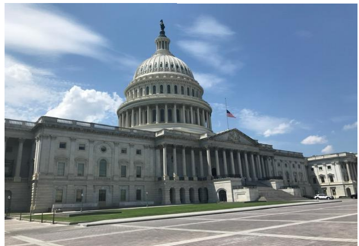
美國國會 US Capitol Building