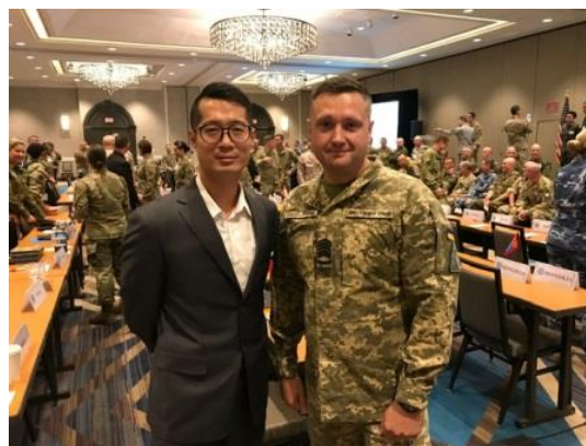
烏克蘭空軍士官督導長 Kostiantyn 特別向臺灣代表致意及勉勵

最後，希望臺灣所有空軍人（AIRMEN）都能堅定信念，勇於挑戰，充實自我，追逐自己的夢想，當然最重要就是拿出態度「我空軍，我驕傲，I'm NCO, I'm proud, aim to fly, fight, and win！」