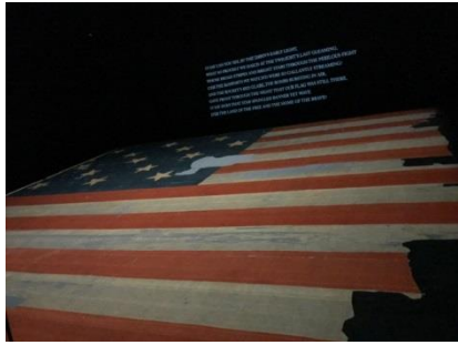
存放於美國歷史博物館 經過戰火洗禮的美國國旗

本日為參訪行程，由美空軍派遣軍車，上午集體前往美國歷史博物館（National American History Museum）、華盛頓紀念碑（Washington Monument）、國家二戰紀念碑（National World War II Memorial），下午前往參觀美國國會（US Capitol Building）。