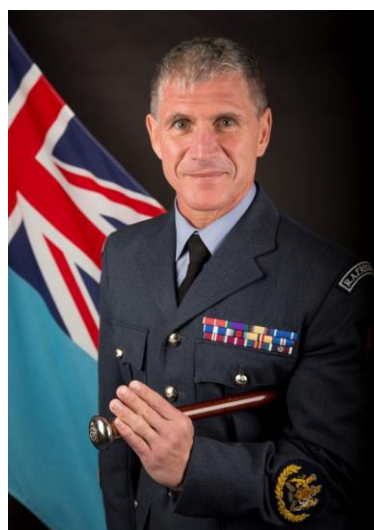
英國皇家空軍士官督導長 Jake Alpert MBE

書，未來戰爭模式將大幅改變，現今戰爭模式已進入數位時代，體能非唯一重點應具有彈性，英國已提升女性從軍比例至 30%，科技亦要保持彈性，未來的情報發展均須多元化，「士官」並非是戰略性考量，而是科技實務的執行者，學習非戰略手段，而是要肯定自我價值，未來 10 年的重點在於如何留住人才於軍中服務，部隊無法像民間機構團體支付高薪，但要能讓其肯定自我價值，達到多專多能。對未來戰爭應設立顧問專門辦公室來整合意見，在科技領軍的時代，未來可能連貓、狗等動物皆能穿上防彈衣進入戰場執行任務，英國現有 1/3 具碩士學位的士官人才，正逐步提升技能，若超過軍官的能力，可以提高薪餉得以發揮，5 年內皆應做好準備才能放眼未來。