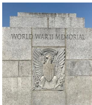
二戰紀念碑 World War II Memorial