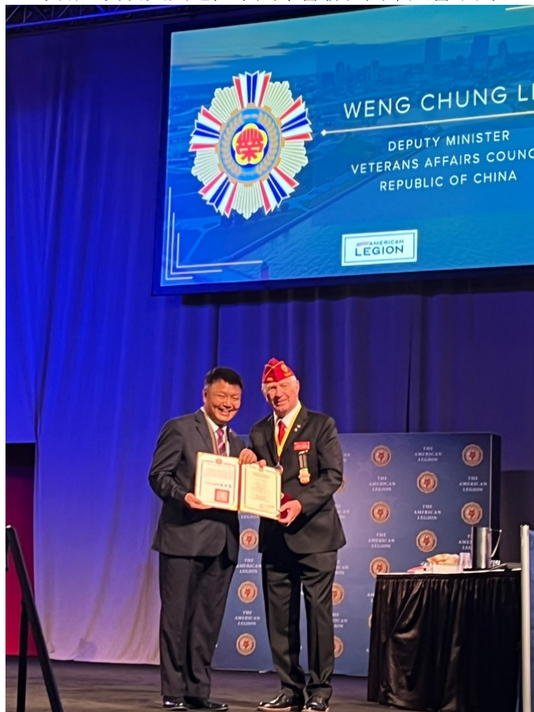
李副主委頒贈一等榮光專業獎章證書予美國退伍軍團協會總會會長