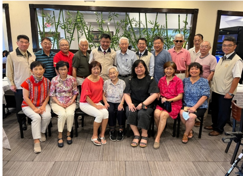
李副主委與紐澤西榮光會代表合影