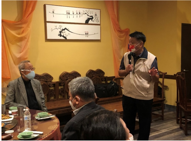
李副主委於華府榮光會代表餐會席間致詞