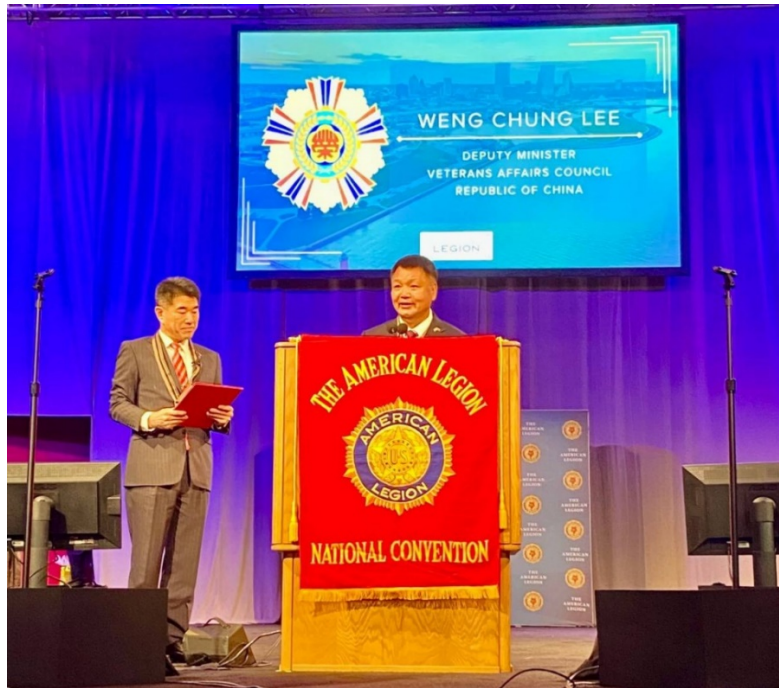
李副主委於美國退伍軍團年會聯合開幕大會致詞