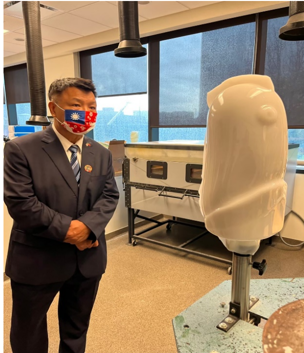
李副主委檢視三D列印義肢製作半成品