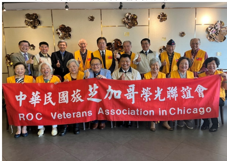
李副主委與芝加哥榮光會理監事代表合影