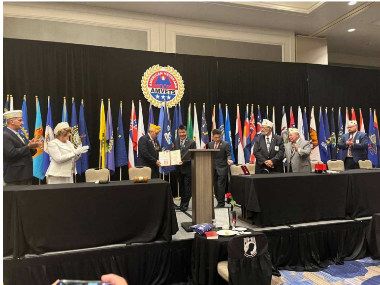
李副主委頒贈AMVETS總會長一等榮光專業獎章證書