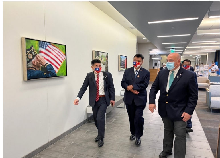
李副主委參訪紐奧良退伍軍人醫院