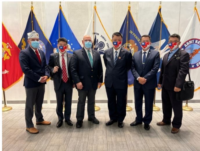
李副主委與退伍軍人醫院主管合影