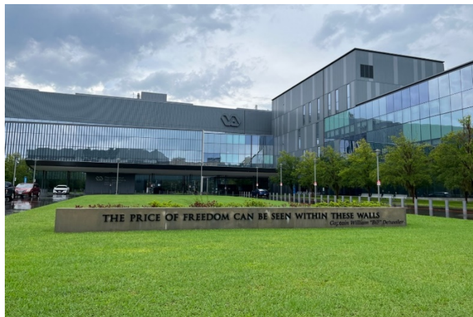
退伍軍人醫院前的標語凸顯國家對於退伍軍人的尊崇 (標語：自由的代價見諸於在院內就診的退伍軍人身上)