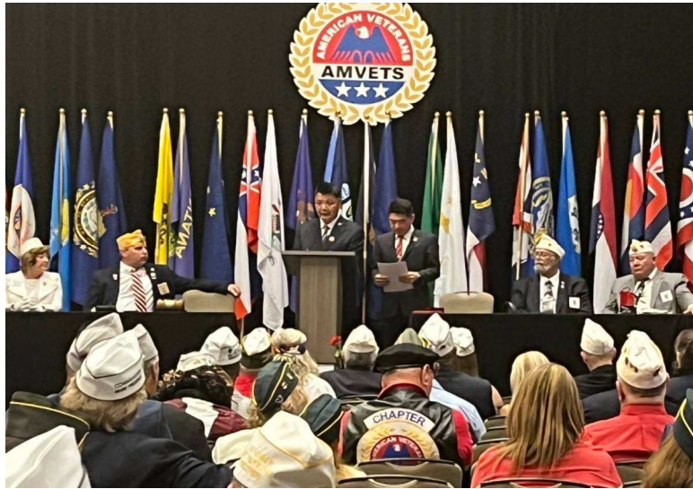
李副主委於AMVETS年會聯合開幕大會致詞